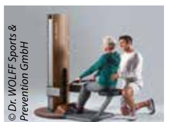
© Dr. WOLFF Sports & Prevention GmbH