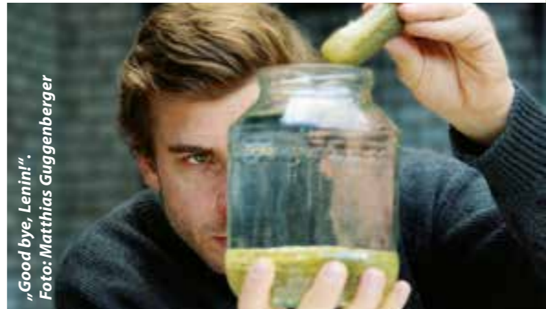
„Good bye, Lenin!“

Die Abo-Preise liegen zwischen 58,50 und 173,80 Euro. Einzelkarten kosten in der 1. Preisklasse 24 Euro (erm. 20 Euro), in der 2. Preisklasse 21 Euro (erm. 17 Euro), in der 3. Preisklasse auf der Tribüne 18 Euro (erm. 14 Euro) und auf der Galerie 13 Euro (erm. 10 Euro), jeweils zzgl. Gebühren. Tickets gibt's unter www.kultur-in-unna.de (ab 4. Okt. 2023). Die Programme liegen an einigen bekannten Stellen in Unna aus oder können beim Bereich Kultur angefordert werden. Außerdem stehen sie zum Download auf www.kultur-in-unna.de bereit.