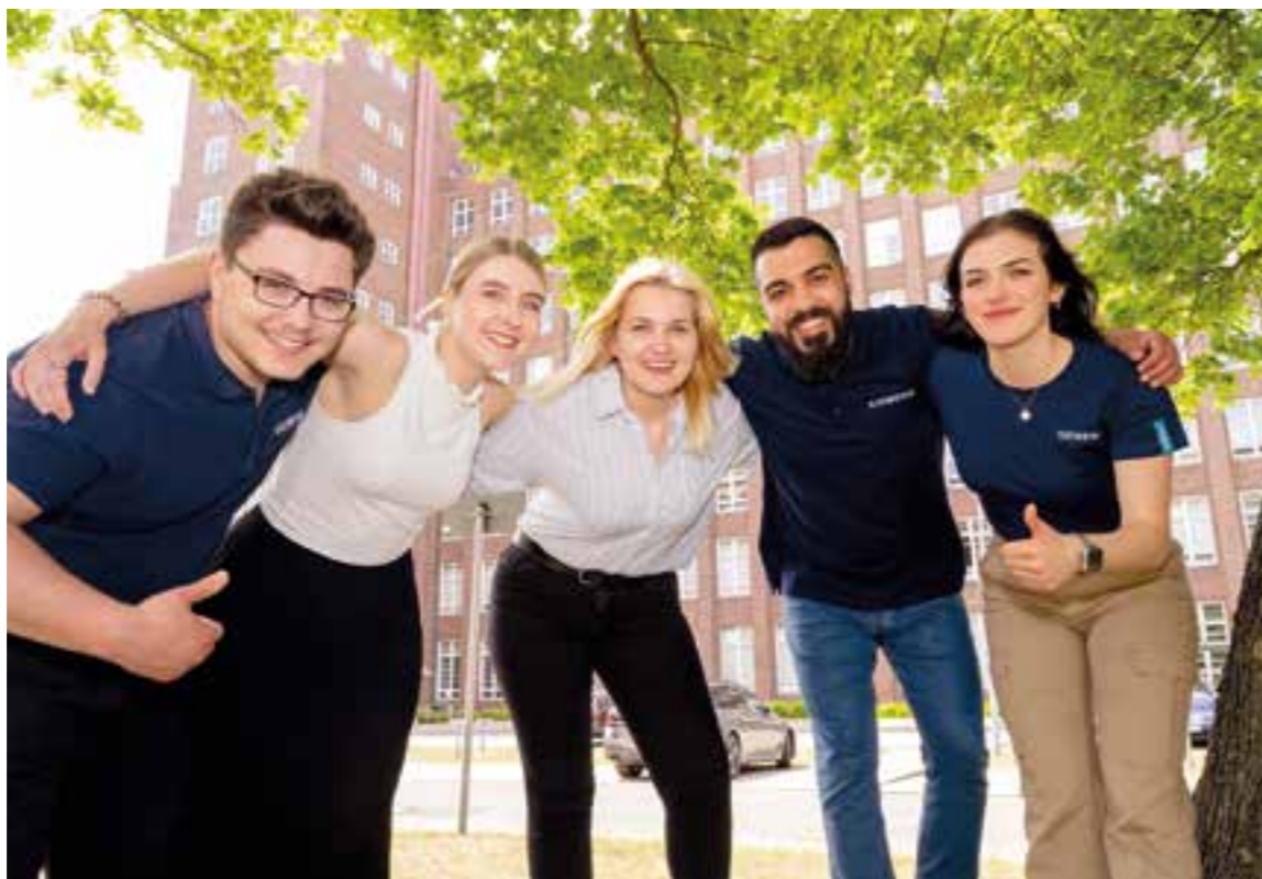
Junge Karrierestarter sollten ihr späteres Betätigungsfeld nach persönlichen Neigungen wählen.

„Zuerst einmal sollten Einsteiger sich darüber im Klaren sein, dass jeder Beruf ganz viele Möglichkeiten und vor allem Chancen >>>