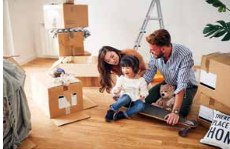
Den Traum vom eigenen Zuhause können Familien auch in der aktuellen Zinssituation noch verwirklichen.