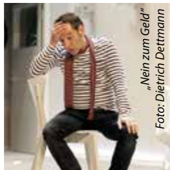
„Nein zum Geld“

Die Vorbereitungen für die Ende Oktober beginnende Theatersaison 2023/24 mit insgesamt acht Aufführungen in der Stadthalle Unna laufen auf Hochtouren.