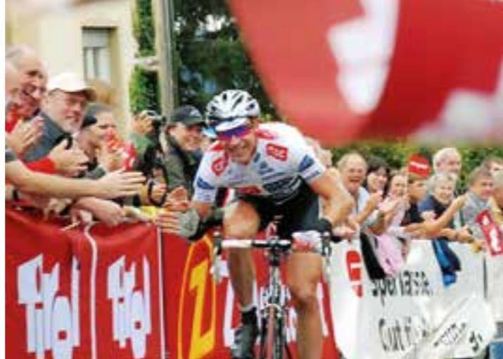
Jens Voigt am Eulenberg in Fröndenberg.

Die Karawane des Radrennens, das in 190 Ländern übertragen wird, zieht an diesem Tag voraussichtlich zwischen 14 Uhr (Stadtmitte) und 14.20 Uhr (Altendorf) durch Fröndenberg. Ausgehend von der Ruhrbrücke, weiter über den Eulenberg, Frömer, Strickherdicke und Dellwig bis nach Altendorf, „erfahren“ die Profis Fröndenberg und fahren dann über Unna-Billmerich zum Schloss Opherdicke.