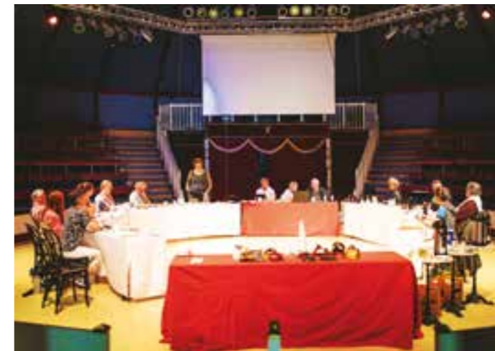
Das Ensemble des Stücks „Der Jupp muss wech!“ im Circus Travados bei der ersten Leseprobe des Stücks.

Mit dem Großprojekt geht der Circus Travados in seinem Jubiläumsjahr spannende und unterhaltsame, aber auch anregende (neue) Wege. Für die Produktion des Stückes sowie den anschließenden Aufführungsreigen (zurzeit sind mindestens zehn Vorstellungen eingeplant) konnten gut 200.000 Euro Finanzmittel bei verschiedenen