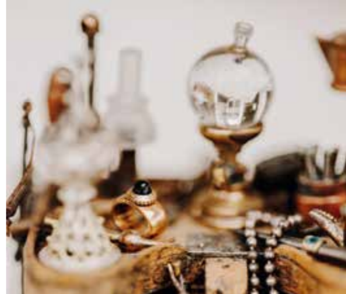
Hier gut zu erkennen: die kostbare Öllampe, die in voller Größe die Museumswerkstatt ziert.

Umso wichtiger ist es, gerade den traditionellen Aspekt der Goldschmiedekunst zu wahren, historische Arbeitstechniken als auch Werkzeuge neben modernen High-Tech-Geräten zu verwenden. Die Museumswerkstatt, die in das Atelier eingezogen ist, ist nicht nur ein wunderschöner Hingucker, sondern auch voll funktionsfähig. Hier finden sich Gerätschaften wie ural-