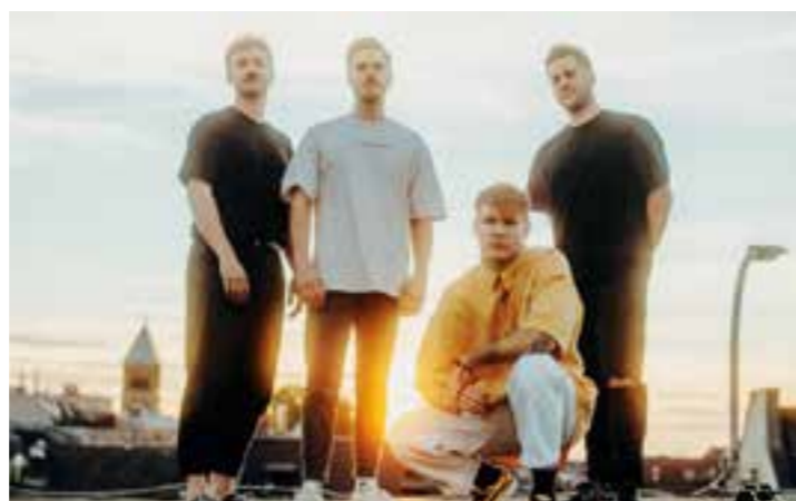
„FLASH FORWARD“

Bands Auf zwei Bühnen, die in diesem Jahr in „Laut“- und „Lästig“-Bühne umbenannt wurden, sorgen Bands unterschiedlichster Genres – von Singer-Songwriter über Pop-Punk und Grunge bis hin zu Metal – für Stimmung. Als Headliner konnten die Organisatoren „FLASH FORWARD“ aus dem Ruhrgebiet gewinnen. Ihre Stärke sind mitreißende Alternative-Songs und unvergessliche Hooklines, die den Spagat zwischen Radio und Rockclub mühelos bewältigen. „Endings = Beginnings“ heißt das aktuelle Album des Quartetts aus NRW. Ein mutmachendes Credo, das im Moment der Veränderung