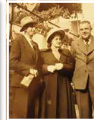
Unna Seite 9 Ahnenforschung