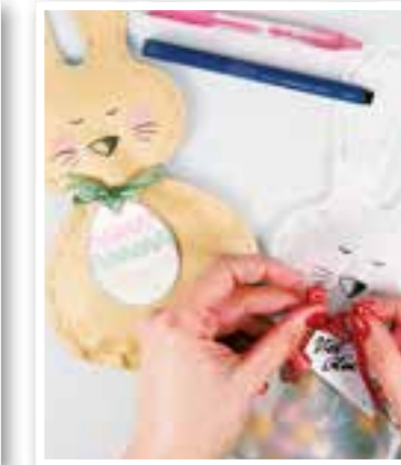
Ostern Seite 22 Basteltipp

Impressum Ortszeit Kreis Unna Herausgeber und Verlag: FKW – Fachverlag für Kommunikation und Werbung GmbH Delecker Weg 33 59519 Möhnesee-Wippringsen Telefon: 02924/87 970-0 Telefax: 02924/87 970-29 E-Mail: info@fkwverlag.com