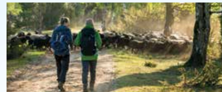
Eine Auszeit vom gewohnten Trott: Die naturbelassenen Pfade der Lüneburger Heide sind zu jeder Jahreszeit ein Erlebnis.

Ostern gehört zu den beliebten Reisezeiten im Jahr. Um das christliche Fest fallen die Schulferien und viele Reiseanbieter locken mit verführerischen und günstigen Angeboten zum super Preis. Egal ob ein Kurzurlaub, Wellness, Städtereise oder Pauschalurlaub: für jeden Geschmack ist etwas dabei. Wer sich sein Lieblingsziel sichern möchte, der sollte schon jetzt die Augen offen halten.