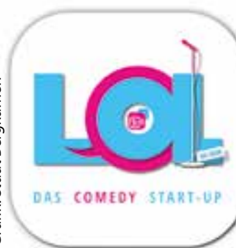
Grafik: Stadt Bergkamen

„LOL – Das Comedy Start-up“ ist zurück! Nach der erfolgreichen Premiere im November 2022 findet auch 2023 die unterhaltsame Stand-up Mixed Show mit den neuen aufstrebenden Comedians und Comediennes der deutschsprachigen Stand-up-Szene statt.