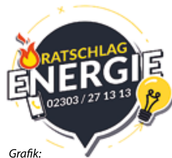
Grafik: Matthias Horstmann/Kreis Unna

Schuldnerberatung und Verbraucherzentrale NRW sowie Agentur für Arbeit und Jobcenter Kreis Unna waren unter anderem an der Konzeption beteiligt. Der gemeinsame Anspruch ist, Menschen im Kreis Unna zu helfen – und zwar insbesondere diejenigen, die bislang gut über die Runden gekommen sind und noch keinen Kontakt zu Beratungsleistungen dieser Art hatten. Das Angebot sollte simpel sein, die Wirkung aber möglichst groß. Und was ist einfacher, als eine Telefonnummer zu wählen? Wer den