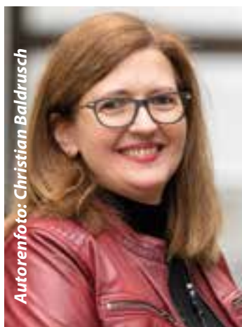
Autorenfoto: Christian Baldrusch

Überfall auf eine Antiquitätenhandlung in Unna. Die Inhaberin wird getötet, der zur Hilfe geeilte Kripobeamte niedergeschossen. Quasi vor den Augen seiner Freundin, Hauptkommissarin Maïke Graf.