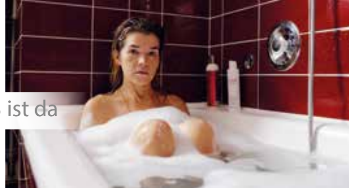
Szene aus „MUTTER“

ungewöhnliche Dokus, eben Streifen, über die man spricht, aufregende und anrührende Filme, historische Stoffe und spannende Stories. Gespielt werden u.a. „Was man von hier aus sehen kann“ nach dem anrührenden Roman von Mariana Leky oder der neue Streifen „The Banshees of Inisherin“ sowie „Hallelujah: Leonard Cohen, A Journey, A Song“ mit nie gezeigtem Archivmaterial des irgendwie unsterblichen kanadischen Musikers Leonard Cohen. Im Vorgriff auf die Ausstellung Pinocchio in Unna, im Mai im Buhrehaus zu sehen, steht auch „Guiller-