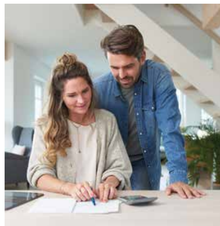
Nachrechnen lohnt sich: Angesichts steigender Bauzinsen sind bei der Anschlussfinanzierung genaue Vergleiche empfehlenswert.

Die Bauzinsen sind spürbar gestiegen. Trotzdem ist der Wunsch nach einer eigenen Immobilie bei vielen Menschen ungebrochen. Eine schnelle Finanzierungszusage gewährleistet Planungssicherheit, gerade wenn es mehrere Interessenten für eine Immobilie gibt.