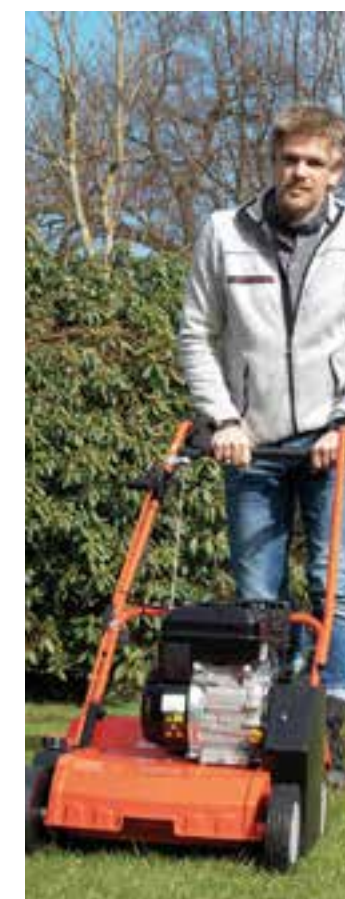
Der Service im Fachhandel macht Gartengeräte fit für das nächste Gartenjahr.

Gartengeräte fachgerecht überprüfen und reinigen