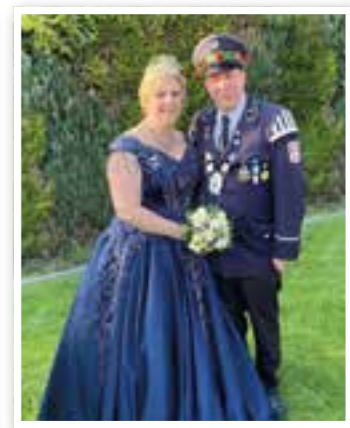
Unna Seite 22 Schützenfest Hemmerde

Impressum Ortszeit Kreis Unna Herausgeber und Verlag: FKW – Fachverlag für Kommunikation und Werbung GmbH Delecker Weg 33 59519 Möhnesee-Wippringsen Telefon: 02924/87 970-0 Telefax: 02924/87 970-29 E-Mail: info@fkwverlag.com