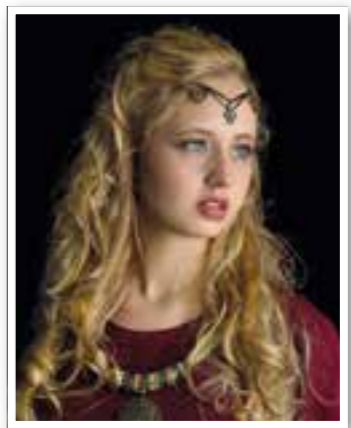
Bergkamen Seite 10 Kulturpicknick