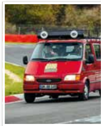
Unna Seite 4 Bang Boom Baltic