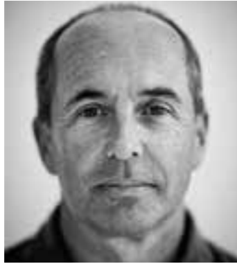
Don Winslow

Wer den amerikanischen Bestsellerautor Don Winslow noch einmal live erleben will, sollte sich schnell Tickets sichern für das „Mord am Hellweg“-Special am Mittwoch, 1. Juni, um 19.30 Uhr im Tanzcenter Kx Kochtokrax. Vielleicht ist es seine letzte Lese-reise in Deutschland, denn der amerikanische Krimiautor Don Winslow will nach 20 Romanen keinen weiteren mehr schreiben.