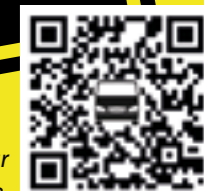
Hier geht es direkt zur Spendenseite.