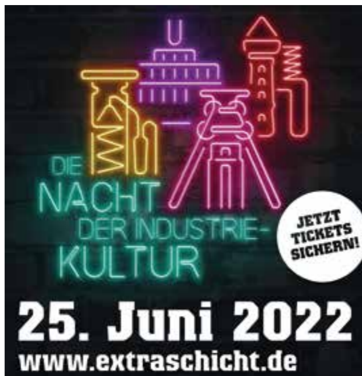
Plakat: Ruhr Tourismus

Nach zwei Jahren Corona-Pause geht die ExtraSchicht 2022 mit einem abgeänderten Konzept an den Start. Neben einer neuen Uhrzeit – 17 bis 1 Uhr – gibt es insbesondere beim Thema Eintritt wichtige Neuerungen: Personalisierte Tickets werden die bekannten Kontrollarmbänder ersetzen und dienen Besucher:innen an den Spielorten zum Ein- bzw. Auschecken. Zu beachten sind zudem die am 25. Juni geltenden Corona-Regeln. Wichtig: Die Tickets sind online über den Webshop unter www.extraschicht.de sowie auf den Internetseiten und vor Ort bei ausgewählten VVK-Stellen erhältlich; einen Ticketver-