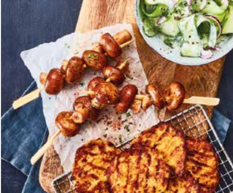
Die küchenfertigen kleinen Reibekuchen ergeben zusammen mit gegrillten marinierten Champignons und einem Gurkensalat ein leckeres Gericht.