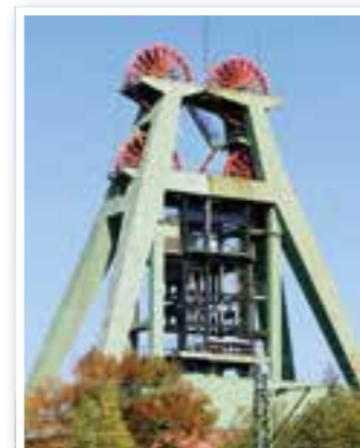
Story des Monats Seite 4 Zoff im Pott