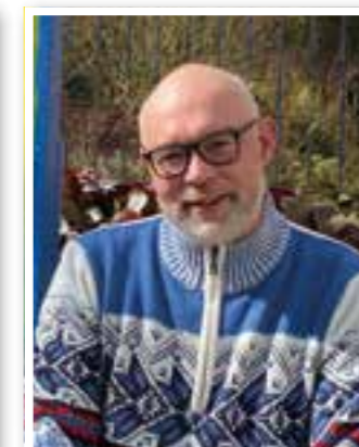
Fröndenberg Seite 10 Neuer Jugendreferent