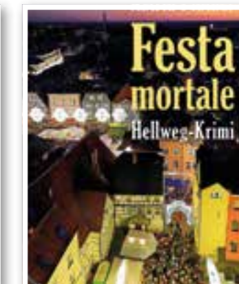
Unna Seite 24 Krimi „Festa mortale“

Impressum Ortszeit Kreis Unna Herausgeber und Verlag: FKW – Fachverlag für Kommunikation und Werbung GmbH Delecker Weg 33 59519 Möhnese- Wippringsen Telefon: 02924/87 970-0 Telefax: 02924/87 970-29 E-Mail: info@fkwverlag.com