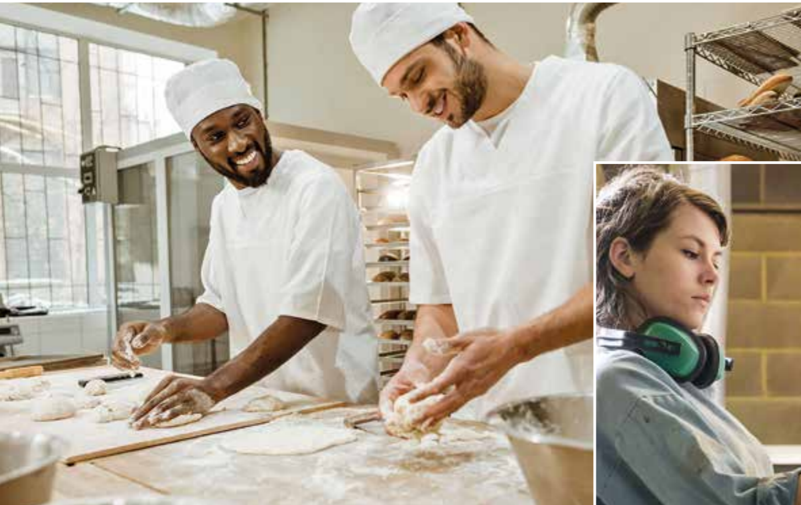
Damit die berufliche Bildung den aktuellen Lebenswelten junger Menschen entspricht, wurde das Berufsbildungsgesetz (BBiG) vor einem Jahr novelliert.

Höhere Mindestausbildungsvergütung, neue Teilzeit- und Freistellungsregelungen