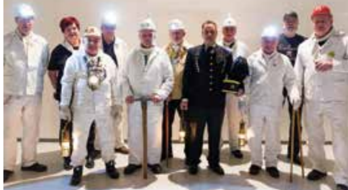
Der Geschichtskreis zeigt sich wütend und entsetzt über die Entscheidung der Politik.

Schon seit gut einem Jahr steht fest, dass Oberaden Abschied vom markanten Förderturm mit den roten Seilscheiben von Haus Aden nehmen muss. Obwohl ehemalige Bergleute für den Erhalt kämpften und es durchaus Optionen für eine Versetzung der Landmarke gegeben hätte, hat die Ruhrkohle AG (RAG) nun mit der Demontage begonnen. Der Todesstoß für das Bauwerk erfolgte im Februar durch die Bergkamen Ratsmitglieder, was für eine Welle der Empörung, aber auch Austritte aus der SPD sorgte.