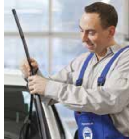
Nach dem Winter sollten die Wischerblätter ggf. getauscht werden.

blätter noch ok? Haben Sie einen Steinschlag entdeckt? Oder Lack-schäden? Dann nichts wie ab zum Fachmann! Hier sollten Sie auch generell einmal die Technik zum Jahreszeitenwechsel checken lassen, Füllstände von Öl, Brems- und Kühlfüssigkeit inklusive. Haben Sie noch Frostschutz in der Scheibenwaschanlage? Dann brauchen Sie diese Mischung noch auf, geben aber beim nächsten Auffüllen lieber ein Sommermittel mit ins