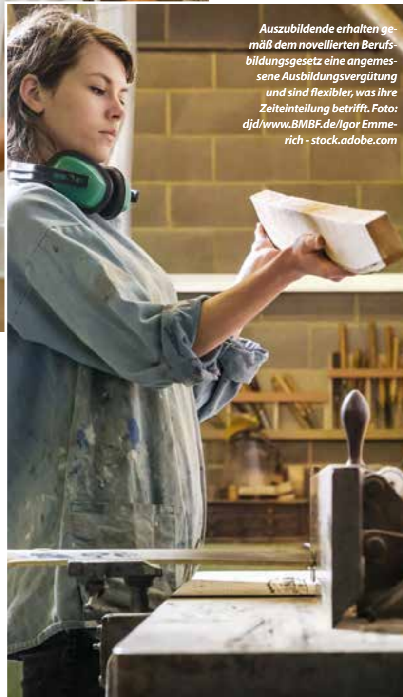
Auszubildende erhalten gemäß dem novellierten Berufsbildungsgesetz eine angemessene Ausbildungsvergütung und sind flexibler, was ihre Zeiteinteilung betrifft.

rückkehren. Auch in Berufsschulwochen mit einem planmäßigen Blockunterricht von mindestens fünf Tagen und 25 Unterrichtsstunden sind erwachsene Auszubildende genau wie Jugendliche davon befreit, nach dem Unterricht zur Arbeit zu gehen. Um sich am Ende der Berufsschulzeit bestmöglich für die schriftliche Abschlussprüfung vorzubereiten, erhalten Auszubildende jeden Alters zusätzlich für den Arbeitstag direkt vor der schriftlichen Abschlussprüfung eine bezahlte Freistellung. Alle Informationen zum neuen Berufsbildungsgesetz sowie spannende Erfolgsbeispiele von Menschen mit beruflicher Bildung finden sich auf www.die-duale.de (djd)