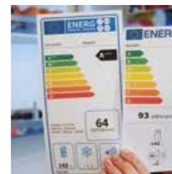
Neues Energielabel.

2021 kommen einige Neuerungen auf uns zu. Neben der neuen CO2-Abgabe, die das Heizen und Tanken teurer macht, hat die EU weitere Verbote bzw. Änderungen erlassen. Wir haben Ihnen das hier einmal zusammengefasst.