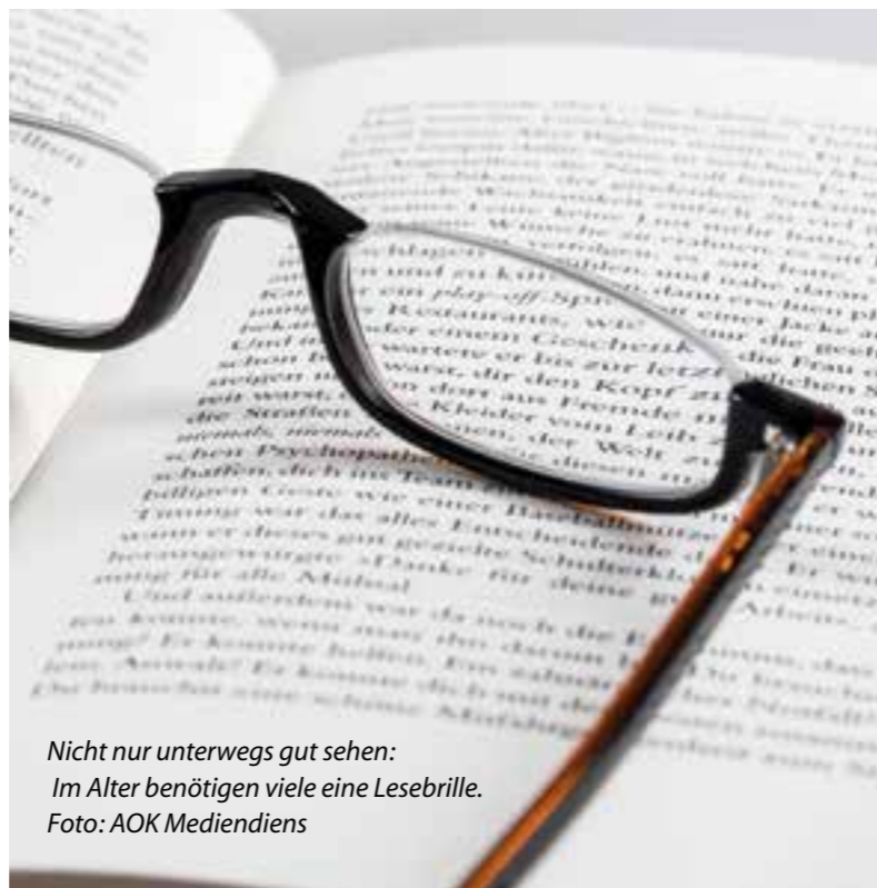
Nicht nur unterwegs gut sehen: Im Alter benötigen viele eine Lesebrille.