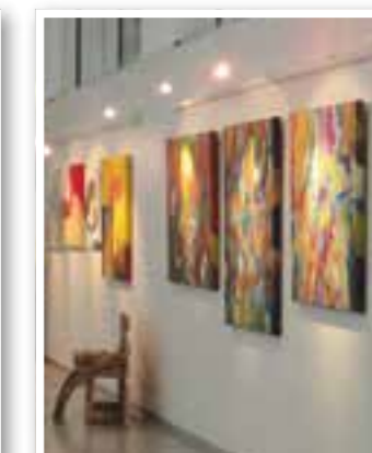
Kamen Seite 32 Zehn Jahre „Der Rote Faden“