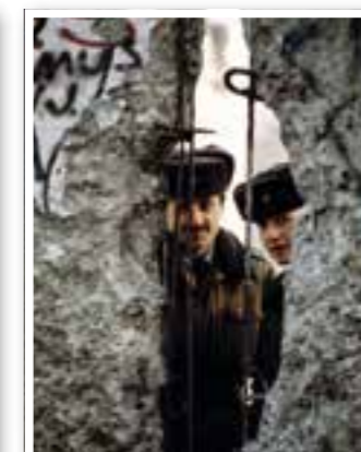
Fröndenberg Seite 16 Mauerfotos als Zeitzeugen