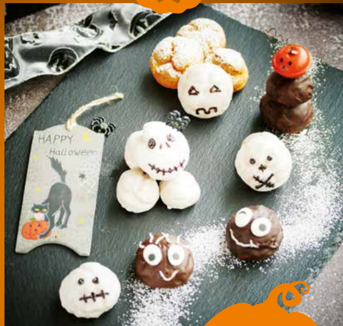
Die schaurig-süßen Geister und Monster Windbeutel sind die perfekten Halloween-Gebäcke für Klein und Groß.

Der Brandteig für die Backwaren aus dem Reismehl „Kuchenglück“ ist frei von Gluten. Dank der Auswahl der japanischen Reissorten und dem