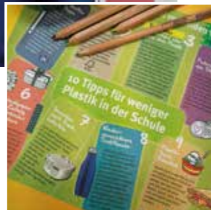
Der Schuljahreskalender mit der informativen Rückseite wurde bereits zum Schuljahresbeginn verteilt, ist aber noch über die Verbraucherzentrale erhältlich.

Bei allen Veranstaltungen ist eine vorherige Anmeldung erforderlich. Sie möchten nun selbst dem Bündnis beitreten oder eine