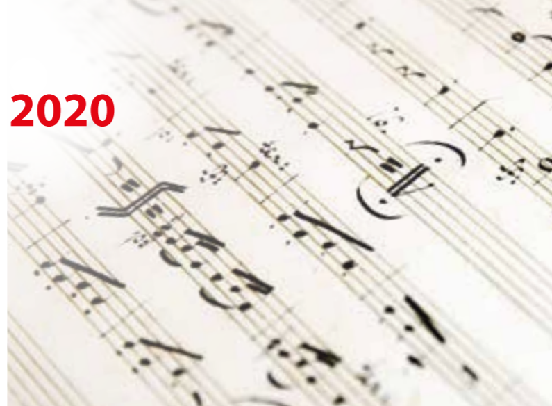
Abschrift einer Partitur Beethovens.

Und so finden zwischen dem 26. September und dem 17. Dezember erneut 40 Konzerte in über 20 Städten der Kulturregion Hellweg statt. Selbstverständlich auch im Kreis Unna. In diesem Jahr steht das Festival unter dem Motto Beethoven – wie könnte es auch anders sein, feiert der Meister doch seinen