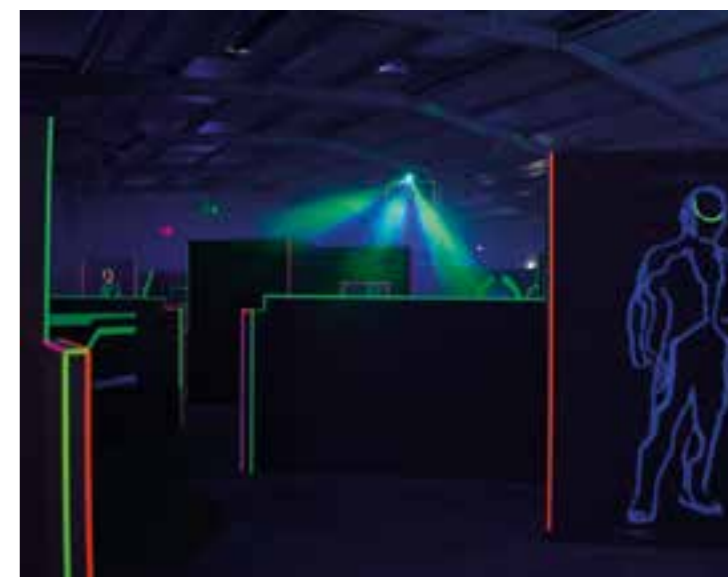
Lasertag spielen ist nur eine der Auswahlmöglichkeiten, die das Team vom JKC zur Auswahl bereit hält.

Ganz wichtig: Das Einverständnis der Eltern muss per Einverständniserklärung mit der Anmeldung eingereicht werden. Vordrucke können unter der Adresse www.jkc-kamen.de heruntergeladen werden. Auf Wunsch können diese auch per Post versandt werden. Außerhalb der Bürozeiten im JKC nimmt Ju-