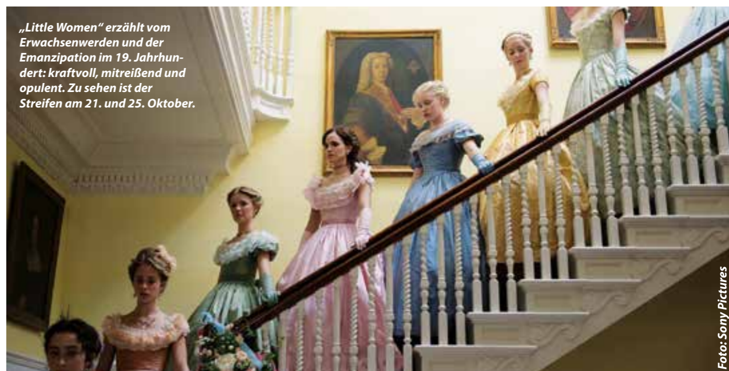
„Little Women“ erzählt vom Erwachsenwerden und der Emanzipation im 19. Jahrhundert: kraftvoll, mitreißend und opulent. Zu sehen ist der Streifen am 21. und 25. Oktober.