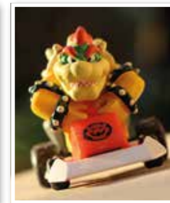
Fröndenberg Seite 14 Kulturelles Leben erwacht