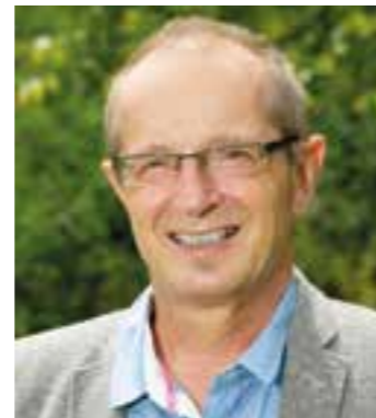
Thomas Grziwotz, Bündnis 90/Die Grünen