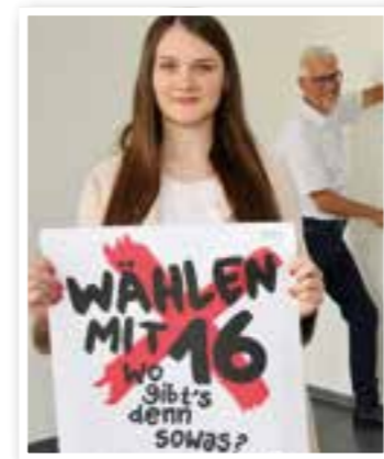
Wahlspezial Seite 4 Kommunalwahl 2020