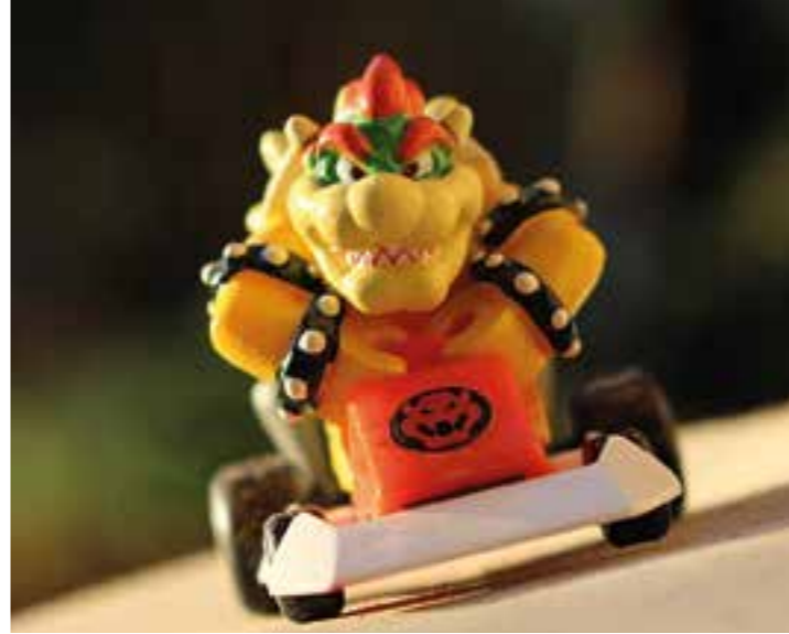
Bei der Nacht der Jugendkultur in Fröndenberg Dellwig können sich Jugendliche unter anderem im Teamwettkampf im „Mario Kart“ messen.

gen Sie, sofern vorhanden, Ihr bereits ausgefülltes Kontaktformular mit. Zeigen Sie dies zusammen mit Ihren Eintrittskarten an der Kasse vor. Wer kein Ticket mehr ergattern konnte, kann die Show auch kostenlos im Livestream un-