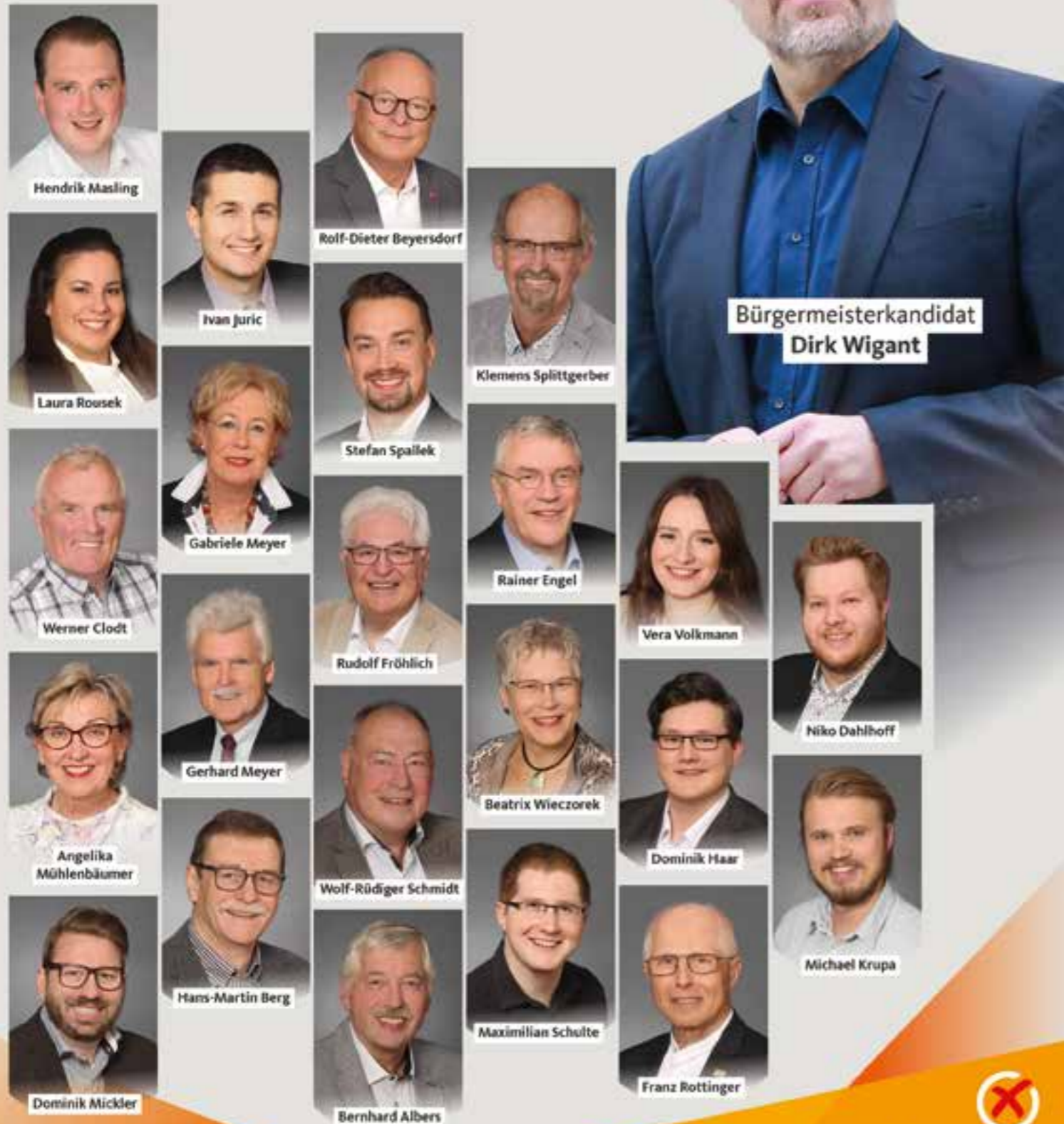
Bürgermeisterkandidat Dirk Wigant