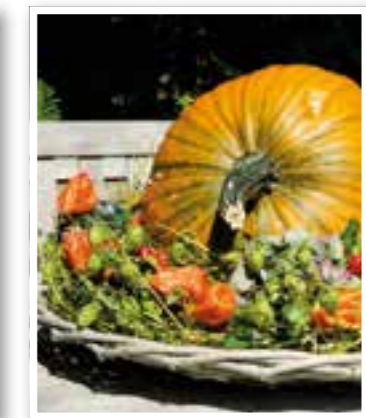
Kamen Seite 39 Saisonstart Kürbis auf Hof Ligges

Impressum Ortszeit Kreis Unna Herausgeber und Verlag: FKW – Fachverlag für Kommunikation und Werbung GmbH Delecker Weg 33 59519 Möhnesee-Wippringsen Telefon: 02924/87 970-0 Telefax: 02924/87 970-29 E-Mail: info@fkwverlag.com