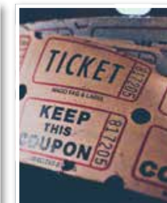
Verbrauchertipp Seite 26 Gutscheinzwang für Tickets