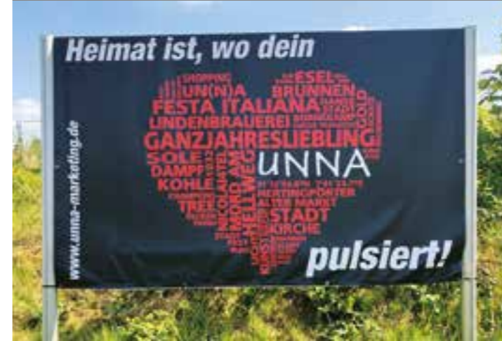
Zur Stärkung des Heimatgefühls hat UnnaMarketing eine Großwerbetafel mit dem Imageherz „Heimat ist, wo dein Unna/Herz pulsiert!“ bestückt.

Langsam kann auch wieder Leben ins Kulturzentrum einziehen. Denn in den Räumen finden nicht nur Konzerte, Partys und Auftritte von Künstlern statt, sondern sie werden auch von zahlreichen Vereinen und Gruppen genutzt – von Tanzkursen und Gitarrenunterricht über Chor- und Theaterproben bis