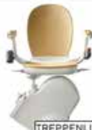
TREPPENLIFTE ab 2.999€