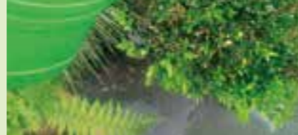
allergische Reaktionen – juckende Hausausschläge bis hin zu Asthmaanfällen – hervorrufen kann. Befallene Bäume sollten deshalb großflächig abgesperrt und ein Kontakt weiträumig vermieden werden.

Sind Eichen im Garten oder in öffentlichen Grünflächen vom Eichenprozessionsspinner befallen, ist große Umsicht angebracht. Denn die winzigen Haare der Raupen enthalten ein Gift, das auf der Haut und an den Schleimhäuten