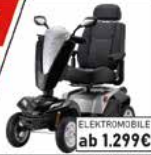
ELEKTROMOBILE ab 1.299€