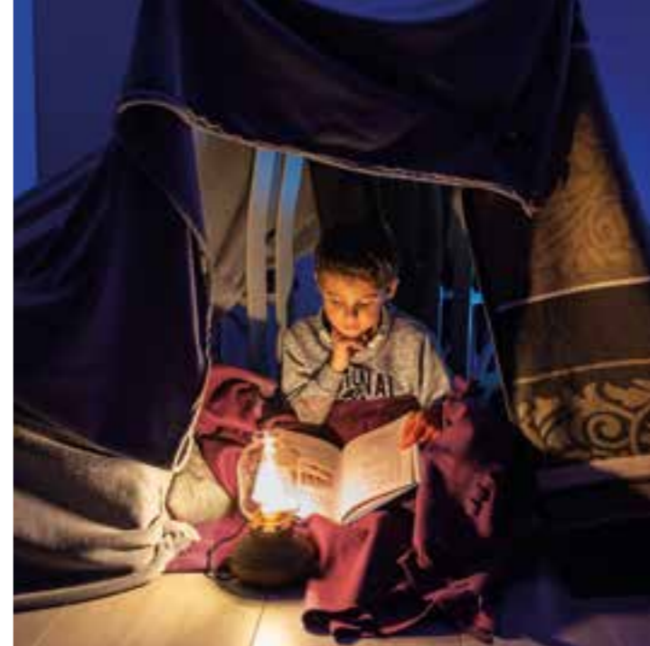
Foto „Heimat“ aus der Ausstellung in der Blind Date in der Galerie sohle 1.