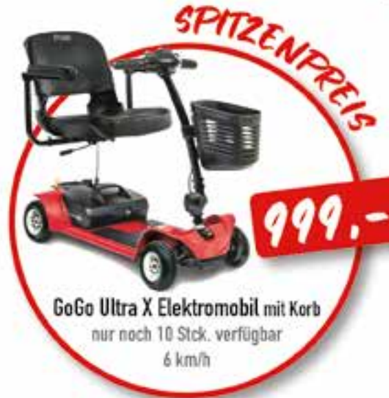
GoGo Ultra X Elektromobil mit Korb nur noch 10 Stck. verfügbar 6 km/h