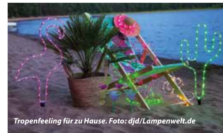
Tropenfeeling für zu Hause.

zur Farbwechselfunktion. Stylistische Dekoleuchten tauchen den Garten in eine gemütliche Lichtatmosphäre und sorgen auch für mehr Sicherheit, wenn es dunkler wird. Und Lichterketten mit bunten Motiven, etwa einem Kaktus, dürfen an einem fröhlichen Abend unter freiem Himmel keinesfalls fehlen. Wohlfühlstimmung pur ist angesagt, wenn alle Blumen blühen und der Sommerwind die Blätter rascheln lässt. Damit die Lieblingspflanzen am Abend mit der Dämmerung nicht verschwinden, können Lichtquellen im Beet platziert werden – fest installiert oder als Erdspeieße. Beliebt sind auch Spots mit smarten Funktionen: So lassen sich die Pflanzen in jeder beliebigen Farbe beleuchten – alles ganz unkompliziert gesteuert über das Smartphone.