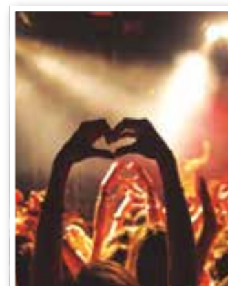
Story des Monats Seite 4 Kulturkiller Corona?

Stellenmarkt Rettungsanker Kurzarbeit 28