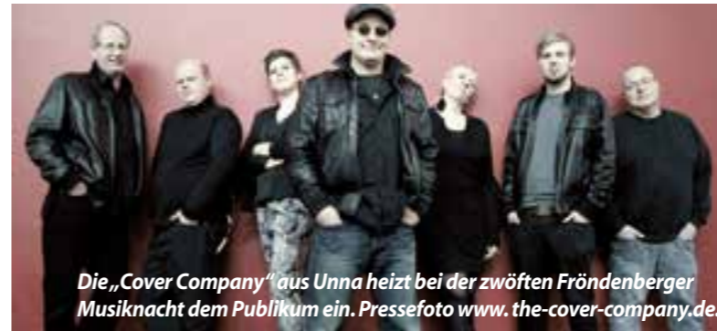
Die „Cover Company“ aus Unna heizt bei der zwölften Frönderberger Musiknacht dem Publikum ein.

12. Fröndenberger Musiknacht am 8. September