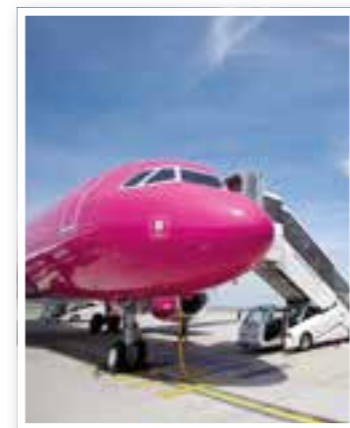
Titel Seite 4 Länger Landen in Dortmund