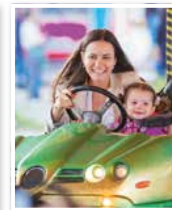
Fröndenberg Seite 26 Auf zur Fliegenkirmes!