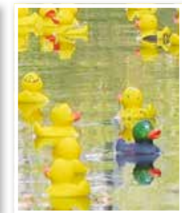
Kamen Seite 32 Feier zum 50. Stadtgeburtstag