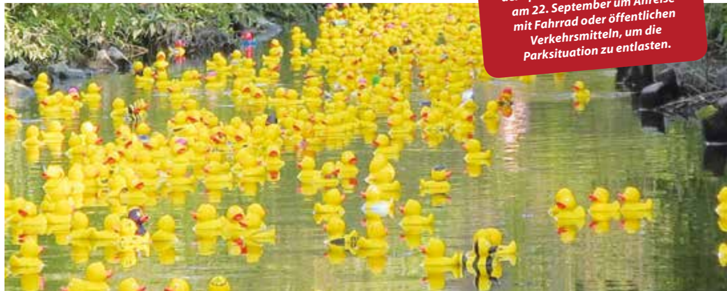
Das traditionelle Entenrennen des Rotary Clubs Kamen darf beim Stadtfestes Kamen am 22. September natürlich nicht fehlen.

HINWEIS: Die Organisatoren bitten aufgrund der Sperrungen in der Innenstadt am 22. September um Anreise mit Fahrrad oder öffentlichen Verkehrsmitteln, um die Parksituation zu entlasten.