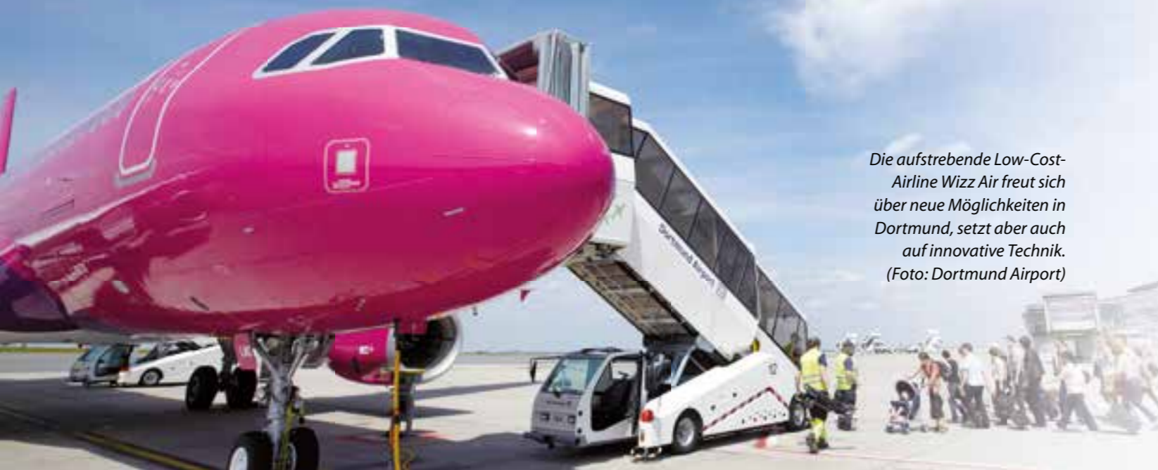
Die aufstrebende Low-Cost-Airline Wizz Air freut sich über neue Möglichkeiten in Dortmund, setzt aber auch auf innovative Technik.

Es war nur eine Frage der Zeit, bis die Bezirksregierung Münster den aktuellsten Antrag auf Verlängerung der Betriebszeiten des Dortmund Airport (DTM) genehmigen würde. Nun ist das Horror-Szenario vieler lärmgeplagter Bürger eingetreten: Zum Glück nicht im vollem Umfang.