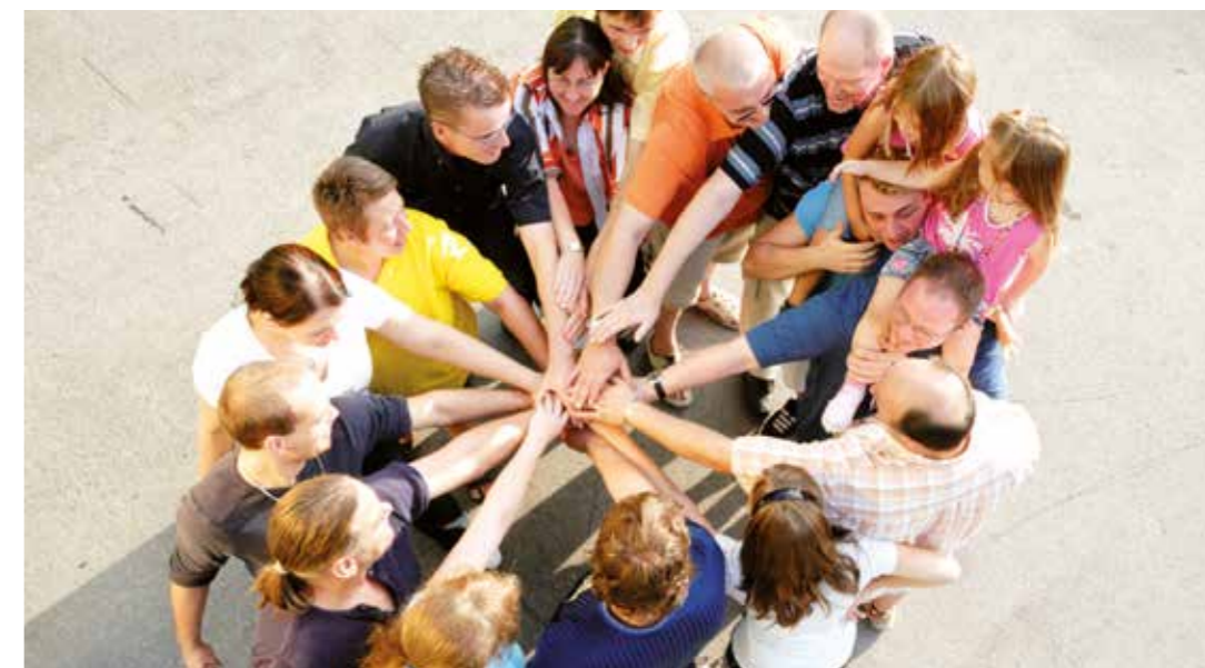
Zum neunten Mal wird zur Unnaer Ehrenamts- und Ideenbörse ins zib eingeladen.

Ehrenamtliches Engagement ist vielfältig und erweitert den eigenen Horizont. Der Kontakt mit neuen Menschen, mit Problemen und mit Lösungsversuchen erhöht fast immer soziale Kompetenz und Kommunikationsfähigkeiten. Wer aktuell auf der Suche nach einer ehrenamtlichen Tätigkeit ist, der ist bei der neunten Ehrenamts- und Ideenbörse in Unna richtig.