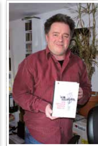
Kultur Seite 34 Autor Raimon Weber