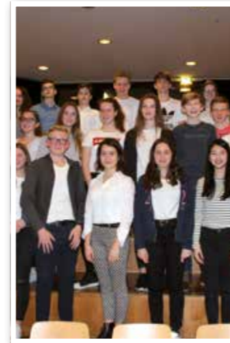
Titel Seite 4 Schülerfirma „Paladies“