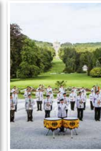
Benefizkonzert Seite 46 Heeresmusikcorps Kassel