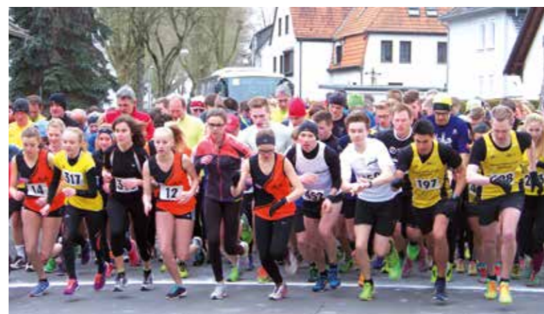
Der Startschuss für die 10km-Strecke fällt um 15.45 Uhr.

Am 10. März ist es wieder so weit: Der VFL Fröndenberg 1953 e.V. lädt zum Ruhrtallauf.