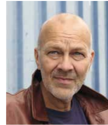
Jens Henrik Jensen

Jens Henrik Jensen mit „OXEN – Der dunkle Mann“