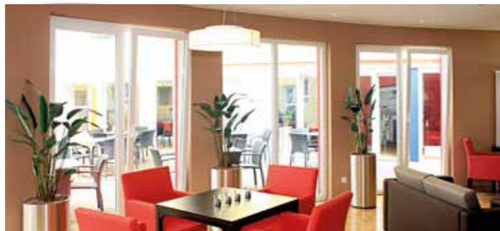
Clubraum zur Terrasse