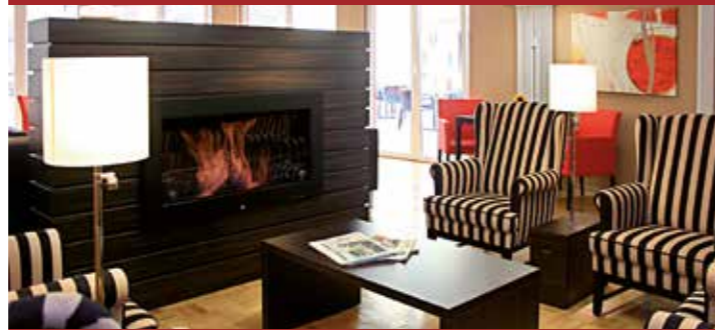
Bibliothek mit Kamin