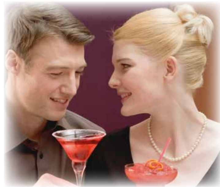
Gemeinsame Zeit ist das größte Glück für Verliebte.

sondern wurde bereits im Jahre 469 von der katholischen Kirche eingeführt und blieb vor allen Dingen im angloamerikanischen Raum über Jahrhunderte lebendig. Auch in Deutschland ist der 14. Februar - als der romantischste aller Gedenktage - wieder eine feste Größe im Kalender. (djd/pt)