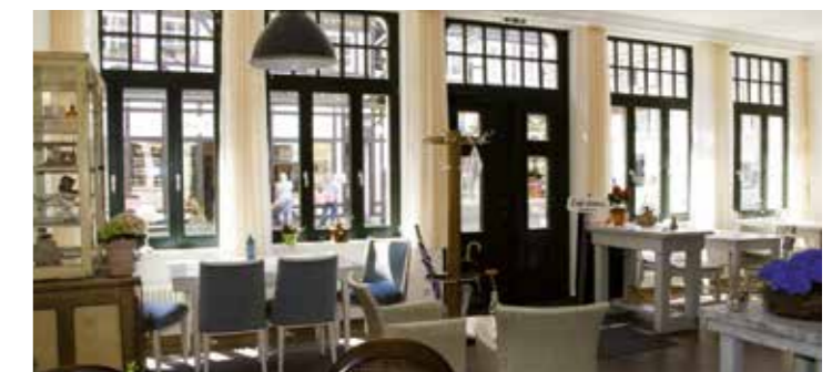
In schönem Ambiente können im Cafe Moller selbst gebackene Köstlichkeiten genossen werden.

Weitere Informationen gibt es im Netz unter www.cafe-moller-unna.de