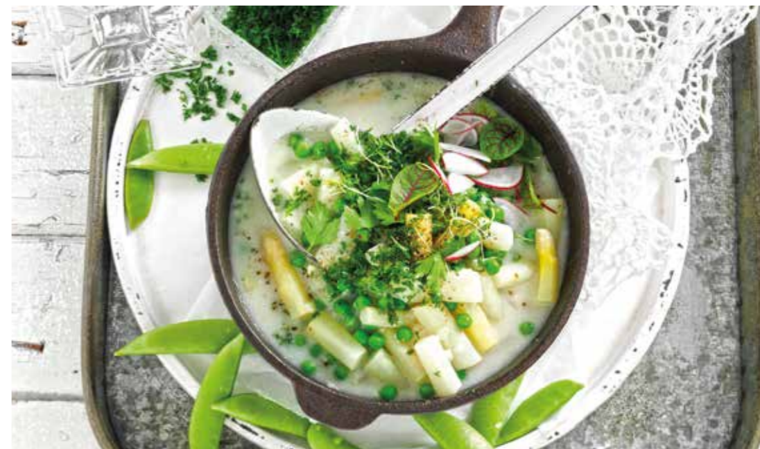
Köstliche und leichte Küche: Das Spargel-Erbsen-Gemüse mit Kräuterbutter passt sehr gut zu Hähnchenbrustfilet oder Alaska-Seelachs.

Industriell hergestellte Tiefkühlkost wird stets schockgefrostet. Dabei wird das Produkt in kürzester Zeit auf bis