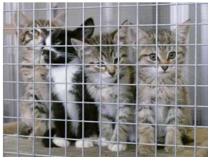
Viele Tiere suchen ein Zuhause. Die Rubrik „Tier sucht Anschluss“ ist im Internet verfügbar.

lefonisch unter 02303/69505. Die Öffnungszeiten sind montags von 10 bis 12 Uhr, dienstags von 13.30 bis 16 Uhr, donnerstags von 13.30 bis 16 Uhr und samstags von 10 bis 12 Uhr.