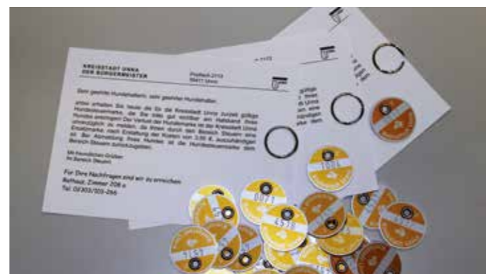
Grundsätzlich ist jeder Hund innerhalb von 14 Tagen nach Aufnahme in den Haushalt anzumelden.

Eine Steuerbefreiung wird zudem für Hunde gewährt, die nach entsprechender Ausbildung hochgradig behinderten Mitbürgern den Alltag erleichtern.