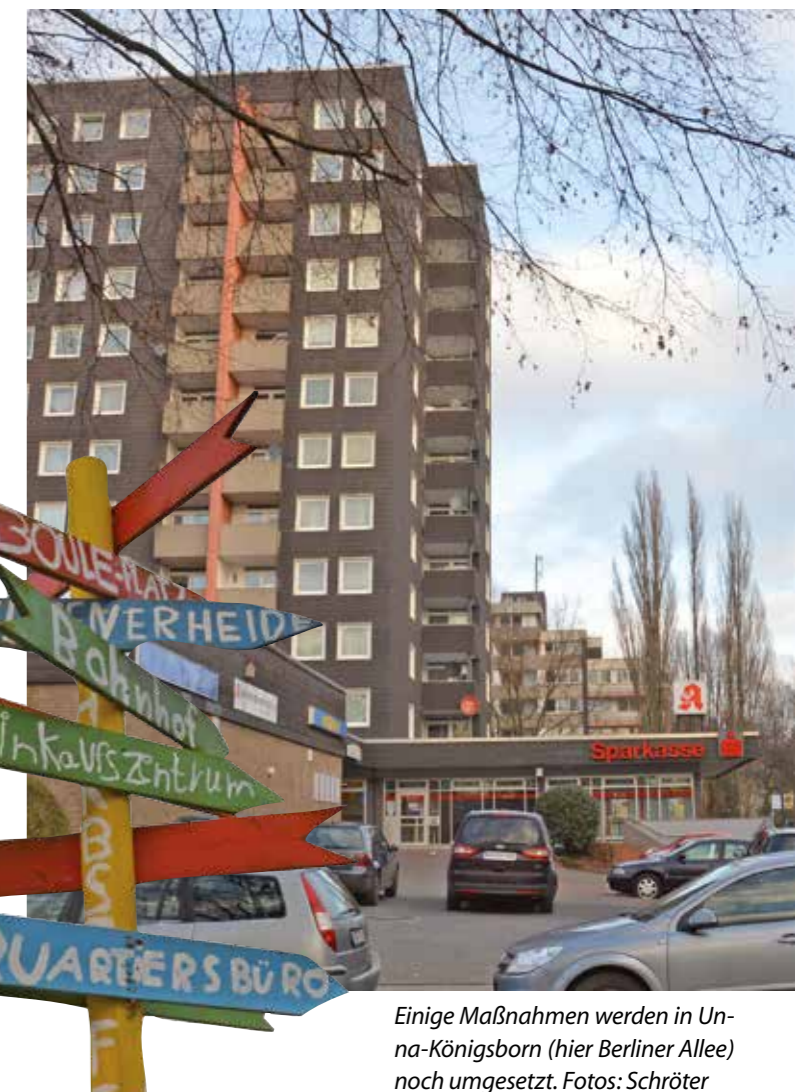
Einige Maßnahmen werden in Unna-Königsborn (hier Berliner Allee) noch umgesetzt.

Die Bewilligung der zinsgünstigen Darlehen erfolgt durch den Kreis Unna, kreditverwaltende Stelle ist dann die NRW Bank. Über diese Wohnraumförderung hinaus gibt es auch im laufenden Jahr eine Vielzahl weiterer Fördermöglichkeiten mit günstigen Darlehensbedingungen und attraktiven Tilgungsnachlässen z. B. für Bestandsinvestitionen, für barrierefreies Bauen, Quartiersentwicklung oder Standortaufbereitung. Investitionen zur Verbesserung der Energieeffizienz oder in den Denkmalschutz. Darüber hinaus gibt es weiterhin ein Sonderprogramm für die Schaffung von Wohnraum für Flüchtlinge und Asylbewerber.