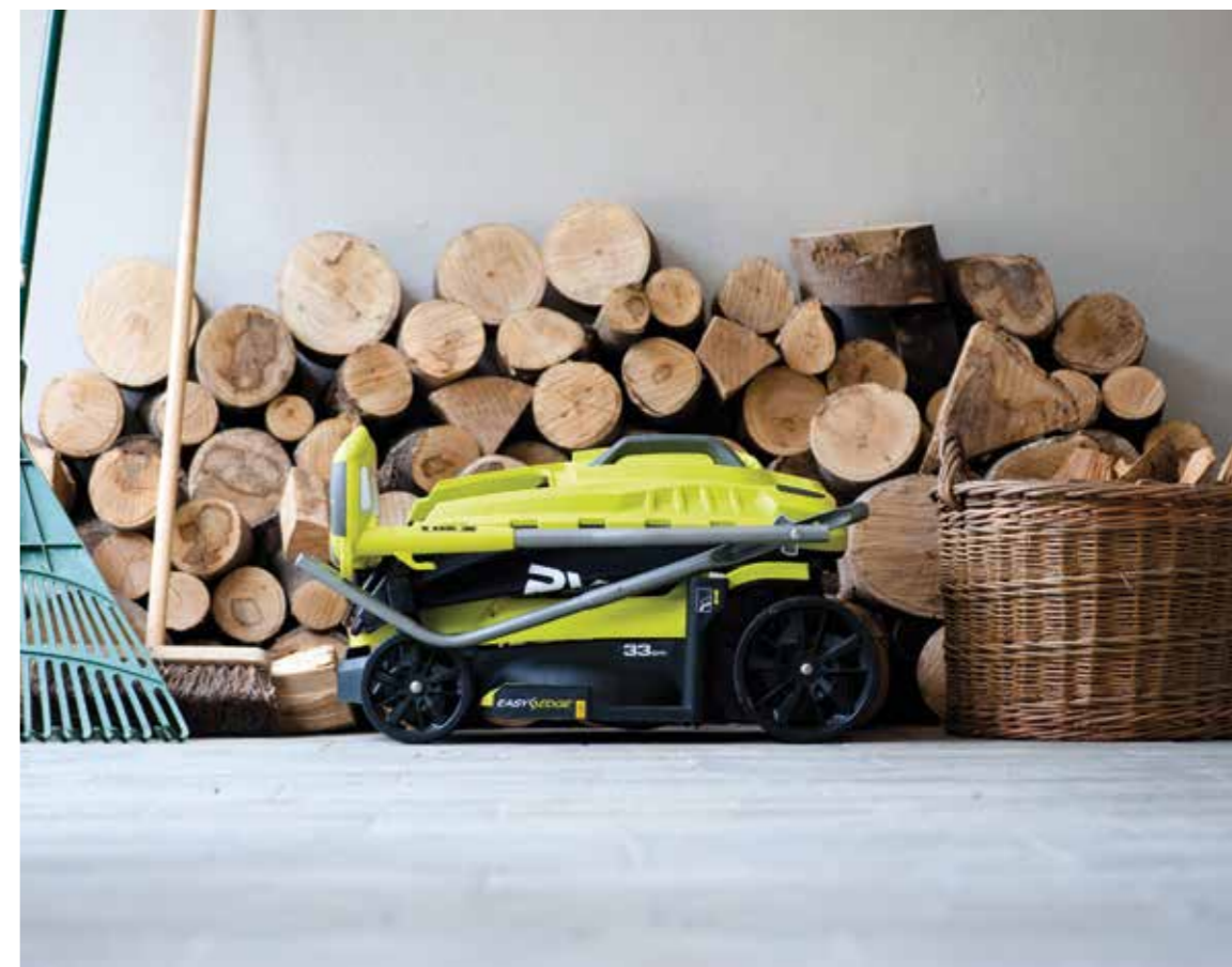
Ein moderner, kompakter Rasenmäher lässt sich zusammenklappen und platzsparend bis zum nächsten Einsatz lagern. Nun ist die Zeit für die Inspektion und die Vorbereitung der kommenden Gartensaison.

Wie jedes andere Gerät bedürfen auch Rasenmäher regelmäßiger Pflege und Wartung. Für diese Pflege sind insbesondere die kalten Monate geeignet. Dann haben Gärtner ausreichend Zeit, um dem guten Stück eine Generalüberholung zu verpassen. Grundsätzlich gilt für alle Gartengeräte: Reinigen, schärfen und fetten. Schnittwerkzeuge schleifen und desinfizieren. Rasenmäher zur Inspektion bringen und Messer schleifen lassen.