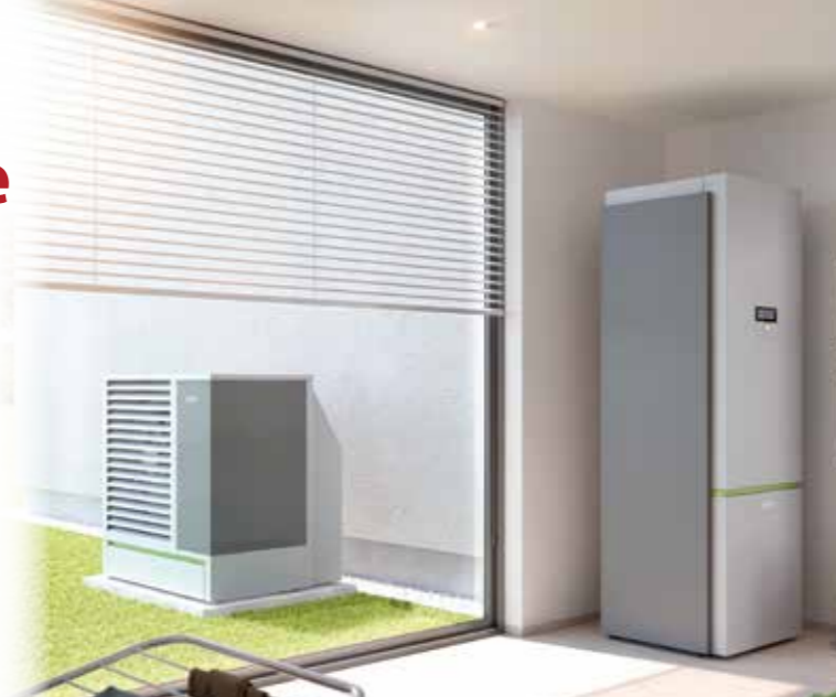
Wärmesysteme mit Wärmepumpen eignen sich zum Heizen, Kühlen, Lüften und zur Aufbereitung von Trinkwasser – ganz unabhängig von fossilen Brennstoffen.

Das optimale Wärmesystem Die Energie- und Kosteneinsparung ist am größten, wenn alle Komponenten innerhalb des Wärmesystems abgestimmt sind. Dazu gehören neben der Wärmepumpe: ein Wärmespeicher, Heizkörper bzw. Flächenheizungen, meistens auch eine Wohnraumlüftung und vor allem eine effiziente Regelung. „Ganzheitliche Lösungen funktionieren effizient und reibungslos, weil alle Elemente perfekt zusammenarbeiten. Die aufeinander zugeschnittenen Komponenten ermöglichen eine schnelle, kostengünstige Installation und eine sichere, komfortable Nutzung im Alltag“, erklärt Entwickler Dominik Lampert.