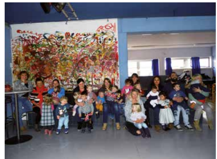
Regelmäßig treffen sich die Tageseltern zum Austausch.

Kindertagespflege des Kreises Unna melden. Die Ansprechpartnerin Ingeborg Icke ist telefonisch unter 02303/271458 oder per E-Mail an ingeborg.icke@kreis-unna.de erreichbar und steht zu Beratungsgesprächen zur Verfügung.