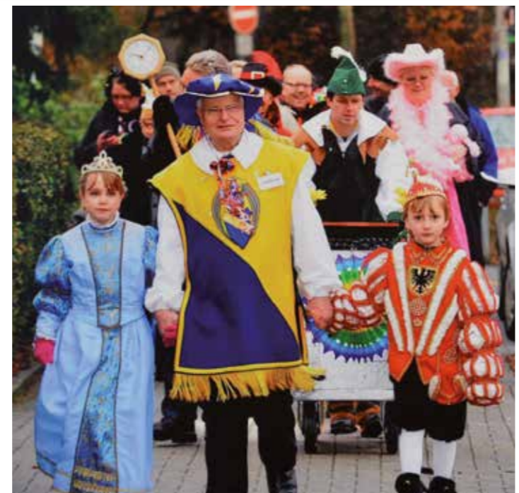
Heute hat er eine Schar von 800 Kindern hinter sich bei den Umzügen an Weiberfastnacht.

Nach dem großen Fest an Weiberfastnacht ist aber noch nicht Schluss. Am darauffolgenden Freitag findet der Umzug für Kinder zum ersten Mal in Schwerte statt. Los geht es