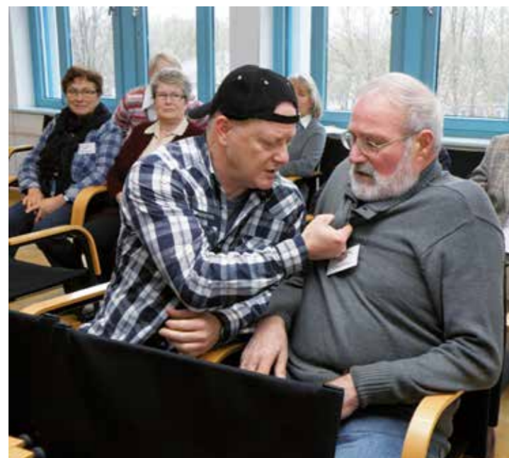
Bei dem Seminar im Rahmen des Projektes „Senioren helfen Senioren“ werden die Teilnehmer durch Rollenspiele auf ihre Arbeit vorbereitet.

Informationen über den Verein für Kriminalprävention, Jugendschutz und Verkehrssicherheitsarbeit im Kreis Unna gibt es außerdem im Netz unter www.prosi-unna.de .