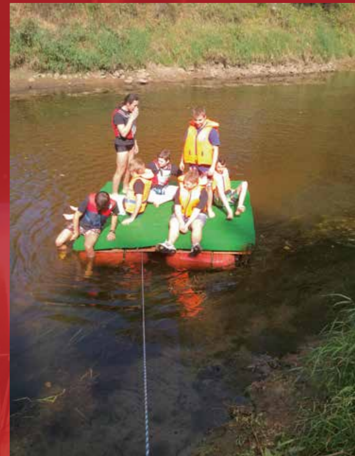
Mit einem selbstgebauten Floß auf der Ems unterwegs. Es beförderte seine Pfadfinderfracht zuverlässig bis ins Ziel.

2010 war der Horst beim „Eurocamp“ in Deutschland, ein internationales Großlager des Weltverbandes, das alle vier Jahre in Europa stattfindet. Dort waren 1.200 Pfadfinder aus zwölf Nationen. „Unser Sommerlager 2014 wird allen in Erinnerung bleiben, da wir dort nach einigen Jahren mal wieder ins Ausland gefahren sind. Wir waren in Tschechien und es war eine wunderbare Gegend zum Wandern. Weiterhin sind wir mit einer anderen Kultur in Kontakt gekommen und haben sogar einen Ausflug nach Prag gemacht“, beschreibt der Stammesführer diese besondere Erfahrung.