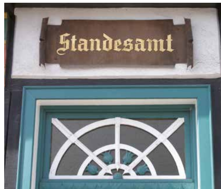
Viele Ehen sind hier geschlossen worden. Zu 132 Goldenen Hochzeiten wurde im vergangenen Jahren in der Kreisstadt gratuliert.

Zusammengerechnet überbrachten der Bürgermeister, seine Stellvertreter sowie die Ortsvorsteher und Ratsmitglieder im vergangenen Jahr 1.290 mal die Glückwünsche der Kreisstadt Unna zu Alters- und Ehejubiläen.