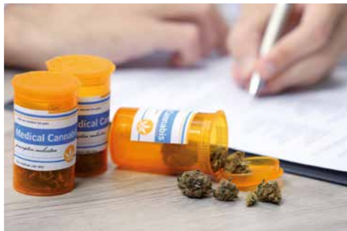
Damit die Qualität des "Cannabis auf Rezept" gleich bleibt, soll der Anbau von Cannabis-Pflanzen zu medizinischen Zwecken in Deutschland ermöglicht werden.

Arzneimittel auf Basis von Cannabis können zum Beispiel sinn-