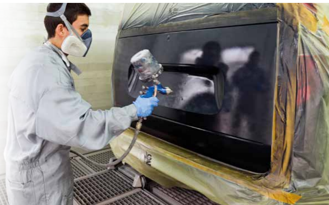
Autolack ist eine sensible Angelegenheit: Lack muss auch im Winter gepflegt werden.

Der Lack, die „Haut“ unserer Autos, soll das Blech bei Wind und Wetter vor Umwelteinflüssen und Korrosion schützen. Momentan genügen schon kurze Fahrten über feucht-schmutzige und gestreute Straßen, damit die Karosserie blickdicht unter einer dichten Salz- und Schmutzschicht verschwindet. Das sieht unschön aus und kann auch dem Lack schaden. Daher gilt: Die Kruste muss runter!