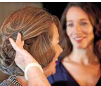
Wer Symptome wie eine erhöhte Blendempfindlichkeit oder ein nachlassendes Kontrastsehen bemerkt, sollte einen Augenarzt aufsuchen.

Bei stärkerem Hörverlust stoßen selbst leistungsfähigste Hörgeräte oft an Grenzen. Hier können sogenannte Cochlea-Implantate (CI) die Lösung sein: Sie simulieren die Funktionen des natürlichen Hörvorgangs im Innenohr elektrisch. Man kann andere Menschen wieder entspannt verstehen und zuverlässig kommunizieren. Das Implantat reicht bis in die Hörschnecke und stimuliert den Hörnerv. Vor jeder CI-Versorgung erfolgt eine umfassende Untersuchung und Beratung in einer spezialisierten Klinik. Ist die Behandlung medizinisch angebracht, übernimmt die Krankenkasse in der Regel die vollen Kosten.