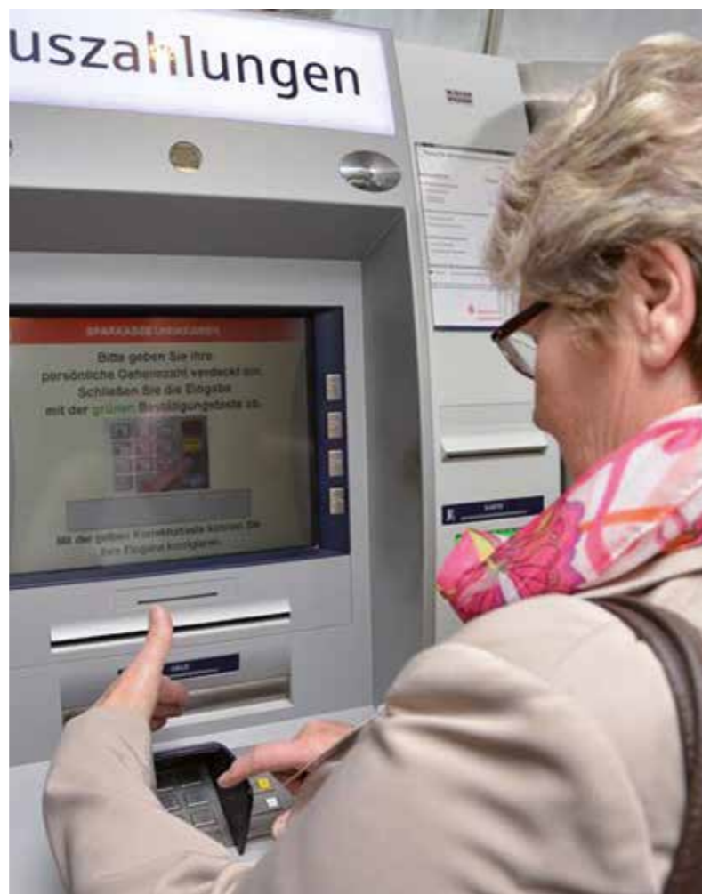
Durch die Schulung soll der Selbstschutz verbessert werden.

Die Teilnehmer werden intensiv, unter anderem auch in Rollenspielen, auf ihre spätere, ehrenamtliche Tätigkeit vorbereitet. Es werden folgende Themen vermittelt: Umgang mit Ängsten, Erläuterung des Täter- und Opferverhaltens – wie verhalte ich mich: beim Ratenkauf und welche Rechte habe ich? Wie verhalte ich