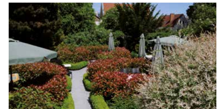
Im Sommer lädt der eigene Garten des Cafe Moller zum Verweilen ein.