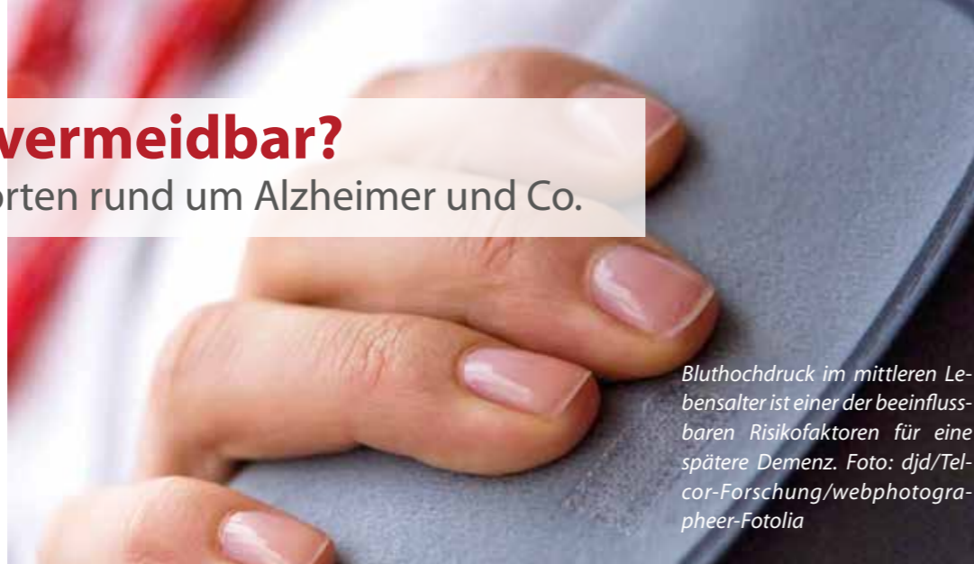
Bluthochdruck im mittleren Lebensalter ist einer der beeinflussbaren Risikofaktoren für eine spätere Demenz.

Welche Risikofaktoren beeinflussen die Entstehung einer Demenz? Aktuellen Studien zufolge lässt sich etwa jede dritte Alzheimer-Erkrankung auf diese Risikofaktoren zurückführen: Bluthochdruck