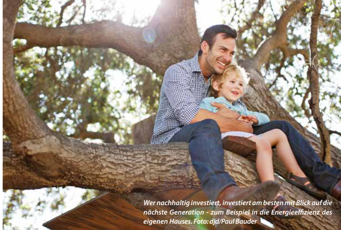
Wer nachhaltig investiert, investiert am besten mit Blick auf die nächste Generation - zum Beispiel in die Energieeffizienz des eigenen Hauses.

Wichtig bei der Planung der Dämmung ist auch, auf Materialien zu achten, die nachhaltig sind. Dazu gehören neben der Dämmleistung auch ihre Nutzungszeit und Faktoren wie Schadstoffarmut. Wer ein Haus baut, kann danach einiges erzählen. Noch spannender ist es allerdings meist, wenn eine Immobilie grundlegend saniert werden muss. Denn Altbauten bestechen zwar durch ihren besonderen Charme, die erfolgreiche und finanziell tragbare Modernisierung wird aber auch rasch zur Herausforderung. Je älter das Gebäude, desto mehr ist zu tun, gerade im Hinblick auf die gewünschte Energieeffizienz.