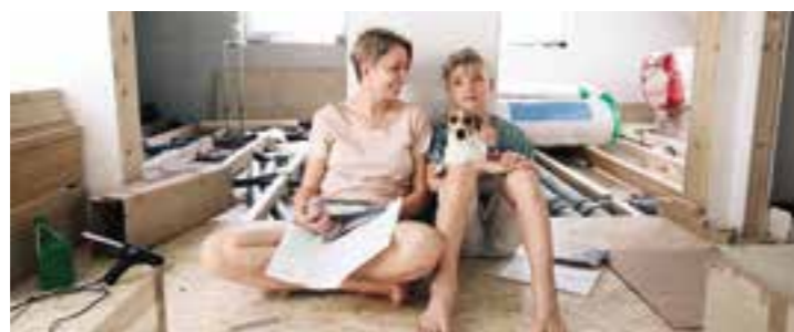
Gute Zeiten für Modernisierer: Für viele energetische Maßnahmen gibt es üppige staatliche Zuschüsse – und Handwerker sind auch wieder etwas leichter zu bekommen.

Immer mehr Wohneigentümer in Deutschland wollen oder müssen sich mit Maßnahmen zur Steigerung der Energieeffizienz befassen. Diese reichen von der Komplettanierung zum Effizienzhaus bis hin zu einzelnen Sanierungsschritten.