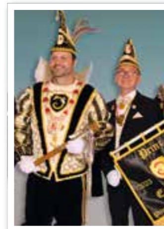
Ahlen Seite 5 Stadtprinz Ahlen