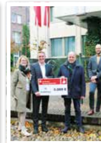
Beckum Seite 7 „50 Stadtdinge“