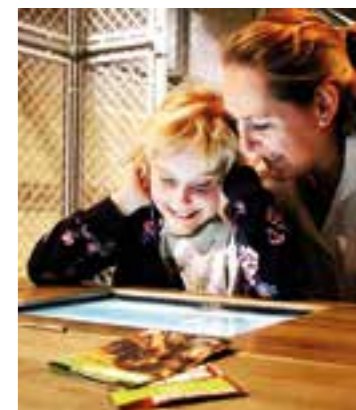
Dank interaktiver Elemente wird Wissen im Auswandererhaus nicht nur passiv konsumiert, sondern selbstbestimmt erlebt.