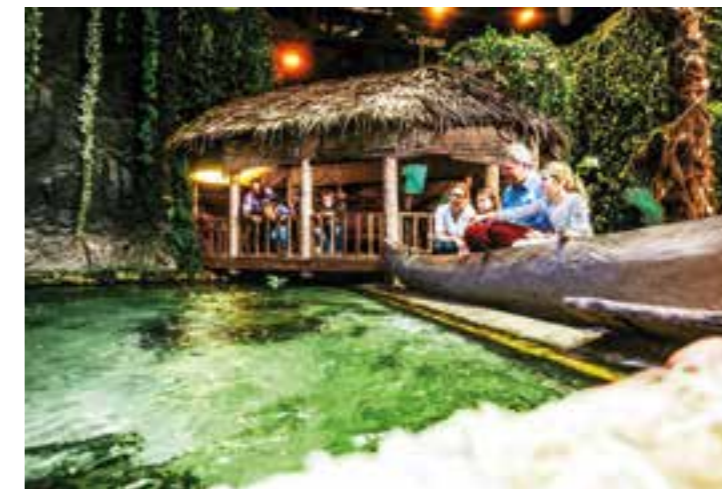
Einmal Südsee und zurück an einem Nachmittag: im Klimahaus Bremerhaven kein Problem.

Ist der Urlaub eingetragten, schauen Sie sich schon jetzt nach einem Urlaubsziel um. Denn egal, ob kurze Städtetrips, eine Musical- oder Freizeitpark-Reise oder den Strandurlaub im Süden: Sowohl die Online-Anbieter als auch die hei-