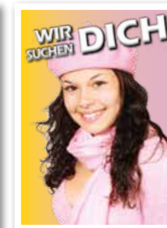
Ausbildung Seite 20 Azubi-Special