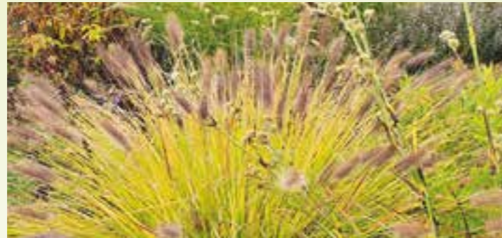
Der Herbst im Beet. Auch das Lampenputzergras ist ein Teamplayer.

Die Bäume werden bald bunt und zeigen zum großen Finale noch einmal alles, was ihr Farbkasten hergeben kann. Die Gehölze, aber auch Kletterpflanzen und Stauden leuchten gelb, orange und kupferrot mit großer Wirkung. Hecken und Mauern, die mit wildem Wein überwuchert sind, zeigen faszinierende Rottöne. Zu ebener Erde sind die Sonnenhüte, Asten und Fette Hennen die letzten, die sogar jetzt noch Blüten zeigen.