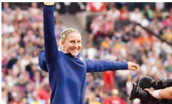
Die Olympia-Dritte Holly Bradshaw aus Großbritannien reist mit einer Bestmarke von 4,90 Metern als eine der Favoritinnen nach Beckum zum Stabhochsprung-Meeting an.

Sie hat den weitesten Weg nach Beckum, um im heimischen Jahnstadion das Feld der Athletinnen anzuführen. Mit Eliza McCartney reist die derzeitige Nummer 2 der Welt aus Neuseeland zum 23. Beckumer Volksbank-Stabhochsprung-Meeting an. Sagenhafte 4,94 Meter auf ihrem Rekordkonto hat diese Frau, die bei Olympia in Rio de Janeiro Bronze gewann.