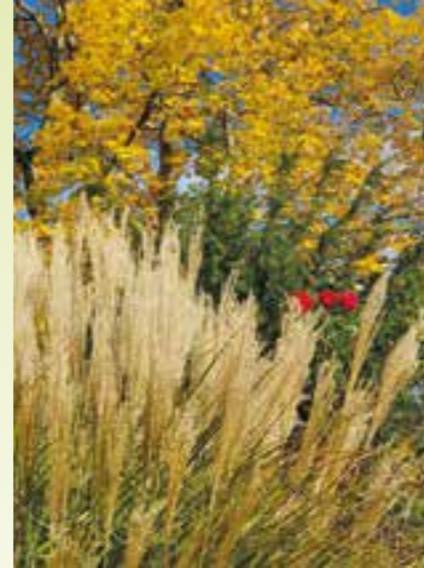
Das aufrechte Schilfgras (Miscanthus) versilbert den goldenen Herbst.

Unbewachsene Flächen gibt es in der Natur nicht – selbst auf kargen Hanglagen oder im Schatten von Bäumen entwickelt sich eine standortangepasste Pflanzengesellschaft. Wer beim nächsten Spaziergang darauf achtet, welche Pflanzen sich am Wegesrand, am Waldsaum, in vollsonnigen oder lichtarmen Standorten finden, wird