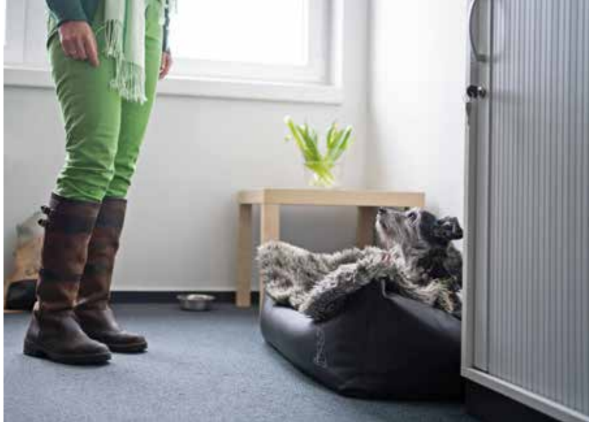
Kollege auf vier Pfoten: Hunde im Büro werden von vielen Unternehmen akzeptiert. Wichtig sind jedoch klare Regeln.

Für das gute Miteinander sollte besonders auf Menschen Rücksicht genommen werden, die