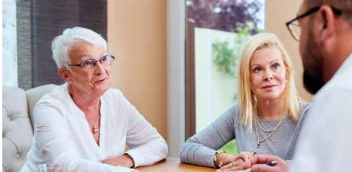
Als Pflegeberater oder -beraterin kann man Menschen in einer schwierigen Situation ganz direkt unterstützen.