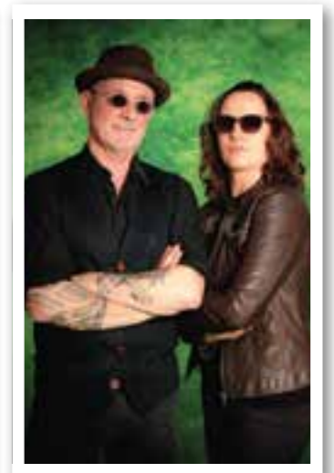
Kultur Seite 19 „Tralla-City“ Ahlen

Impressum Ortszeit Ahlen/Beckum Herausgeber und Verlag: FKW – Fachverlag für Kommunikation und Werbung GmbH Geschäftsführung: Rüdiger Deparade Delecker Weg 33 59519 Möhnesee-Wippringsen www.fkwverlag.com info@fkwverlag.com