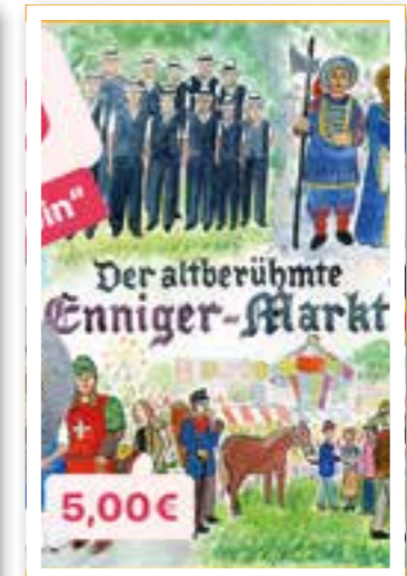
Enniger Seite 17 Enniger-Markt