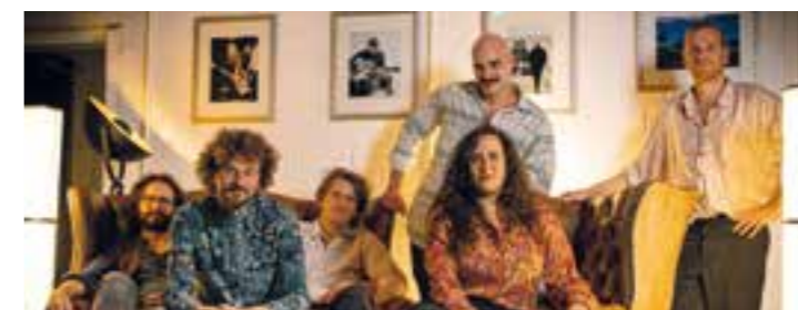
Maliki World Orchestra.

Die Open-Air-Saison ist eröffnet und der Schuhfabrik Kultursommer lädt wieder dazu ein, die schönste Jahreszeit in Ahlen entspannt draußen zu genießen. Geboten wird am Bürgerzentrum erstklassige Live-Kultur mit vielfältigen musikalischen Highlights. Insgesamt locken diesmal sieben Termine zum genussvollen Stelldichein. Im Juli gibt's folgende Veranstaltungen: