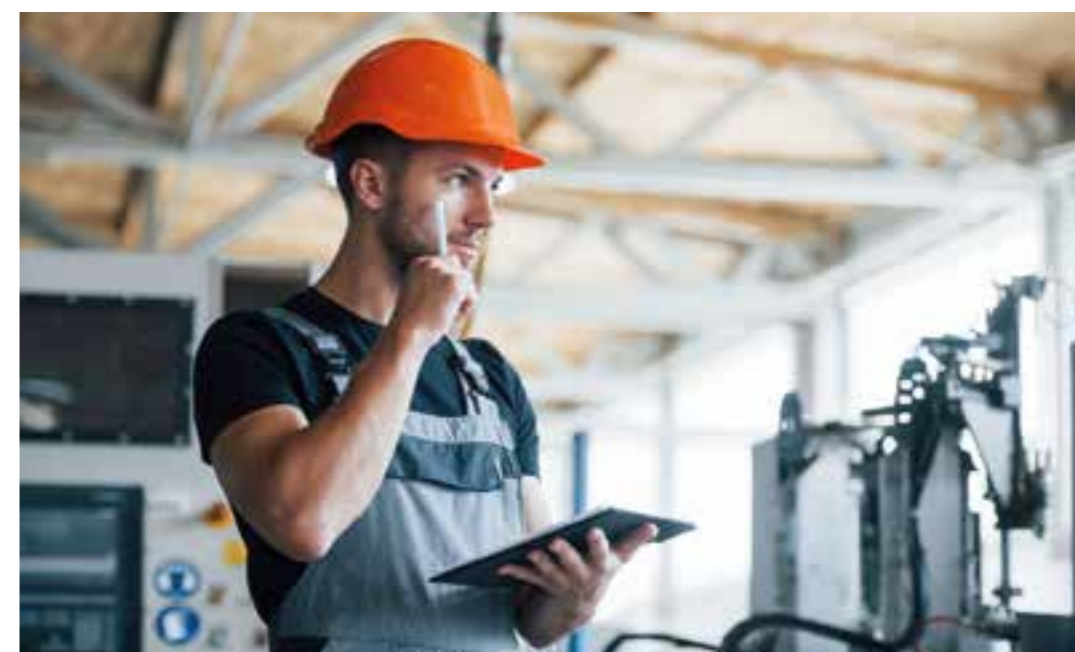
Mit der modernisierten Standardberufsbildposition „Digitalisierte Arbeitswelt“ wird sichergestellt, dass Auszubildende berufsübergreifend Kompetenzen erwerben.

Duale Ausbildungsberufe befähigen für Digitalisierung und Nachhaltigkeit