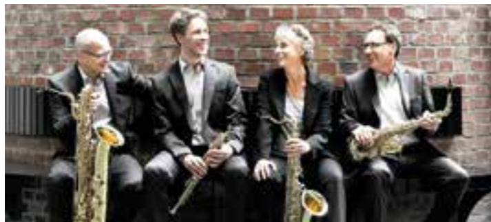
Pindakaas Saxophon Quartett

Das Museum für Westfälische Literatur, Kulturgut Haus Nottbeck in Oelde Stromberg, macht bringt seinen Besucherinnen und Besuchern nicht nur über seine Ausstellungen Literatur näher, sondern bietet auch Veranstaltungen für Groß und Klein. Im Mai können Sie sich auf folgende Veranstaltungen freuen: