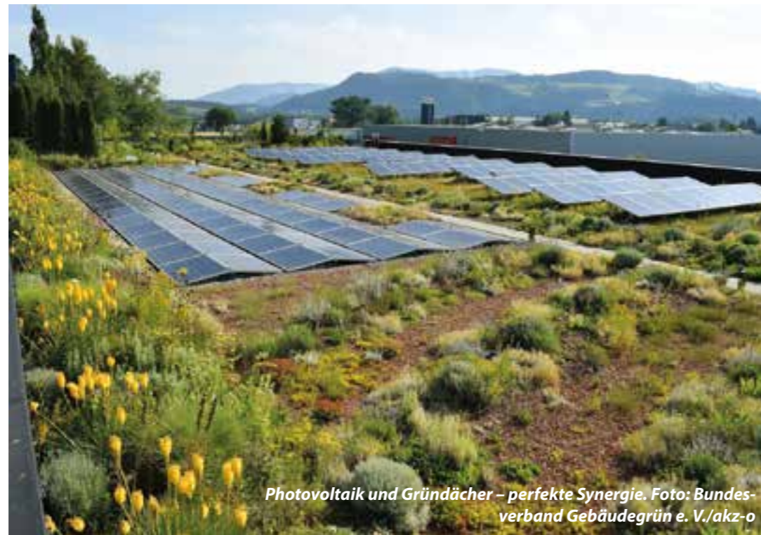
Photovoltaik und Gründächer – perfekte Synergie.

Holz und Holzfasern, die hervorragende Dämmeigenschaften haben und u. a. bei Wand- und Fassadensystemen zum Einsatz kommen, können später somit problemlos weiterverwen-