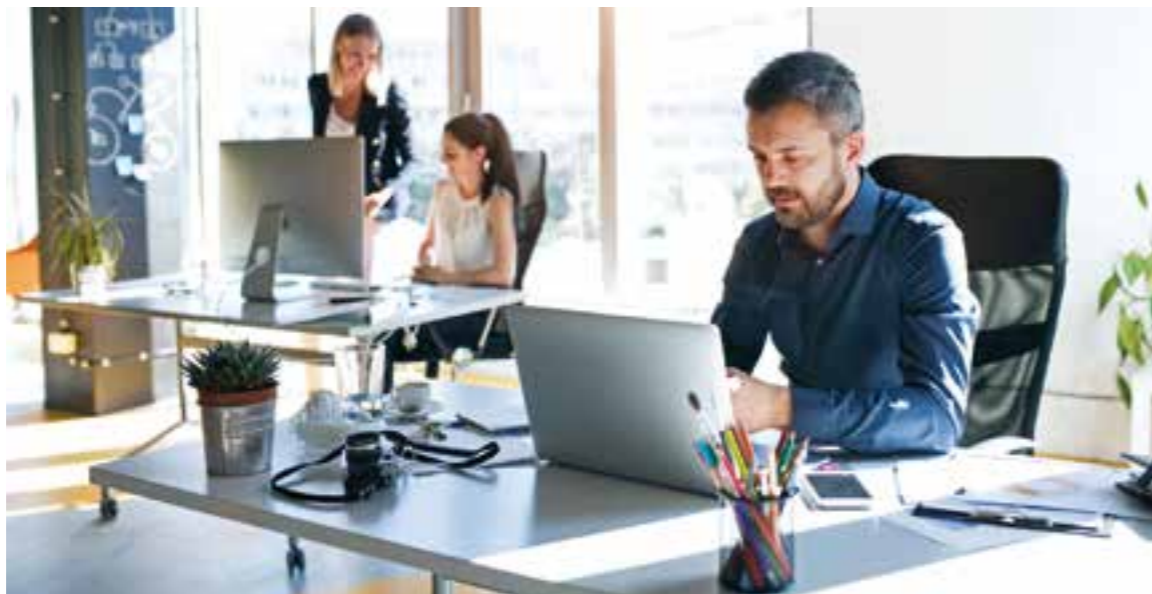
Immer mehr Firmen setzen im Wettbewerb um Fachkräfte auf das Angebot einer vom Arbeitgeber finanzierten betrieblichen Krankenversicherung (bKV).

Der Arbeitskräftemangel macht Unternehmen in Deutschland zu schaffen: Viele Betriebe müssen ihre Geschäfte einschränken, weil qualifizierte Mitarbeitende fehlen. Das Problem wird sich noch verstärken, da die zahlenmäßig starke Babyboomer-Generation nun nach und nach in den Ruhestand geht. Wie aber können Unternehmen gut ausgebildete und motivierte Kräfte gewinnen und diese auch langfristig halten?