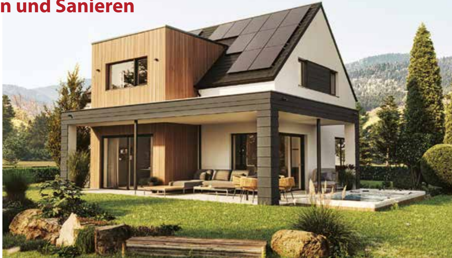
Dieses Plus-Energiehaus aus Holz gehört zu den 36 Finalisten im Wettbewerb um den Deutschen Nachhaltigkeitspreis Unternehmen 2023.

Außerdem steht inzwischen ein neuer biobasierter Dämmstoff zur Verfügung, der aus rund 60 Prozent Biomasse besteht und als Aufsparrendämmung zugleich die höchste Dämmeffizienz aller derzeit auf dem Markt befindlichen biobasierten Dämm-