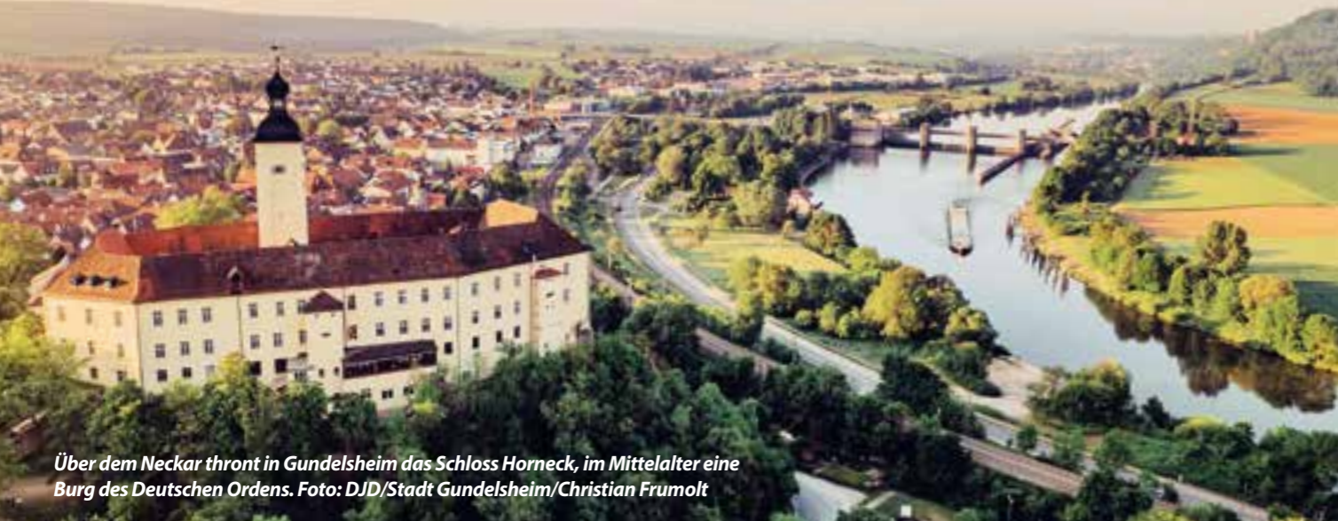
Über dem Neckar thront in Gundelsheim das Schloss Horneck, im Mittelalter eine Burg des Deutschen Ordens.

Die schönsten Touren an Kocher, Jagst und Neckar