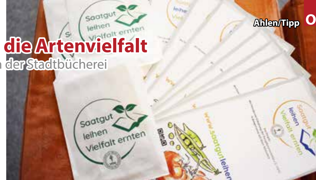
Die Stadtbücherei Ahlen unterhält ab sofort auch eine Saatgutbibliothek.

Das Prinzip ist ganz einfach. In der Stadtbücherei leiht man das Saatgut von Tomaten, Bohnen, Gartenmelde und Salat kostenlos aus. Zu Hause pflanzen die Gärtnerinnen und Gärtner das Saatgut im Garten oder auf dem Balkon an. Ist das Gemüse reif, wird ein Teil des geernteten Saatgutes beiseitegelegt und getrocknet. Anschließend bringt man das so gewonnene Saatgut wieder in die Stadtbücherei zurück. „So entsteht ein Kreislauf, in dem auch andere von dem Saatgut