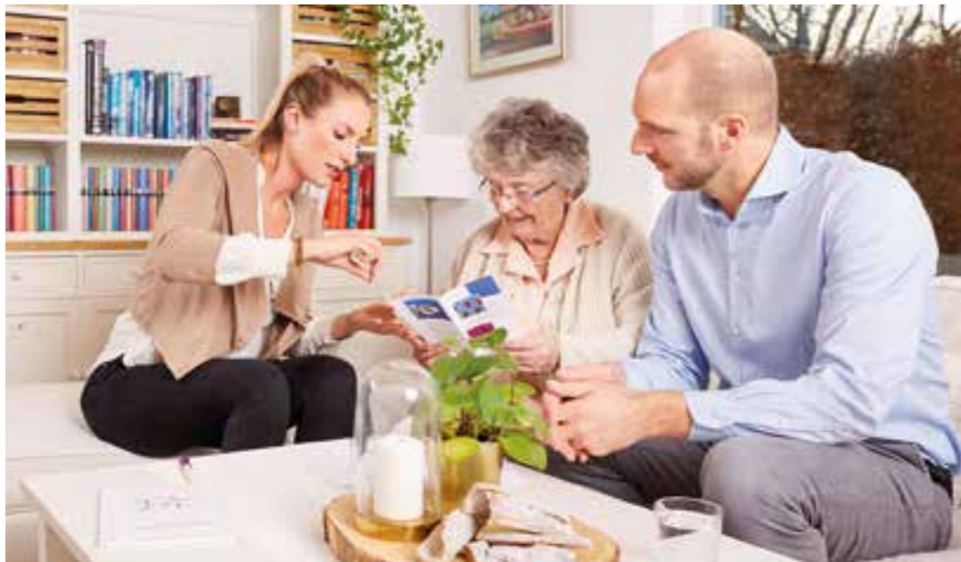
Kurzzeitpflege, Verhinderungspflege, Pflegehotel: Eine fachkundige Beratung kann die verschiedenen Lösungen für Urlaub in der Pflegesituation aufzeigen.

Für Erholung und Entspannung gibt es Unterstützung von der Pflegekasse, damit pflegende Angehörige auch einmal eine Auszeit nehmen können.