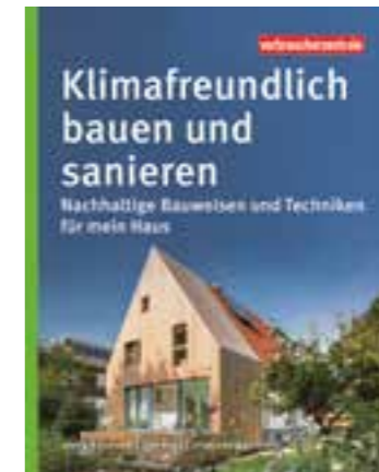
Dieser Ratgeber ist bei den Verbraucherzentralen NRW erhältlich.

Vorteile begrünter Dächer und Fassaden in die Breite bringen und auch Hemmnisse und Vorurteile abbauen“, so ZVDH-Präsident Dirk Bollwerk. „Gerade jetzt, wo im Rahmen der Energiewende Photovoltaikanlagen immer mehr an Bedeutung gewinnen, ist es wichtig zu wissen, dass PV-Anlagen wunderbar auf begrünten Dächern aufgebaut werden können, sich sogar ide-