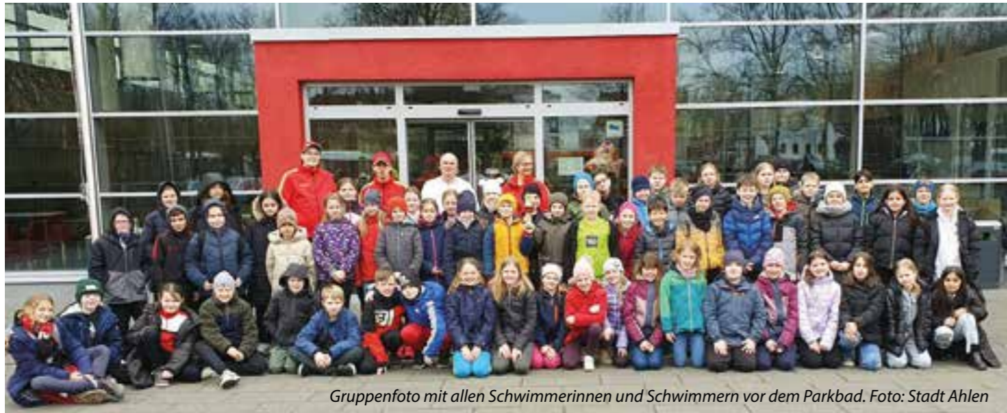
Gruppenfoto mit allen Schwimmerinnen und Schwimmern vor dem Parkbad.

Die Schüler:innen der 3. und 4. Klassen aus fünf Ahleiner Grundschulen haben jetzt ermittelt, wer im Schwimmbecken die Nase vorn hat. Im Parkbad trafen sie sich zur Grundschul-Stadtmeisterschaft im Schwimmen. Eingeladen hatte dazu das Sportamt der Stadt Ahlen.