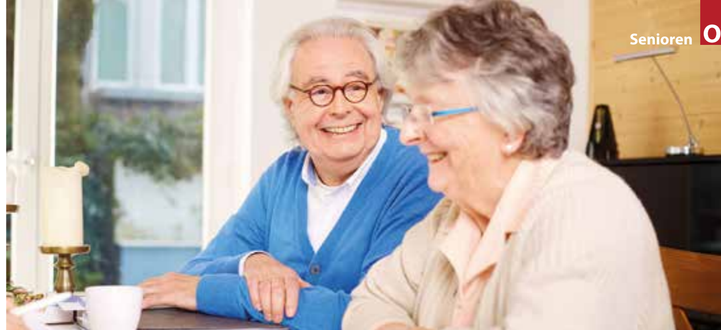
Urlaub ist auch für Pflegebedürftige und pflegende Angehörige möglich. Individuelle Fragen dazu kann eine Pflegeberatung klären.

Urlaub getrennt oder gemeinsam verbringen möchten, gibt es verschiedene Möglichkeiten. Verreist die Pflegeperson allein, kann die Versorgung im Rahmen einer Verhinderungspflege von einer Ersatzperson oder einem Pflegedienst übernommen werden. Dafür zahlt die Pflegekasse ab Pflegegrad 2 pro Jahr bis zu 1.612 Euro für maximal sechs Wochen. Zusätzlich können bis zu 806 Euro aus noch nicht genutzten Leistungen der Kurzzeitpflege für die Verhinderungspflege eingesetzt werden, also insgesamt maximal 2.418 Euro. Wer dagegen die stationäre Kurzzeitpflege in einem Pflegeheim für die Urlaubszeit nutzt, kann dafür von der Pflegekasse bis zu 1.774 Euro für höchstens acht Wochen im Kalenderjahr erhalten und zusätzlich den gesamten Betrag für die Verhinderungspflege einsetzen, sodass maximal 3.386 Euro zur Verfügung stehen. „Um die individuell beste Lösung zu finden, ist es sehr sinnvoll, eine Pflegeberatung zu nutzen“, so von Knobelsdorff. Eine kostenlose Hotline bietet compass unter 0800-101-8800 an, zusätzlich das komplette Beratungsprogramm für Privatversicherte. Natürlich stehen Ihnen zur Beratung auch