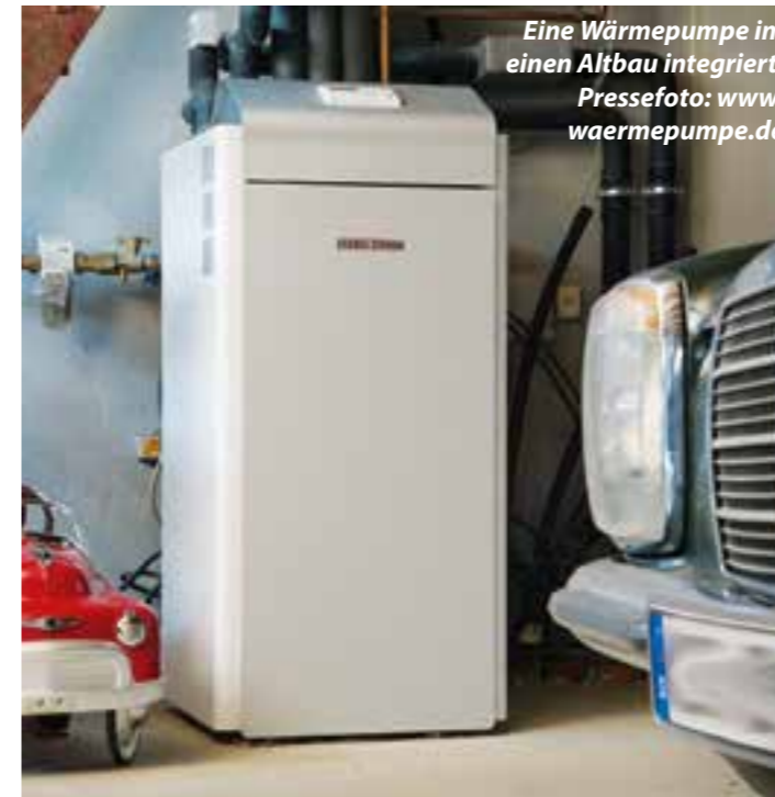
Eine Wärmepumpe im einen Altbau integriert.

Gründächer und Solar Begrünte Gebäude leisten einen wichtigen Beitrag zur Verbesserung des Stadtklimas. Denn sie sorgen für Verdunstungskühlung, Erhöhung der Luftfeuchte und Verschattung von Gebäudeteilen. So verringern sie den Hitzestress an heißen Sommertagen. Ebenso fördern Pflanzen an Dach und Fassade die