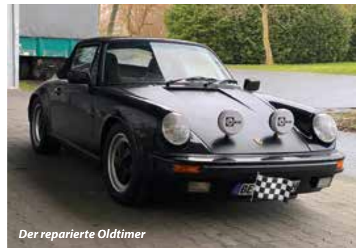
Der reparierte Oldtimer

Einen Fachbetrieb zu finden, der den 32 Jahre alten Porsche 911 reparieren konnte, erwies sich als recht schwierig. Schließlich übernahm eine Firma die Reparatur des Versicherungsschadens. Die Fachwerkstatt für Oldtimer benötigte bis Februar 2020 für die Reparatur, die sehr aufwändig war, da ein neuer Kabelbaum eingebaut werden musste.