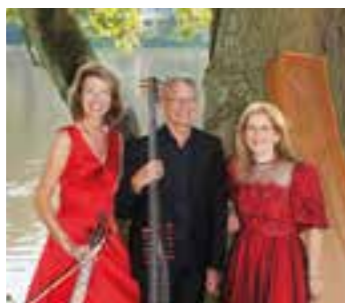
Pressefoto: Hamburger Ratsmusik