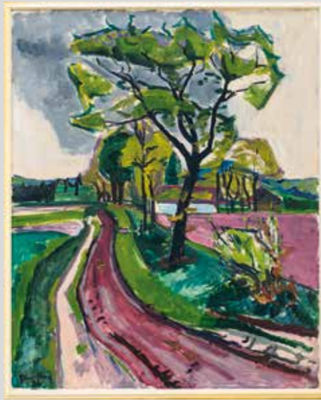
Herbert Ebersbach, Strauhof (Sennelandschaft), 1936, Öl auf Leinwand, Kunstmuseum Ahlen, Dauerleihgabe aus Privatbesitz

Mit den Highlights aus dem Sammlungsbestand zur Klassischen Moderne wird das Jubiläumsjahr zum 30-jährigen Bestehen des Kunstmuseums Ahlen eröffnet. Sie steht am Anfang besonderer Präsentationen zur Sammlung des Museums, die mittlerweile rund 1.500 Werke von 3.200 Künstlerinnen und Künst-