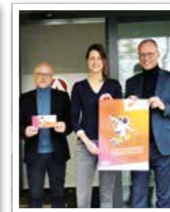
Beckum Seite 11 BEAM 2023