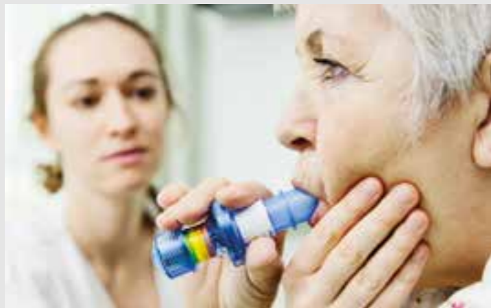
Spirometrie, eine medizinische Untersuchung zur Messung der Lungenfunktion.