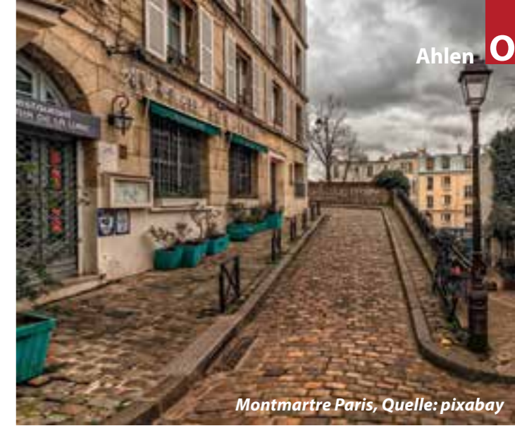
Montmartre Paris

Am Folgetag setzt die Gruppe auf der Seine-Insel ihre Besichtigung fort. Geplant ist ein Besuch in der Sainte-Chapelle (13. Jh.), einem Meisterwerk der Hochgotik. Von dort ist ein geführter Spaziergang durch das schöne Marais und das jüdische Viertel vorgesehen mit dem Besuch des Musée Carnavalet am Nachmittag. Das unlängst renovierte