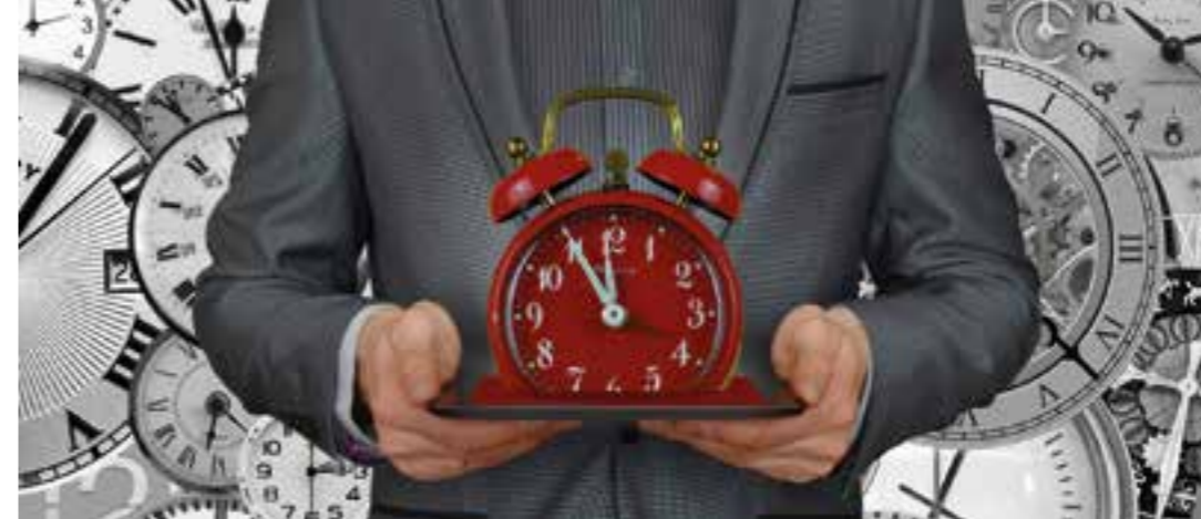
Zuverlässigkeit gehört zu den Kernkompetenzen, die man als Azubi mitbringen sollte.

meldungen zeigt, auch andere Standpunkte akzeptiert und umgekehrt in der Lage ist, Kritik selbst wertschätzend anzubringen, ist schon gut auf das Berufsleben vorbereitet. Kritik bietet schließlich die Chance zur persönlichen Weiterentwicklung! Dazu passt auch die Kommunikationsfähigkeit, die in vielen Bereichen nützlich ist. Denn wer mit Einzelnen oder in einer Gruppe aufmerksam Gespräche führen kann, vermittelt Respekt und Wertschätzung. Deswegen ist auch Empathie gefragt. Man sollte versuchen, sich in andere hineinzuversetzen und Interesse an seinen Mitmenschen und deren Lebenssituationen zu haben.