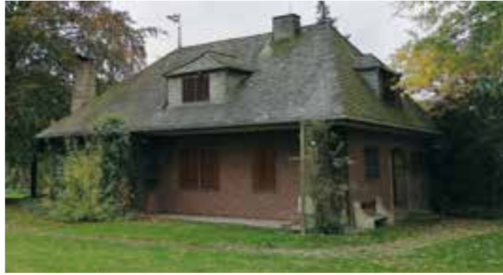
Wald-Kita-Kinder sind bei Wind und Wetter draußen. Bei ganz schlechtem Wetter steht aber auch eine Hütte zur Verfügung.

Nach der „Wald-Kita“ an der Langst soll die Stadt Ahlen eine weitere naturnahe Kita bekommen. Betreiber wird das Deutsche Rote Kreuz werden, das auch schon die Wald-Kita und die Kita Hummelwiese im Ortsteil Dolberg betreibt. Realisiert wird das Projekt in Zusammenarbeit mit der Fabian-Kaldewei-Stiftung.