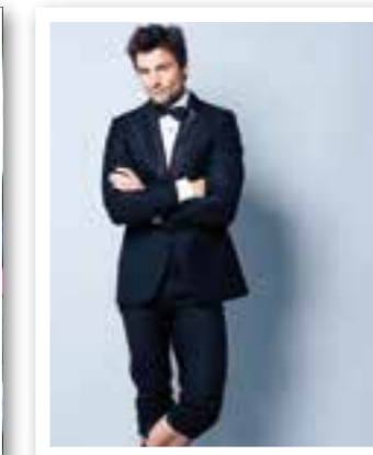
Kultur Seite 30 Veranstaltungen in Ahlen und Beckum

Impressum Ortszeit Ahlen/Beckum Herausgeber und Verlag: FKW – Fachverlag für Kommunikation und Werbung GmbH Geschäftsführung: Rüdiger Deperade Delecker Weg 33 59519 Möhnesee-Wippringsen www.fkwverlag.com info@fkwverlag.com Anzeigen: Jutta Schubert-Gosda Tel.: 0 25 21 • 82741 - 21 gosda@fkwverlag.com Sandra Epping Tel.: 0 25 21 • 82741 - 24 epping@fkwverlag.com Linnenstraße 2 59269 Beckum Tel: 0 25 21 - 827 41 0 Fax: 0 25 21 - 827 41 29 www.fkwverlag.com Redaktion: Michaela Dziwisch Heike Sieger Satz: www.4cminds.de Druck: Senefelder Misset, Doetinchem Erscheinungsweise: monatlich Verbreitungsgebiet: Ahlen, Beckum, Drensteinfurt, Oelde und Ennigerloh Erfüllungsort: Möhnesee Auflage: 14.550 Keine Gewähr für unaufgefordert eingedachte Manuskripte oder Fotos. Der Abdruck von Veranstaltungshinweisen ist kostenlos. Abdruck und Vervielfältigung redaktioneller Beiträge und Anzeigen bedürfen der ausdrücklichen Zustimmung des Verlages.