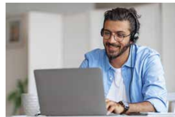
Die Umschulung in einen anderen Beruf kann aus verschiedenen Gründen notwendig werden. Für viele bedeutet eine solche Neuorientierung auch eine große Herausforderung.

lungsbegleitende Hilfen in Form von zusätzlichem Fachunterricht, der auf die Bedürfnisse und den Umschulungsberuf der Teilnehmer abgestimmt ist. Damit wird Umschülern in Betrieben ermöglicht, ihre Ausbildung erfolgreich zu beenden und langfristig in den Arbeitsmarkt integriert zu werden. (djd/hs)