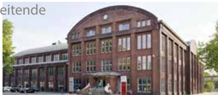
Vor der Lohnhalle der früheren Zeche Westfalen erinnern ab 7. März Stolpersteine an die Schicksale von Zwangsarbeitenden, die an diesem Ort Opfer des Nazi-Unrechts wurden.

Die Stolpersteine, die am Dienstag, 7. März, verlegt werden, erinnern überwiegend an 13 Frauen und Männer, die als Zwangsarbeitende während des Krieges 1939 bis 1945 in unterschiedlichen Ahlener Unternehmen eingesetzt waren. Sie mussten unter teils menschenwürdigen Bedingungen leben und arbeiten. Zur „Verhinderung der