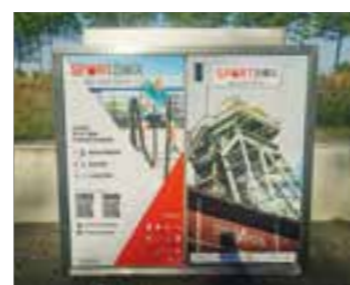
Die „Sportbox“ an der Zeche Westfalen kann kostenlos benutzt werden.

gebot, und es wird gerne angenommen, so Marcel Fels vom Sportamt der Stadt Ahlen. Die Sportbox lässt sich ganz einfach öffnen durch Klicken auf eine dazugehörige App, deren Bedienung jetzt verbessert und damit deutlich fehlerfreier geworden ist. Nach Nutzung werden die Sachen wieder eingeräumt und der Schrank verschlossen. Ein Kamerasystem überwacht, dass die Sportbox wieder ordnungsgemäß eingeräumt wird. Die Registrierung in der App kostet einmalig 50 Cent und dient ausschließlich der Datenerhebung im Falle von Missbrauch. Zur Ausstattung der Sportbox gehören ein „Funktional Fitness