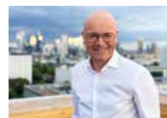
Karsten Schwanke.

Kulturinteressierte in Oelde können sich gleich zu Beginn des Jahres 2023 auf drei hochkarätige Veranstaltungen in der Aula des Thomas-Morus-Gymnasiums, Zur Dicken Linde 29, freuen.