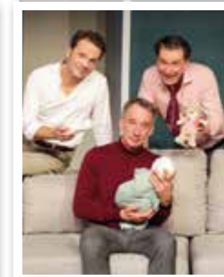
Oelde Seite 13 Veranstaltungen im neuen Jahr