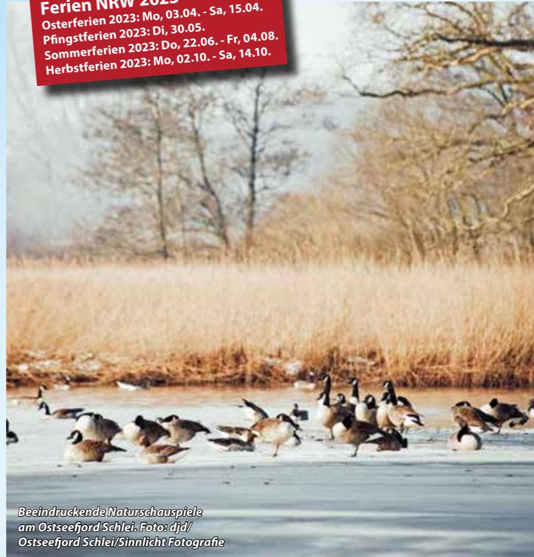
Beeindruckende Naturschauspiele am Ostseefjord Schlei.

Ferien NRW 2023 Osterferien 2023: Mo, 03.04. - Sa, 15.04. Pfingstferien 2023: Di, 30.05. Sommerferien 2023: Do, 22.06. - Fr, 04.08. Herbstferien 2023: Mo, 02.10. - Sa, 14.10.