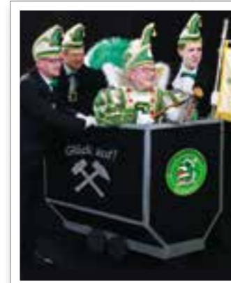
Ahlen Seite 6 Neuer Karnevalsprinzip