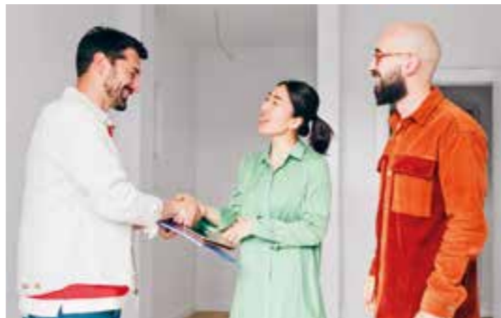
Eine Partnerschaft auf Augenhöhe - das sollte die Zusammenarbeit mit einem Immobilienmakler sein.