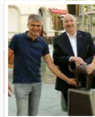
Beckum Seite 9 Karneval in Beckum