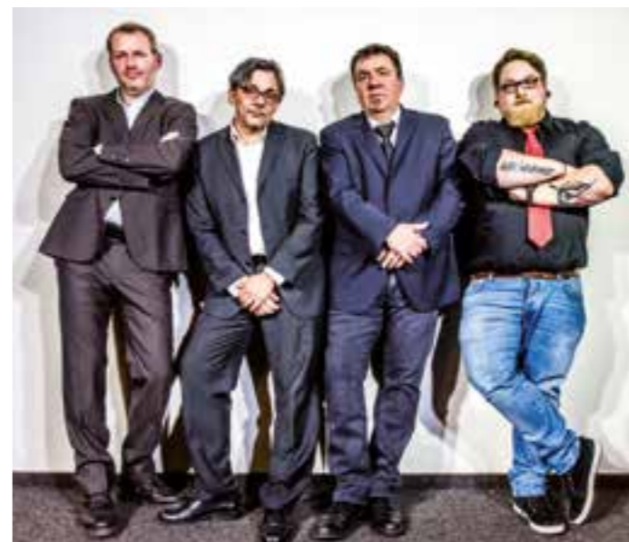
White River Blues Band, Foto: Rolle Ruhland, https://www.facebook.com/rolle.ruhland

Die „White River Blues Band“ besteht aus vier ambitionierten Musikern aus Hamm, Dortmund und Münster. Sie wollen das Publikum mit seichteren und härteren Klängen beglücken. Insgesamt steht diese Band jedoch für eins: Blues Rock! In den feinsten Zwim gehüllt werden die Jungs nicht nur durch ihre Optik für einen heißen Abend