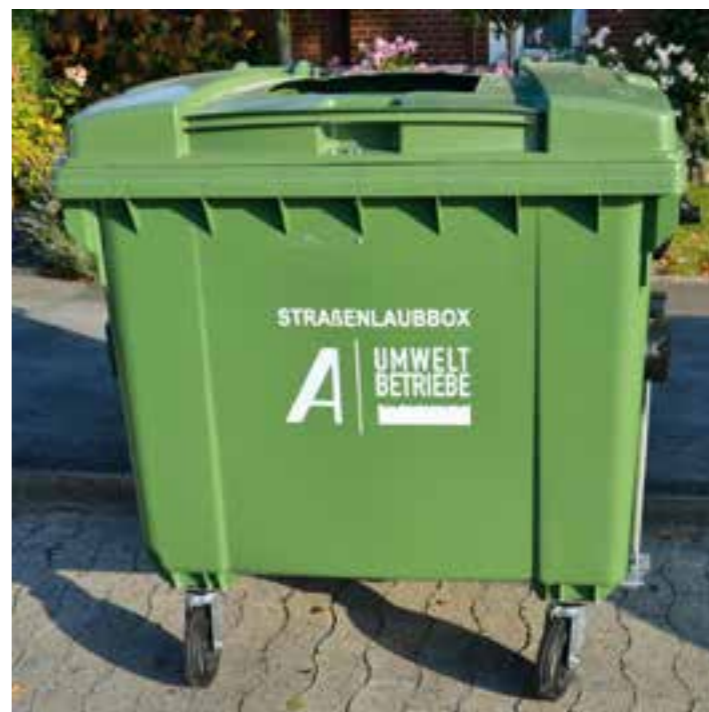
Die Straßenlaubboxen gehören bis Mitte Dezember zum Stadtbild an baumreichen Straßen.

Vorgesehen sind die Straßenlaubboxen ausschließlich zur Sammlung von städtischem Straßenlaub, das auf die Gehwege fällt und zu dessen Beseitigung die anliegenden Bürgerinnen und Bürger verpflichtet sind. „Privates Laub aus dem eigenen Garten ist auch privat zu entsorgen“, betont Döding und empfiehlt dafür entweder die Biotonne, gegen eine Gebühr erhältliche Bioabfallsäcke der Umweltbetriebe oder die Fahrt zum Wertstoffhof. Dort kann Gartenlaub schon kostenlos angeliefert werden.