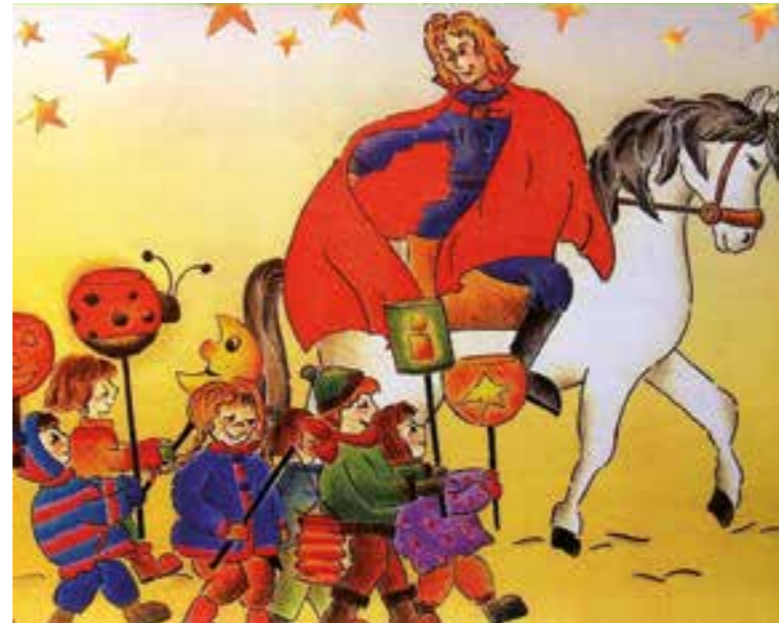
Plakat: Kindertageseinrichtung St. Pankratius Vellern

Am 11. November wird wieder das Andenken des heiligen St. Martin gefeiert. Zu diesem Tag haben die Katholische Kirchengemeinde St. Franziskus und die Kath. Propsteigemeinde St. Stephanus St.-Martins-Umzüge organisiert.