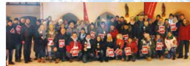
Finalteilnehmer 2018/19.

Die Kindertageseinrichtung St. Pankratius Vellern lädt am Martinstag, Montag, 11. November, ab 17 Uhr zum Martinsumzug ein. Los geht es am Schulhof in Vellern. Neben guter Laune und einer Laterne sollten die Kids eine Tasse, Kakao und Kleingeld für die Brezeln mitbringen.