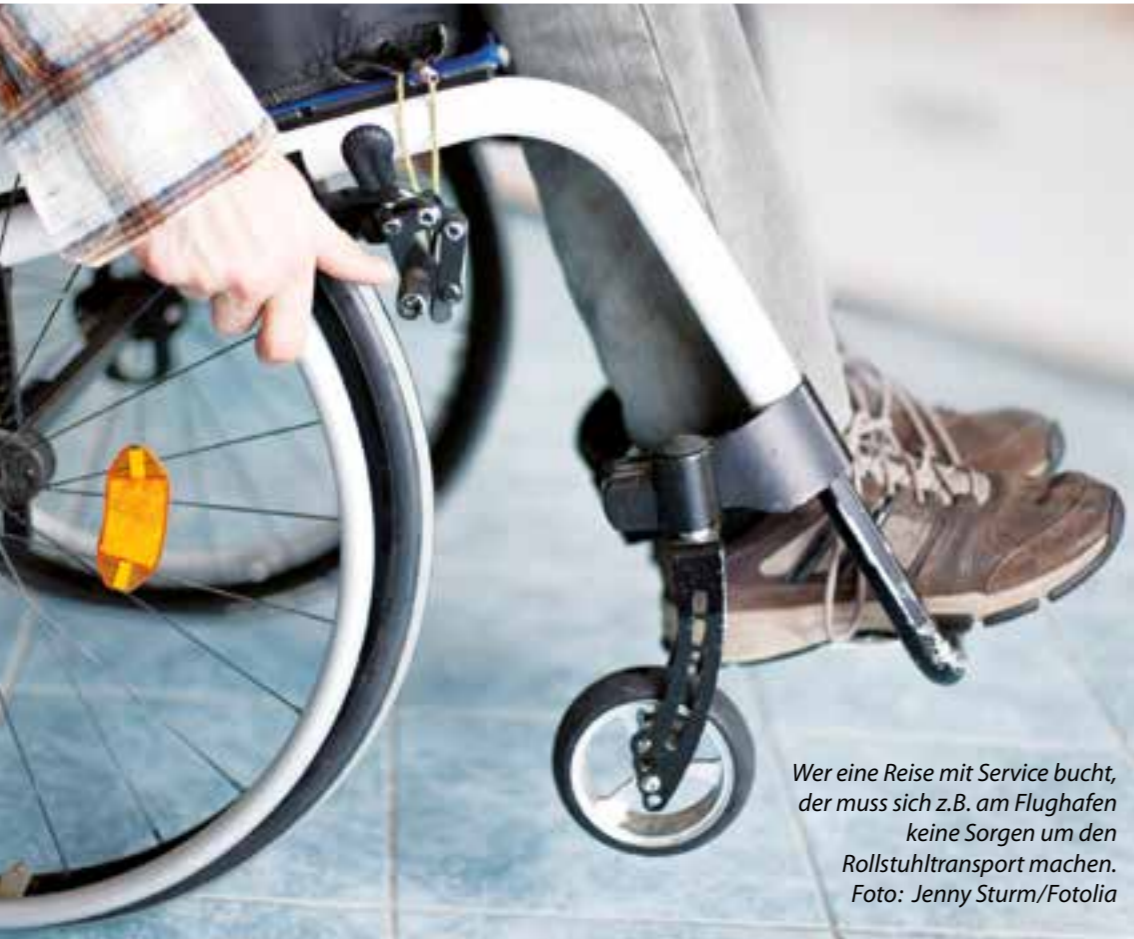
Wer eine Reise mit Service bucht, der muss sich z.B. am Flughafen keine Sorgen um den Rollstuhltransport machen.