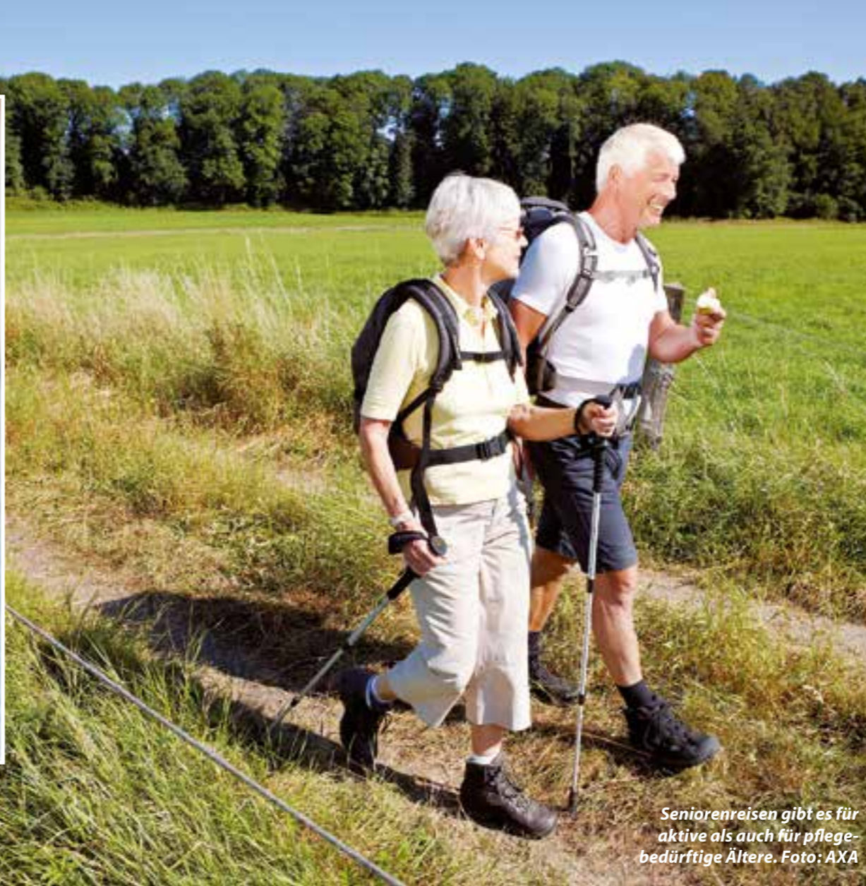
Seniorensreisen gibt es für aktive als auch für pflegebedürftige Ältere.