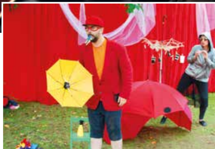
Pressebild: „spielMarie“/Stadt Beckum

Familienfest Am Sonntag, 28. Juli, präsen-