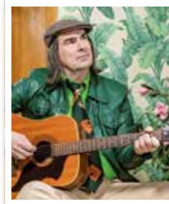
Ahlen Seite 6 34. Stadtfest