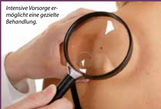
Intensive Vorsorge ermöglicht eine gezielte Behandlung.