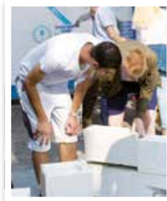
Warendorf Seite 14 Berufsorientierungsmesse (BOM)