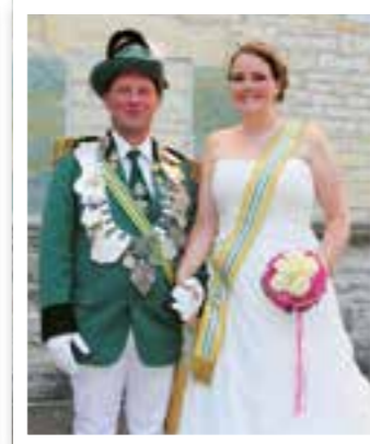
Beckum Seite 10 Bürgerschützen feiern