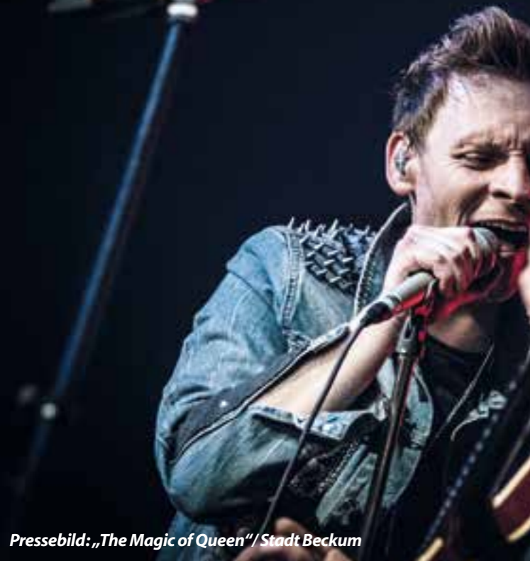
Pressebild: „The Magic of Queen“/Stadt Beckum

Ab Juli heißt es wieder „Beste Unterhaltung – umsonst und draußen“, denn dann startet der „Beckumer Sommer“ mit einem vielseitigen Programm. Viele Open-Air-Veranstaltungen lassen Beckum zum Anziehungspunkt für Bürger und Besucher aus der Umgebung werden. Im Juli können sich Jung und Alt auf folgende kostenlose Veranstaltungen freuen: