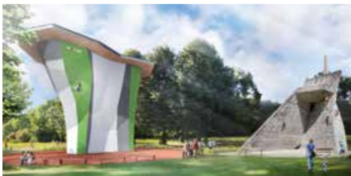
Ein neuer Kletterturm im Phoenix-Park erweitert die Kletteranlage um viele neue Klettermöglichkeiten.

Der Alpenverein Beckum entwickelt die Kletteranlage im Aktivpark Phoenix weiter zu einem Zentrum des Klettersports im südlichen Münsterland. Mit dem neuen Kletterturm bietet die erweiterte Anlage viele Trainingsmöglichkeiten für unterschiedliche Klettertechniken sowohl für den Breiten- und Schulsport, als auch für den Leistungssport.