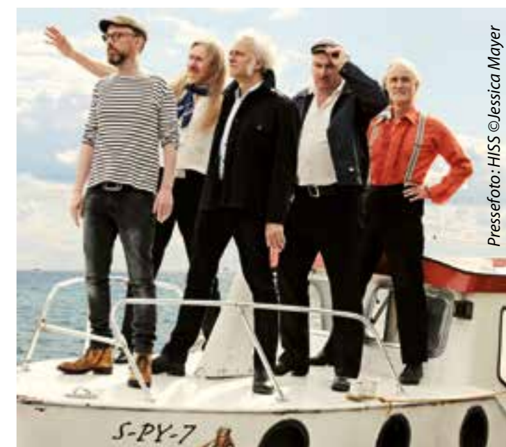
Pressefoto: HISS © Jessica Mayer

Zu einer artistischen Zeitreise zu den ersten großen Frauen ihrer Zunft laden die Artistinnen von Vintage! Women! Variete! am Freitag, 26. Juli, ein. Artistinnen lebten und arbeiteten, wie es bürgerlichen Frauen des 19. Jahrhunderts unmöglich war. Mit ihrer Kleidung, Auftreten und ihrer Leistung brachen sie mit allen Gesetzen der angeblichen Weiblichkeit. Doch auch damals war das Leben einer Artistin kein Zu-