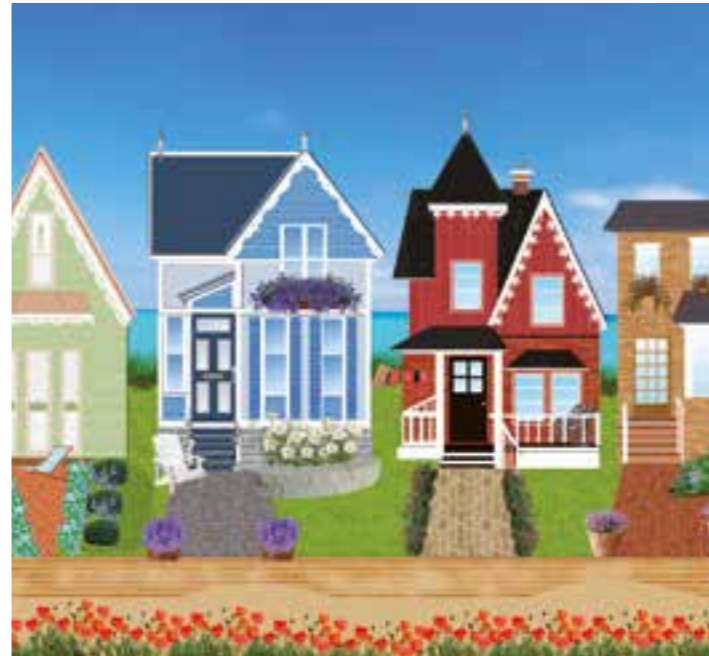
Ob groß, ob klein, ob alt, ob neu: Auf jede Immobilie wird die Grundsteuer fällig.

bende wie weniger begüterte Immobilieneigentümer und Mieter gleichermaßen. Bei dynamisch-wertabhängiger Besteuerung wird das Haus unversehens als Vermögensgegenstand wie andere Renditeprodukte behandelt. Das Wohnen in teuren Städten würde zusätzlich verteuert.“ Alternative „wertunabhängige Besteuerung“ Bisher wurde die Grundsteuer auf Basis von Einheitswerten berechnet, die in Westdeutschland noch aus den 60er-Jahren