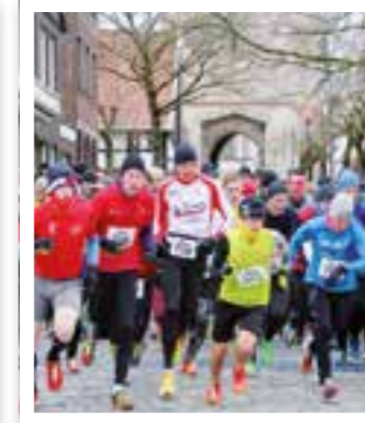
Stromberg Seite 22 Burggrafenlauf