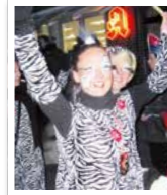
Beckum Seite 6 Karneval