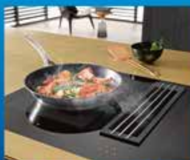
Kochfeld & Dunstabzug

Gestalten Sie bei uns Ihre Traumküche und finden Sie zugleich die passenden Haushaltsgeräte: