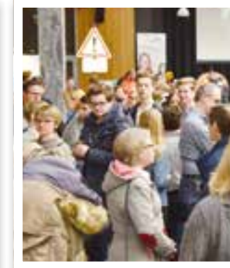
Wadersloh Seite 27 „BIM“ öffnet ihre Tore