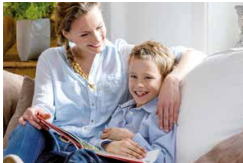
Hören Kinder und Jugendliche nicht mehr gut, lohnt sich der Besuch beim Hörgeräteakustiker.

Ebenso schleichend wie die Sehkraft kann auch das Hörvermögen nachlassen. Oftmals bemerken erst die Gesprächspartner, dass etwas nicht stimmt. Oder Sie