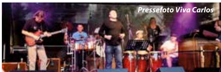
Pressefoto Viva Carlos

Santana-Tribute-Band am 9. Februar zu Gast