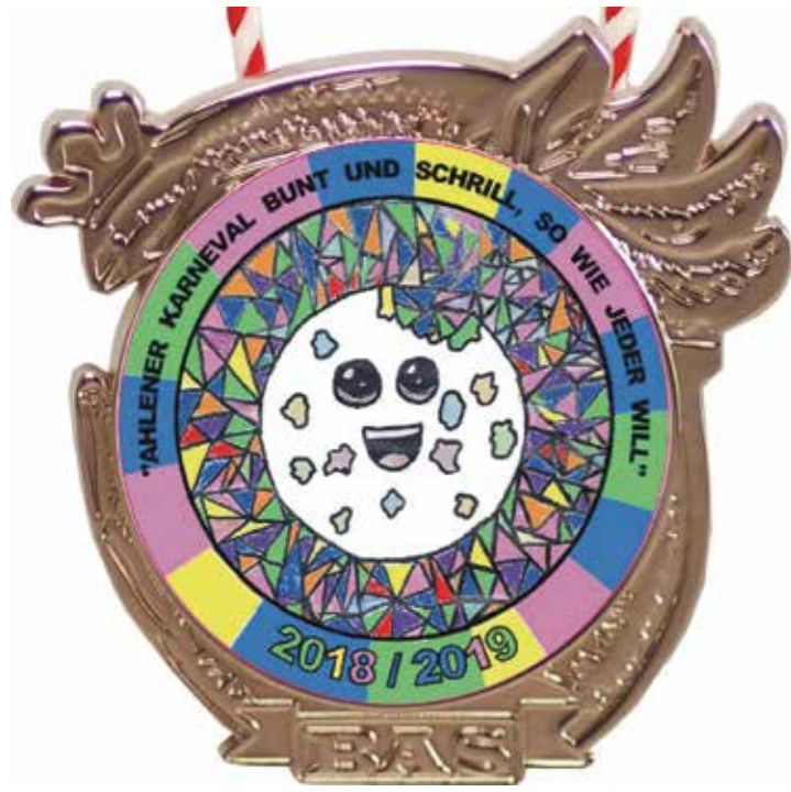
Der Sessionsorden 2018/19 für 4 Euro und der motivgleiche Sessions-Pin für 2,50 Euro sind erhältlich bei: Weinhaus Thiele in der Oststraße, „Kupfergrill“ an der Rottmannstraße, Fotostudio Gottschling, der „Spielerei“ an der Oststraße und natürlich bei den Karnevalsgesellschaften.