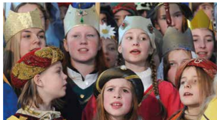
Am ersten Wochenende im Januar sind wieder die Sternsinger unterwegs

Sternsinger ziehen durch Ahlen und Beckum