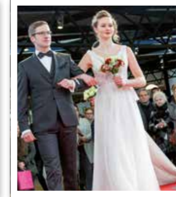
Ahlen Seite 8 Hochzeitsmesse Ostendorf