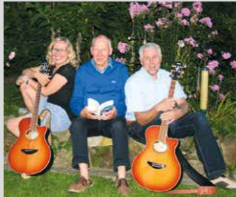
Reise sogar an. Der Eintritt kostet 6 Euro, Anmeldungen sind in der Stadtbücherei Neubeckum, Gottfried-Polysius Straße 8, unter Tel. 02525/4660 sowie E-Mail: stadtbuecherei@beckum.de möglich.

sten vorbei und auch am Postamt, aus der Stadt hinaus und immer weiter, 87 Tage, 1.000 Kilometer. Zu Fuß von Südeuropa bis an die schottische Grenze zu Queenies Hospiz. Eine Reise, die er jeden Tag neu beginnen muss. Für Queenie. Für seine Frau Maureen. Für seinen Sohn David. Für sich selbst. Und für uns alle. Man begleitet Fry auf dem Fußmarsch seines Lebens, bei dem er zu sich selbst findet und mit vielen unterschiedlichen Leuten in Kontakt kommt. Einige davon schließen sich ihm auf seiner