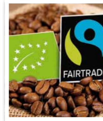
Beckum Seite 6 Fairtrade Town Beckum