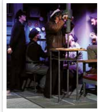
Oelde Seite 11 Fesselndes Theater