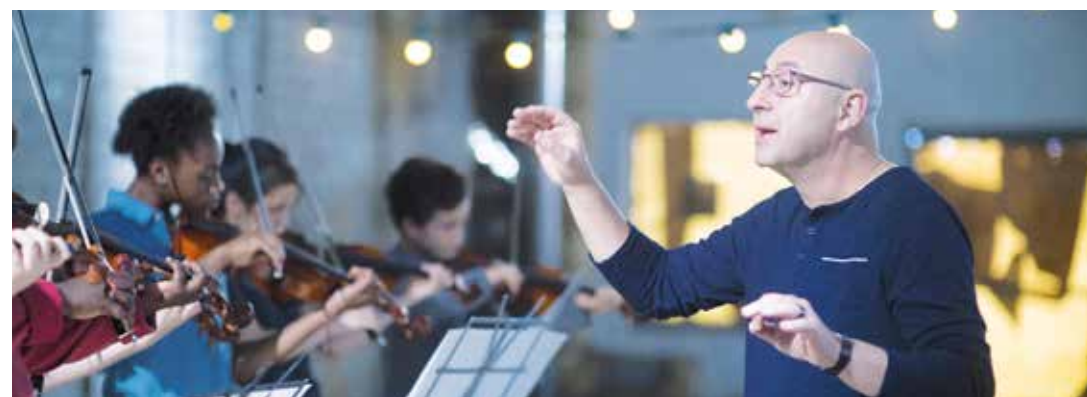
Filmszene „La Mélodie“

Am Freitag, 17. August veranstaltet die Gemeinde Wadersloh zum neunten Mal in Folge im Innenhof des ehemaligen Kreuzgangs der Abtei Liesborn einen Open-Air-Kinoabend.