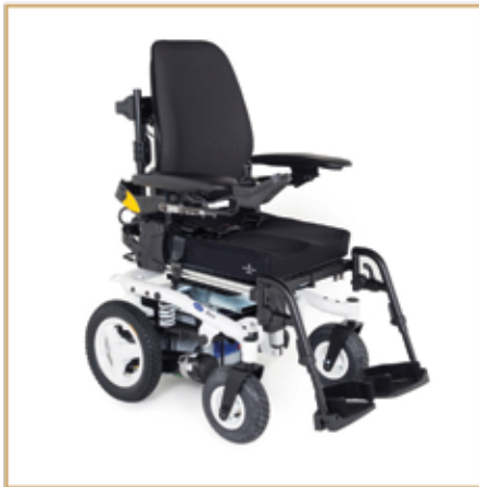
Elektrorollstühle ab 1899,- EURO