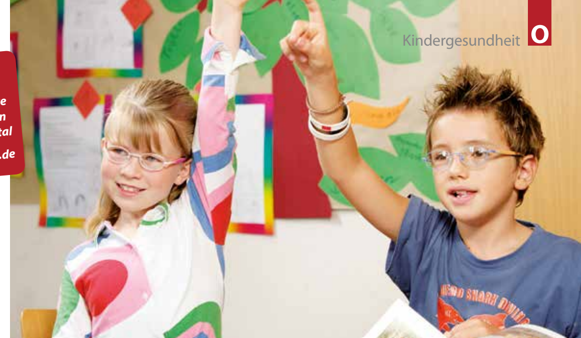
Lassen Sie vor der Einschulung die Sehfähigkeit der Kinder nochmals prüfen.

Entwicklung fördern Junge Eltern oftmals verunsichert, wenn sich der eigene Nachwuchs vielleicht etwas langsamer entwickelt. Beispiel: Ein Kind macht riesige Fortschritte in der Bewegung, die sprachliche Entwicklung hinkt aber hinterher. Dies ist völlig normal und in der Regel kann das Kind schnell wieder „aufholen“. Sollten Sie jedoch bemerken, dass ihr Junior stärkere Defizite entwickelt, oder sich unsicher sein, ob alles im normalen Rahmen abläuft, dann konsultie-