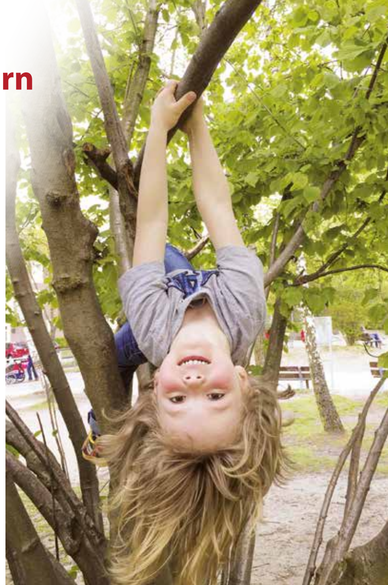
Klettern, spielen und bewegen fördert nicht nur die körperliche, sondern auch die geistige Entwicklung von Kindern.

Hörstörungen früh erkennen In den ersten Lebensjahren reift das Hörvermögen von Kindern aus und Schritt für Schritt lernt es, weiter entfernte Dinge zu hören, Geräusche zu erkennen und schließlich konzentriert zuzuhören. Nicht nur angebore-