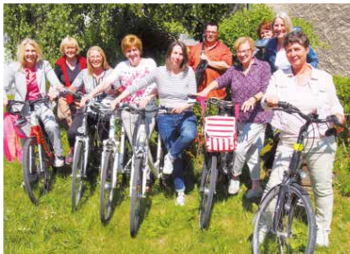
Das Team Nachhaltigkeit der VHS.

VHS-Beckum-Wadersloh stellt neues Programm vor