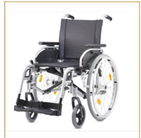
Rollstühle ab 185,- EURO