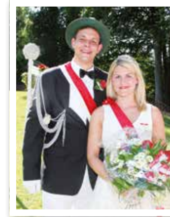
Beckum Seite 8