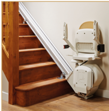
Treppenlifte ab 2499,- EURO