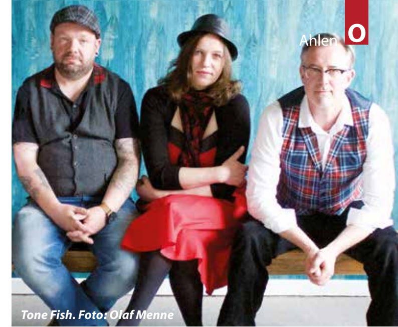
Tone Fish.