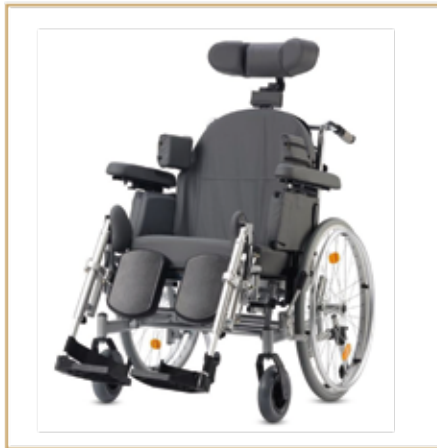
Pflegerrollstühle ab 799,- EURO