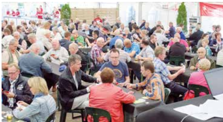
Die 13. Beckumer Doppelkopf-Stadtmeisterschaft verspricht Spannung.

Im Festzelt des Schützenvereins „Norden“ e.V. Beckum, findet am Freitag, 10. August, ab 19.30 Uhr ein Doppelkopf-Spiel der Extraklasse statt: Bereits zum 13. Mal veranstaltet der Schützenverein „Norden“ die Beckumer Stadtmeisterschaft im Doppelkopf.