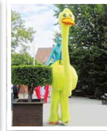
Oelde Seite 22