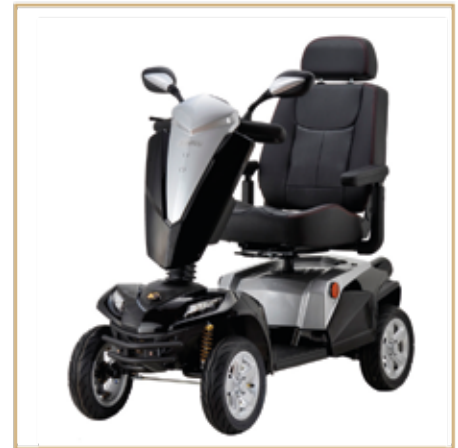
Elektromobile ab 1199,- EURO

Alles, was Sie brauchen, unter einem Dach !