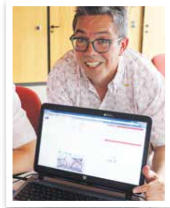
Ahlen Seite 27