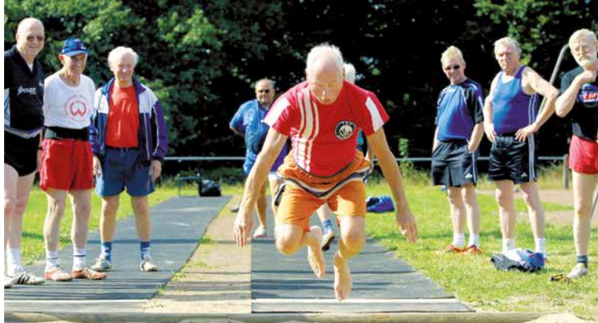
Sport hält fit bis ins hohe Alter.