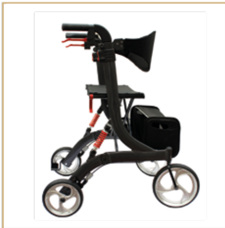
Rollatoren ab 149,- EURO

ELEKTROMOBILE ♦ ROLLATOREN ♦ TREPPENLIFTE ♦ ELEKTROLLSTÜHLE ♦ MANUELLE ROLLSTÜHLE ♦ SAUERSTOFFKONZENTRATOREN