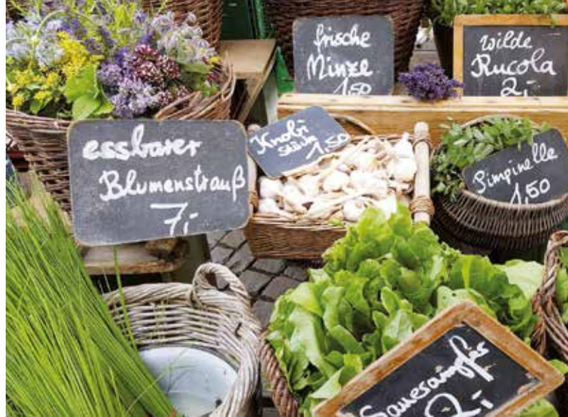
Produkte aus heimischem Anbau punkten mit kurzen Transportwegen und Frische.