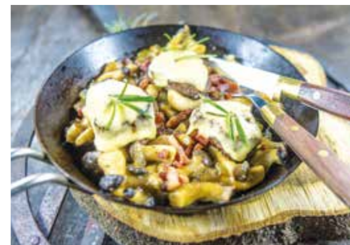
Rezept und Foto: Dorn/Deutscher Jagdverband (DJV)