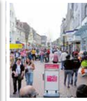
Oelde Seite 18 Herbst-Erlebnis-Tag