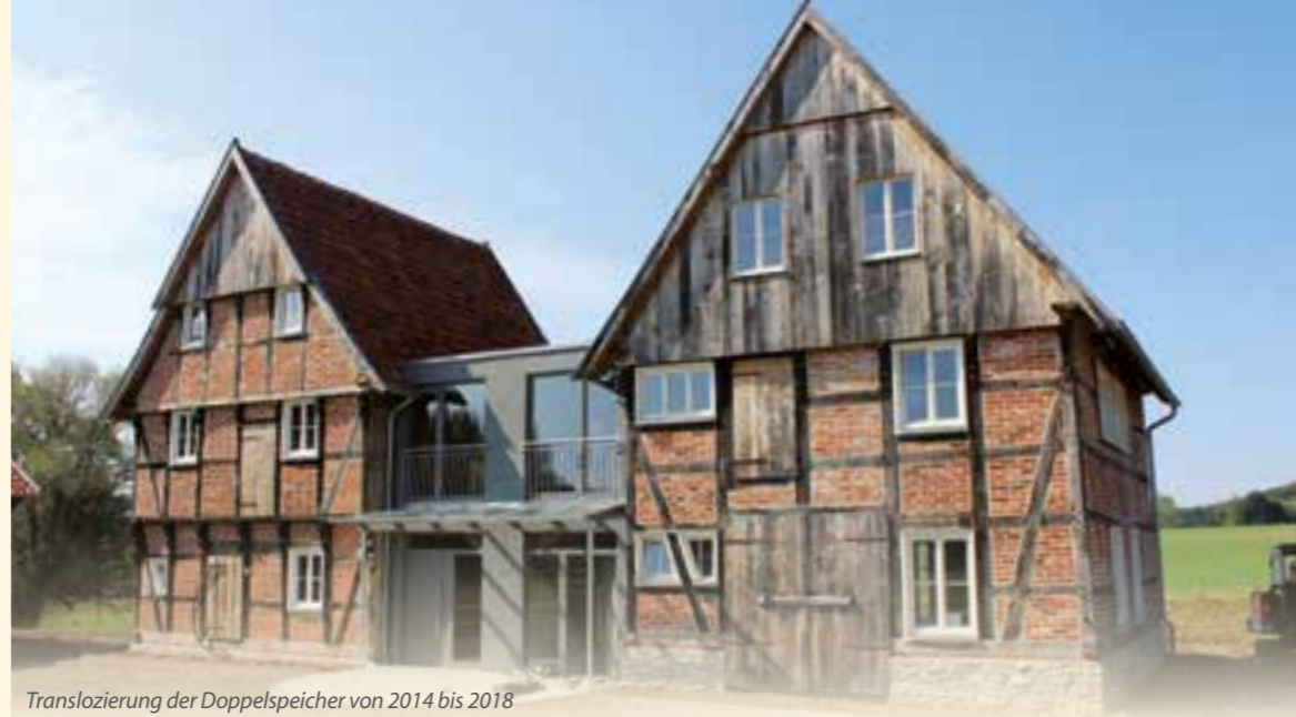
Translozierung der Doppelspeicher von 2014 bis 2018

Hof Plümpe · Holter 7 · 59269 Beckum www.hof-pluempe.de