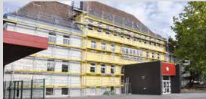
Die Friedrich-von-Bodelschwingh-Grundschule in Neubeckum wird umfassend modernisiert.

Im Rahmen des „Gute-Schule-2020“-Förderprogramms wird die über 100 Jahre alte Friedrich-von-Bodelschwingh-Grundschule in Neubeckum umfangreich saniert. Die drei Gebäude wurden zunächst eingerüstet und alle Flächen nach einem erarbeiteten Farbkonzept gestrichen. Doch nicht nur die Farbe, sondern auch neue Dachrinnen und Fallrohre mussten angebracht werden. Was man von außen nicht erkennen kann, sind die Veränderungen im Innenbereich. Auf dem neu verlegten Estrich bekommen die Klas-