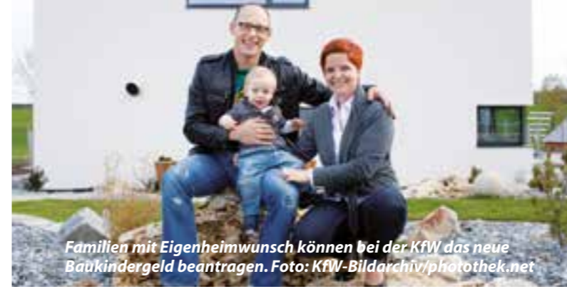
Familien mit Eigenheimwunsch können bei der KfW das neue Baukindergeld beantragen.

12.10.2018 an: verlosung@fkvverlag.com (Der Gewinn wird ausgelost, der Rechtsweg ist ausgeschlossen). Bitte geben Sie unbedingt Ihre Anschrift und Telefonnummer für die Gewinnbenachrichtigung an. Das „Ortszeit Ahlen/Beckum-Team“ wünscht viel Glück!