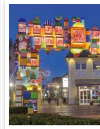
Oelde Seite 20