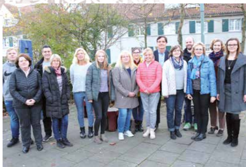
Viele Akteure werden auch in diesem Jahre dafür sorgen, dass „Merry Christmas“ zu einer gelungenen Veranstaltung wird.

Christmas hat sogar der Weihnachtsmann sein Kommen zugesagt. Ende ist gegen 19 Uhr. (ka)