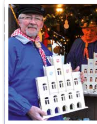
Beckum Seite 5