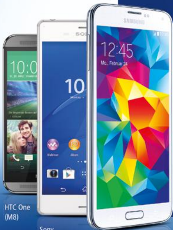
HTC One (M8)