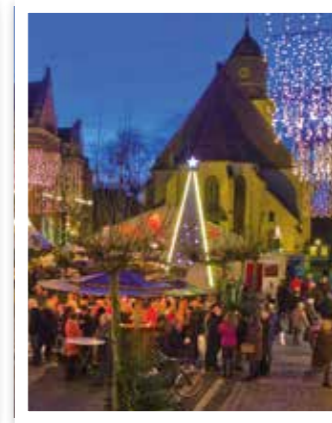
Ahlen Seite 10