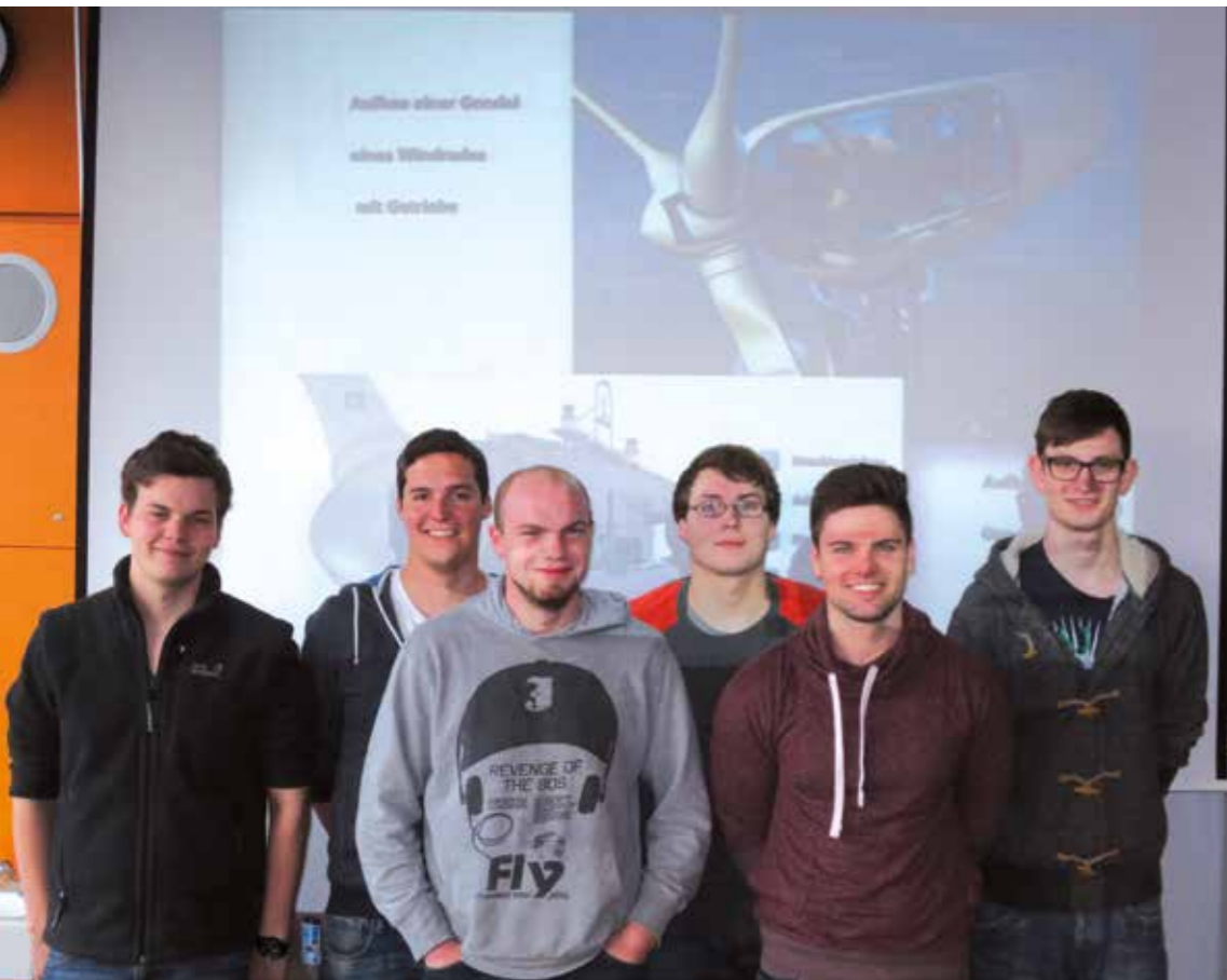
Die Schüler der Einjährigen Fachoberschule für Technik wirkten tatkräftig bei dem Projekt mit.

Seit einigen Wochen zielt eine Kleinwindenergieanlage (KWEA) des Typs Superwind 350 eine Ecke des Daches des Berufskollegs Beckum. Sie ist das Ergebnis einer Projektarbeit von Schülern der einjährigen Fachoberschule für Technik unter Leitung ihres Klassenlehrers Peter Dennin und wurde unter anderem mit Mitteln aus der Teilnahme am Wettbewerb Schulen machen Wind, sowie mit freundlicher Unterstützung