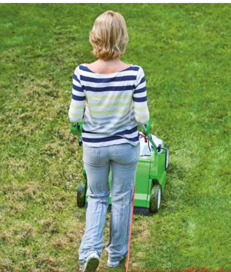
Frischekur für den Rasen: Das Vertikutieren fördert die Bildung neuer Triebe und ein gesundes Wachstum.

Tipps, wie das Grün fit für die Gartensaison wird