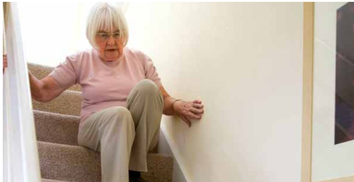
Stürze zählen zu den häufigsten Unfallarten und sind für Senioren besonders risikoreich.

Zuhause fühlen sich gerade ältere Menschen am wohlsten, in den eigenen vier Wänden ist einem jeder Winkel vertraut. All die vielen Handgriffe des Alltags - vom Zwiebelschneiden bis zum Gardinenaufhängen - werden routiniert ausgeführt. Doch trotz eingespielter Routine geschehen im häuslichen Bereich besonders viele Unfälle. Ein großer Teil davon sind Stürze. So berichtete das Robert Koch-Institut (RKI) im Jahr 2016, dass drei Prozent der Erwachsenen im vorigen Jahr gestürzt seien, viele davon waren Senioren. Besonders im höheren Lebensalter kann das weitreichende Folgen wie Knochenbrüche und eine Einweisung ins Krankenhaus zur Folge haben.