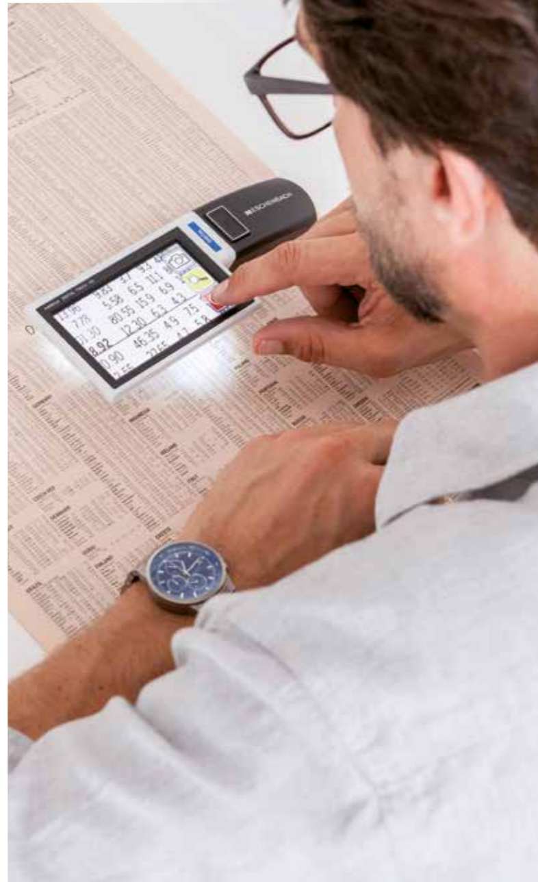
Digitale Sehhilfen sorgen für Licht und Vergrößerung und bieten nach Bedarf verschiedene nützliche Zusatzfunktionen.

Wer bei der Anschaffung einer digitalen Sehhilfe oder auch bei handlichen elektronischen Taschenlupen auf Nummer sicher gehen will, lässt sich am besten beim Fachoptiker ausführlich beraten. (djd)