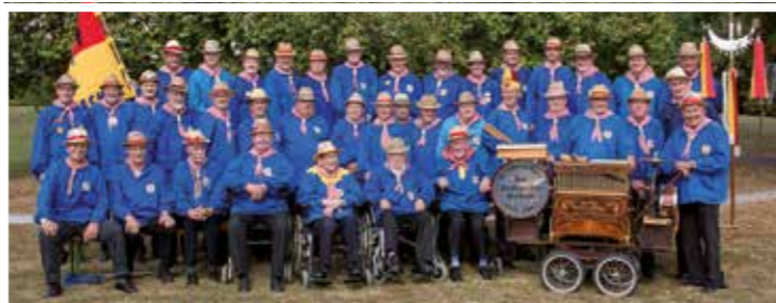
Die Beckumer Bauknechte sind jederzeit offen für neue Mitglieder, die aus der Püttstadt Beckum oder deren Nachbarschaft kommen.

wie die rund 130 Bänke an Wanderwegen rund um Beckum sind ein Verdienst der Bauknechte. Nicht nur auf dem Heischegang, sondern auch bei Stadtfesten oder Jahrmärkten in der Nähe sammeln die aktiven Mitglieder mit dem Drehorgelspiel Spenden für Dinge, die der Allgemeinheit zu Gute kommen. (me)