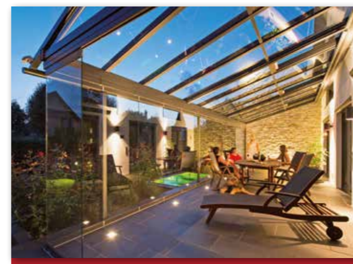
Ein Glashaus eröffnet weite Blicke ins Grüne - und bietet Schutz bei jedem Wetter.

Im gläsernen Anbau unabhängig vom Wetter entspannen