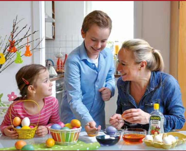
Ostereierfärben, ein alter Brauch, an dem Große und Kleine auch heute noch Vergnügen haben.

Ostern ist eines der höchsten christlichen Feste und zugleich eine fröhliche Begrüßung des Frühlings. Es gibt zahlreiche zum Teil jahrhundertealte Osterbräuche. Einer der beliebtesten ist das Ostereierfärben. Eier in kleine bunte Kunstwerke zu ver-