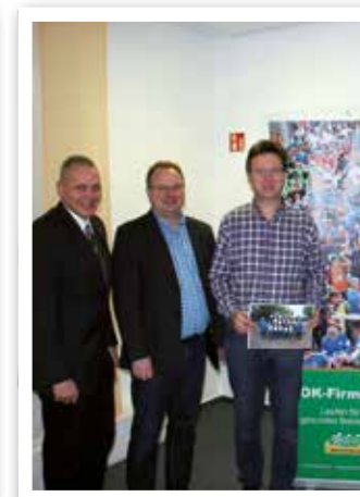
8. AOK-Firmenlauf Seite 20