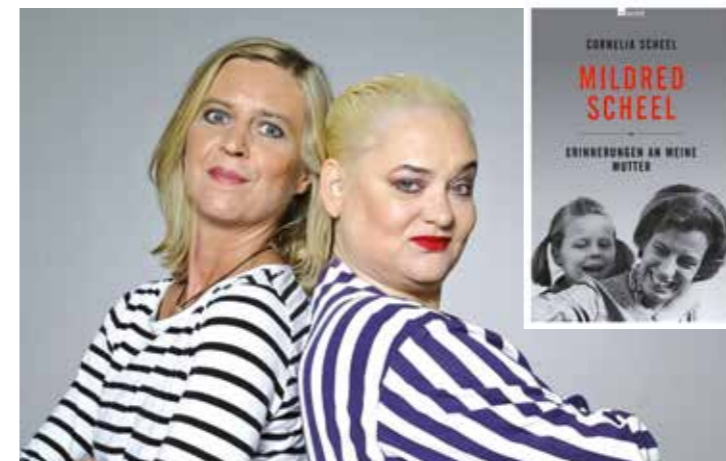
Cornelia Scheel und Hella von Sinnen sind zu Gast im Beckumer Stadttheater (v.l.)

Am Dienstag, 4. April, um 20 Uhr sind Hella von Sinnen und Cornelia Scheel gemeinsam auf der Bühne des Beckumer Stadttheaters zu sehen. Hella von Sinnen liest aus dem Buch „Mildred Scheel – Erinnerungen an meine Mutter“, das Cornelia Scheel im vergangenen Jahr aus Anlass des 30. Todestages ihrer Mutter veröffentlicht hat. Im Anschluss an die Lesung steht Cornelia Scheel für Fragen zur Verfügung.