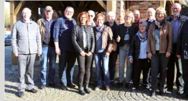
Das ist nur eine kleine Abordnung aus Vorhelm, die sich zum Prozessauftakt auf den Weg nach Münster gemacht hatte, andere waren bereits mit ihren Pkw unterwegs zum Landgericht.

PS: Wie kurz vor Redaktionsschluss zu erfahren war, findet die außerordentliche Mitgliederversammlung des Heimatvereins am Dienstag, 11. April, um 20 Uhr im Hotel-Restaurant Witte statt.