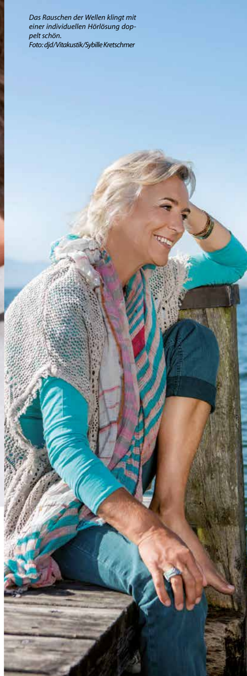
Das Rauschen der Wellen klingt mit einer individuellen Hörlösung doppelt schön.