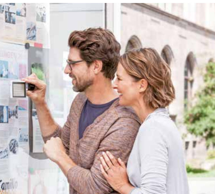
Ob Fahrpläne, Preisschilder oder Informationstafeln - mit einer digitalen Lupe werden sie für Sehbehinderte wieder lesbar.

Bahnhofstr. 1 · 59269 Neubeckum · Tel.: 025 25 - 950 370