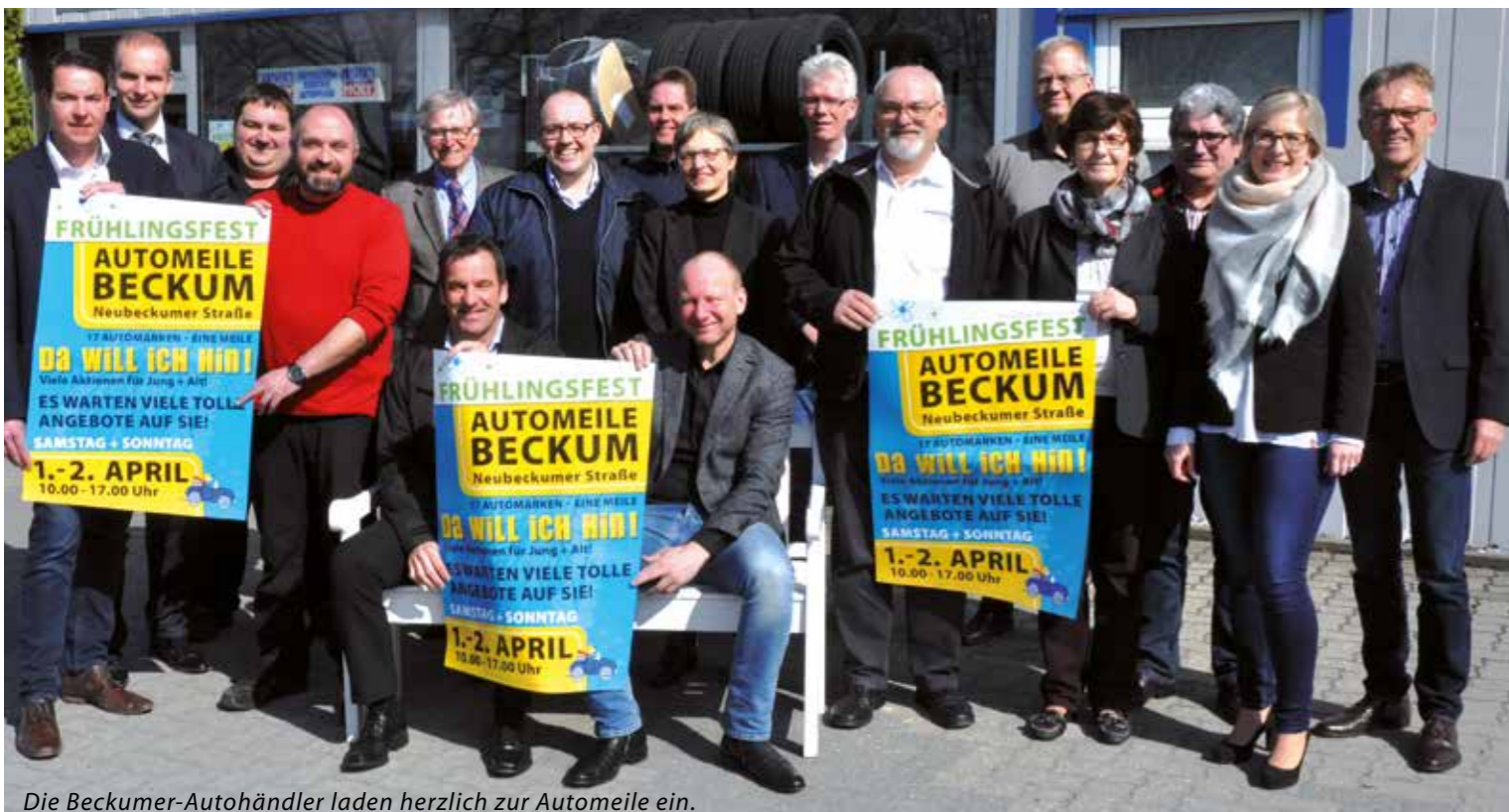
Die Beckumer-Autohändler laden herzlich zur Automeile ein.