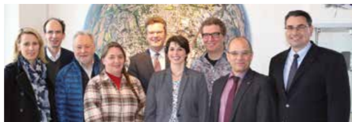
Mit rund 10 000 Besuchern rechnen die Veranstalter des Silbermond-Auftritts am 4. April. Die Vorbereitungen laufen auf Hochtouren.

Die Konzertgäste können sich die Wartezeit am Bierstand oder an der Cocktailbar verkürzen oder sich nach dem Auftritt dort mit Freunden treffen. ka