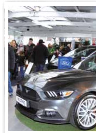
Automeile in Beckum Seite 5

Informationen und Angebote am 1. und 2. April