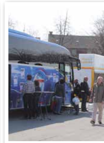
7. Neue Ahlener Woche Seite 10

Informationen und Angebote am 1. und 2. April