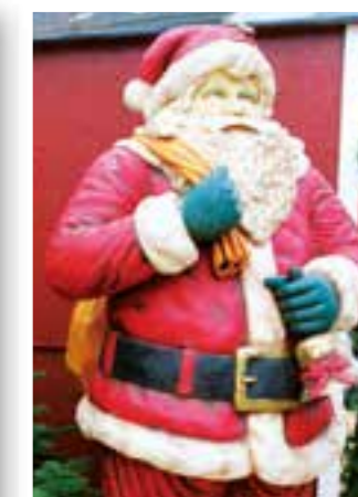
Seite 27 Weihnachtsmarkt Beleck