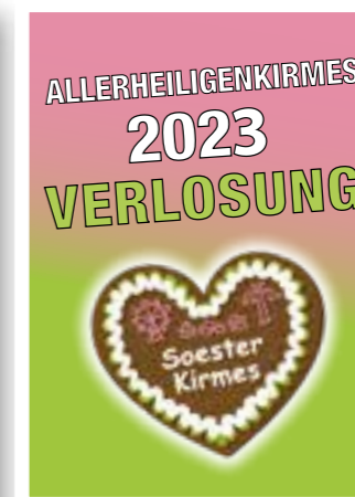
Seite 14 Kirmesverlosung