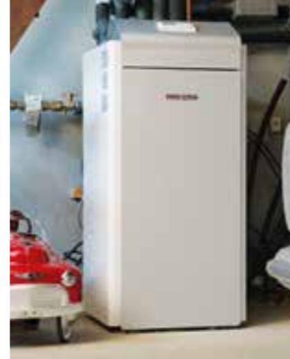
Wärmepumpe in einem Altbau integriert.

Wer eine Gas- oder Ölheizung inklusive Fußbodenheizung be-