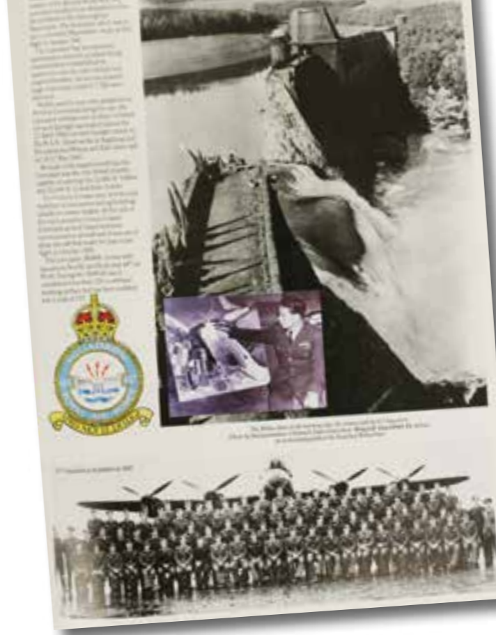
Programmheft Royal Air Force Museum. Aus deutscher Sicht makaber: Das Wappen der Einheit zeigt die zerstörte Möhnetalsperre mit dem Spruch „Après moi, le déluge“ (dt.: „Nach mir die Sintflut“).

Im Ausstellungszeitraum werden außerdem zwei achtminütige Filme gezeigt. Der erste Film entstand am 18. Mai 1943, also einem Tag nach dem Dambruch. Er stellt ihn ein Mitarbeiter der Stadt Bochum, der damit beauftragt wurde,