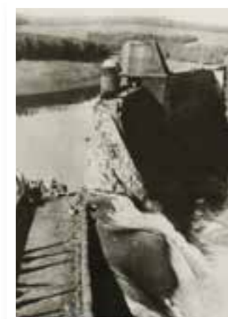
Seite 4 80 Jahre Möhnekatastrophe