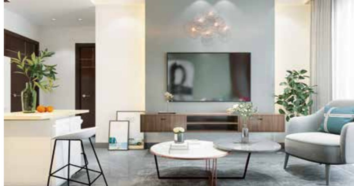
Beim Erwerb einer Eigentumswohnung im Neubau lassen sich Baumängel durch eine baubegleitende Qualitätskontrolle oftmals vermeiden.

den kommenden Jahren bestehen bleiben – allerdings nicht so ausgedehnt. In diesem Jahr haben Steuerpflichtige bis zum 30. September 2023 Zeit, die Abgabefrist ist jedoch erst der 2. Oktober. Grund: Der 30. September ist ein Samstag. Wer einen Steuerbe-