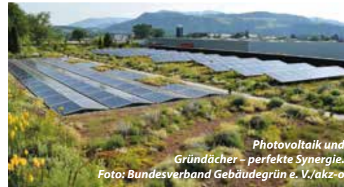
Photovoltaik und Gründächer – perfekte Synergie.

Auch ganze Holzhäuser leisten einen aktiven Beitrag zum Klimaschutz. Bei manchen Fertighausherstellern sorgt eine ökologische Gebäudehülle aus Holz für einen hervorragenden Wärme-, Kälte- und Schallschutz und legt damit die Basis für einen niedrigen Energieverbrauch. Viele sind standardmäßig mit einer Photovoltaikanlage mit Speichersystem sowie mit Frischluft-Wärmetechnik und einer smarten Haussteuerung ausgestat-