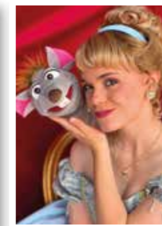
Seite 24 Möhnesee Festival