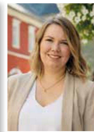
Seite 22 Innenstadtmanagerin Soest