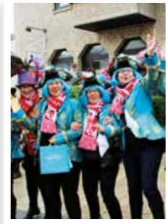
Seite 22 Karneval in Körbecke