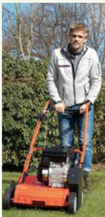
Der Service im Fachhandel macht Gartengeräte fit für das nächste Gartenjahr.

Besondere Vorsicht ist beim Umgang mit Elektrizität gebo-