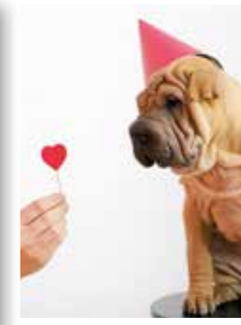
Seite 18 Valentinstag