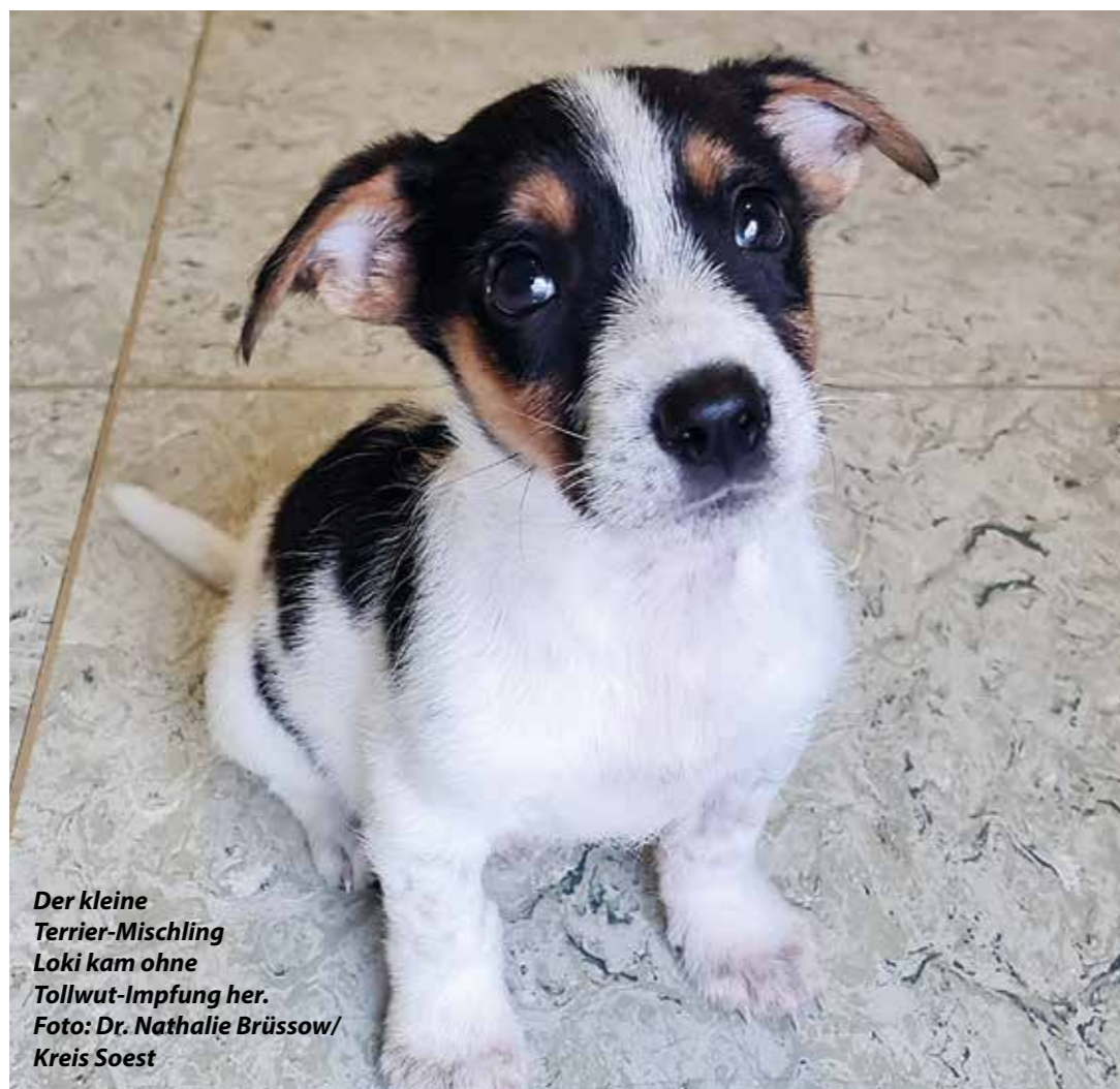
Der kleine Terrier-Mischling Loki kam ohne Tollwut-Impfung her.

Doch nicht nur der finanzielle Aspekt spielt bei der Anschaffung eines Hundes eine große Rolle. Künftige Halter:innen sollten sich der großen und langwierigen Verantwortung, die solch ein Tier mit sich bringt, bewusst sein. Besonnene Menschen, die sich einen Hund zulegen möchten, setzen sich intensiv damit auseinander, ob sie die Voraussetzungen überhaupt erfüllen und sich über eine lange Zeit an ein Haustier binden möchten. Denn der gut gefüllte Fressnapf ist die eine, aber genügend Auslauf und ein zur Rasse passender, abwechslungsreicher Alltag sind die zweite Seite der Medaille. Auch ein Hund hat seine in-