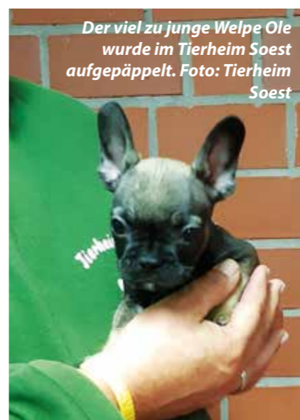
Der viel zu junge Welpe Ole wurde im Tierheim Soest aufgepäppelt.

sollte man doch ein Happy End für die Tiere erwarten, oder?