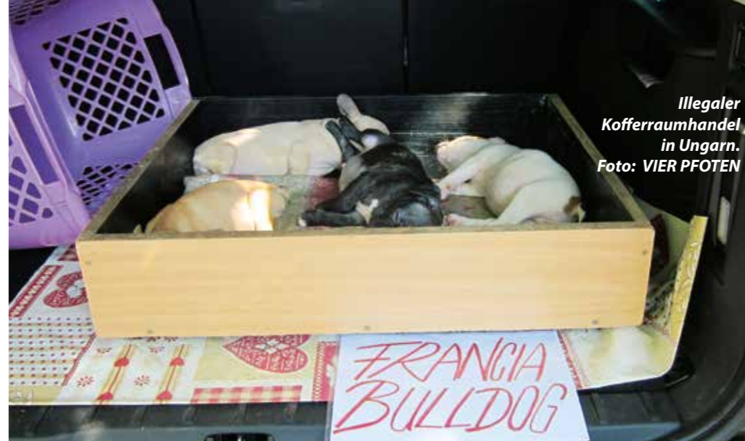
Illegaler Kofferraumhandel in Ungarn.