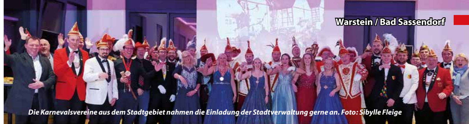
Die Karnevalsvereine aus dem Stadtgebiet nahmen die Einladung der Stadtverwaltung gerne an.

Der repräsentative Kalender im Format DIN A3 wurde hochwertig auf schwerem Kunstdruckkarton gedruckt. Die Zeichnungen befinden sich alle im Besitz des Museums Wilhelm Morgner und können dort teilweise in der Dauerausstellung betrachtet werden. Der Kalender wurde vom Soester Designstudio „dreibusch: design“ gestaltet. 50 Prozent des Kaufpreises in Höhe von 20 Euro kommt dem Förderverein und