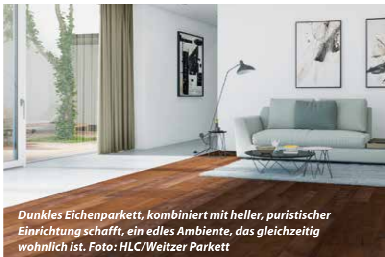
Dunkles Eichenparkett, kombiniert mit heller, puristischer Einrichtung schafft, ein edles Ambiente, das gleichzeitig wohnlich ist.

So entscheiden sich immer mehr Häuslebauer für ein Fertighaus aus Holz. Der nachwachsende Rohstoff bindet CO2 und gibt Sauerstoff ab, wodurch das Bauen mit Holz einen aktiven Beitrag zum Klimaschutz leistet. Eine ökologische Gebäudehülle aus Holz sorgt für einen hervorragenden Wärme-, Kälte- und Schallschutz und legt damit die Ba-