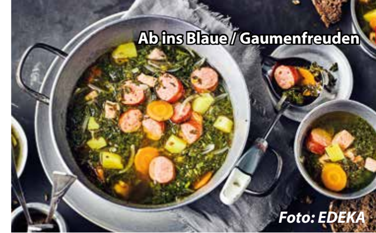
Ab ins Blaue / Gaumenfreuden