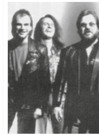
Seite 4 30 Jahre Stadthalle Soest