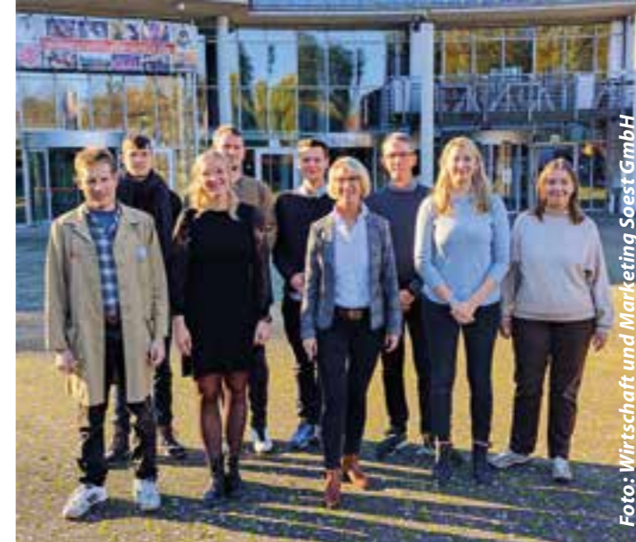
Das aktuelle Team der Stadthalle Soest.

Trotz des Gegenwindes baute man die Halle inklusive teurer Bühnentechnik. Nach 907 Tagen wurde am 11. November 1991 die Eröffnung gefeiert. Eingeweiht wurde die Bühne vom Detmolder Kammerorchester mit einem klassischen Konzert. Nur fünf Tage später, am 16. November, bewies die zunächst so ungeliebte Technik