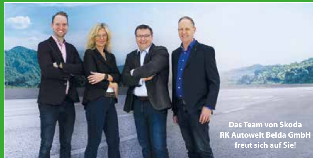
Das Team von Škoda RK Autowelt Belda GmbH freut sich auf Sie!

tails, die jeden Fahrer in Verzückung bringen, sind 13 in der Neuaufgabe brandneu, z.B. die umklappbare Beifahrersitzlehne und Multifunktions tasche unter der Gepäckraumabdeckung, oder ein USB-C-Anschluss am Innenspiegel (ideal für eine Dashcam) sowie Smartphone-Taschen für Fondpassagiere. Karten- und Stifthalter im Ablagefach vor dem Schalthebel hat es zuvor noch bei keinem Škoda gegeben, ebenso ein klappbares flexibles Ablagefach im Kofferraum. Bei so vielen tollen Möglichkeiten bleibt nur eins: eine Probefahrt! Vereinbaren Sie am besten gleich einen Termin und überzeugen sich vom neuen Fabia.