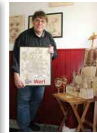
Seite 44 Kreative Holzkunst