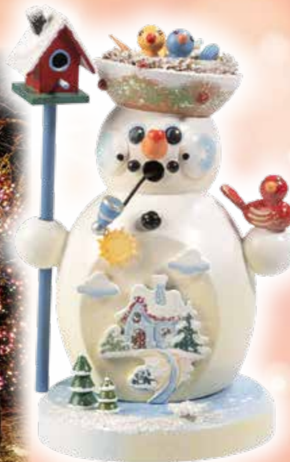
Im Winter gehört Räucherware doch einfach dazu! Wie wäre es mit einem schnuckeligen Räucher-Schneemann, wie diesem Exemplar von Käthe Wohlfahrt