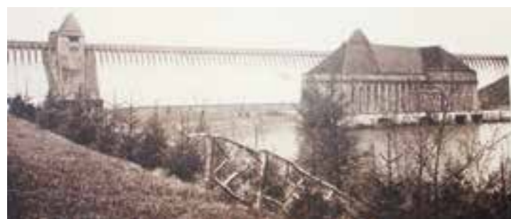
Postkarte vom Möhnesee mit dem alten Kraftwerk, das man auch besichtigen konnte.

Wer zum Beispiel noch ein Weihnachtsgeschenk für eine:n Lokalpatriot:in sucht, sollte einmal unter www.heimat-art.de stöbern.