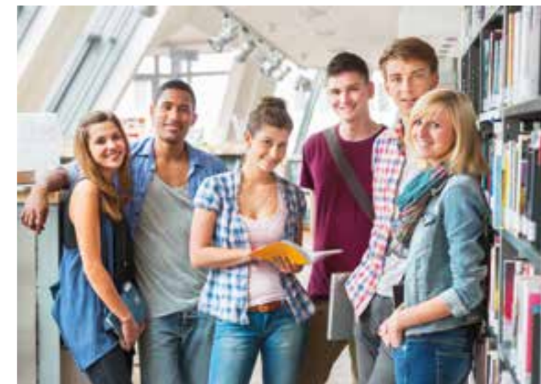
Teamwork ist Trumpf bei den Berufsgenossenschaften.

Einsatzgebiete nach dem dualen Studium können in den Bereichen Rehabilitation und Entschädigung, Regress, Mitglieder und Beitrag oder in der IT-Abteilung liegen. Attraktive Perspektiven bietet auch die Ausbildung zum/zur Sozialversicherungsfachangestellten. Die BG ETEM ist nur ein Beispiel für insgesamt >>>