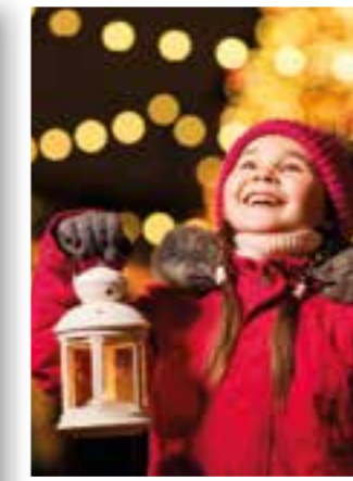
Seite 26 Veranstaltungs-Highlights