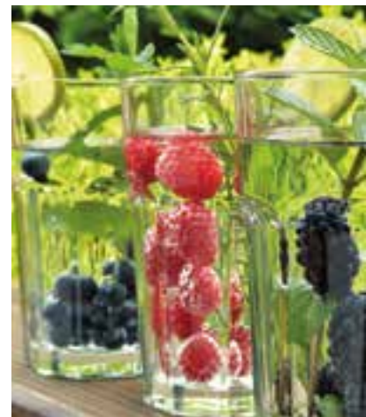
Mit Beeren und Kräutern wie Minze oder Rosmarin lässt sich Wasser geschmacklich aufpeppen.