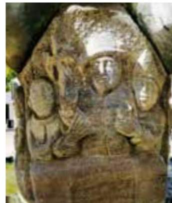
Dienstleistung und Handel

Im Zuge der Erneuerung des Platzes in den letzten Jahren wurde er von der Platzmitte auf eine erhöhte Fläche umgesetzt und steht somit jetzt näher an den Geschäften.