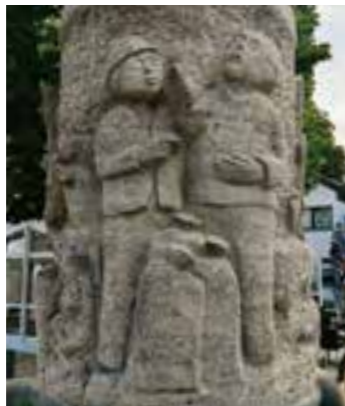
Menschen aus der Landwirtschaft mit Korn- oder Mehlsäcken