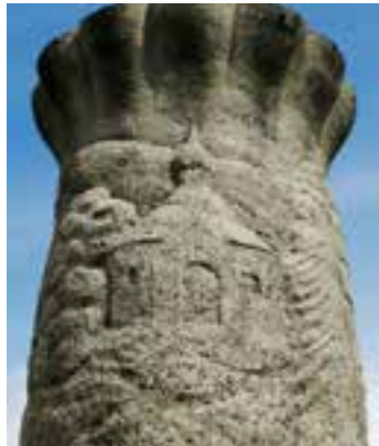
Die Drüggelter Kapelle