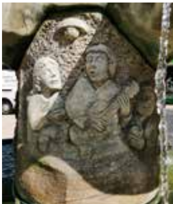
Wein und Gesang

Auf der Mittelsäule wurden in Relieffarbe folgende Motive verewigt: der Möhnesee, die Tätigkeiten der Menschen in der Landwirtschaft, dem Handwerk und der Dienstleistung sowie die Freizeit und Geselligkeit.