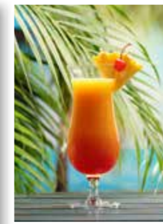
Seite 26 Genießen Sie den Sommer