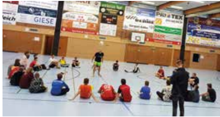
Im Rahmen der Nachtfrequenz bringt ein Trainer Jugendlichen ab 14 Jahren bei, wie sie ihre Technik verbessern können. Anschließend findet ein kleines Turnier statt.

Für die achten und neunten Jahrgangsstufen der weiterführenden Schulen im Stadtgebiet Warstein wird im Zeitraum vom 6. bis 9. September das Theaterstück „Alkohölle“ aufgeführt. Außerdem können sie einen „Alkohol-Parcours“ durchlaufen. Dabei