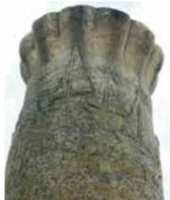
Segelschiffe auf der Möhne

Kennen Sie das auch? Sie laufen tagtäglich an einer Skulptur, einem Bauwerk oder einem Brunnen vorbei, ohne richtig hinzuschauen? Uns ging es so mit dem Brunnen auf dem Pankratiusplatz in Körbecke. Nun haben wir hingeschaut und möchten Ihnen diesen Blickfang etwas genauer vorstellen.