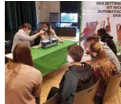
Die achten und neunten Jahrgangsstufen erhalten Informationen zu einem verantwortungsvollen Umgang mit Alkohol bzw. Suchtmitteln

Der Bilsteintal e.V. veranstaltet am 15. August wieder den Abenteuerstag im Bilsteintal. Das Kinder- und Jugendbüro stellt erneut die Fotobox bereit, dort kann man sich mit Freunden oder Familie fotografieren lassen. Geplant ist außerdem wieder die Tee-Disco Ende Oktober.