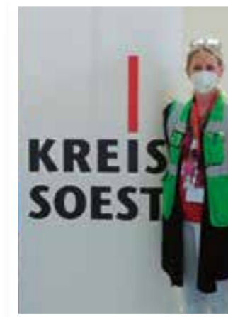
Seite 4 Impfen im Kreis Soest