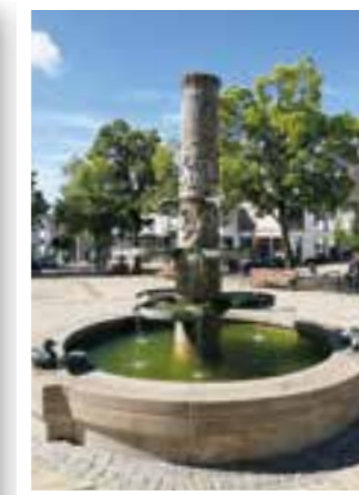
Seite 40 Brunnen Körbecke