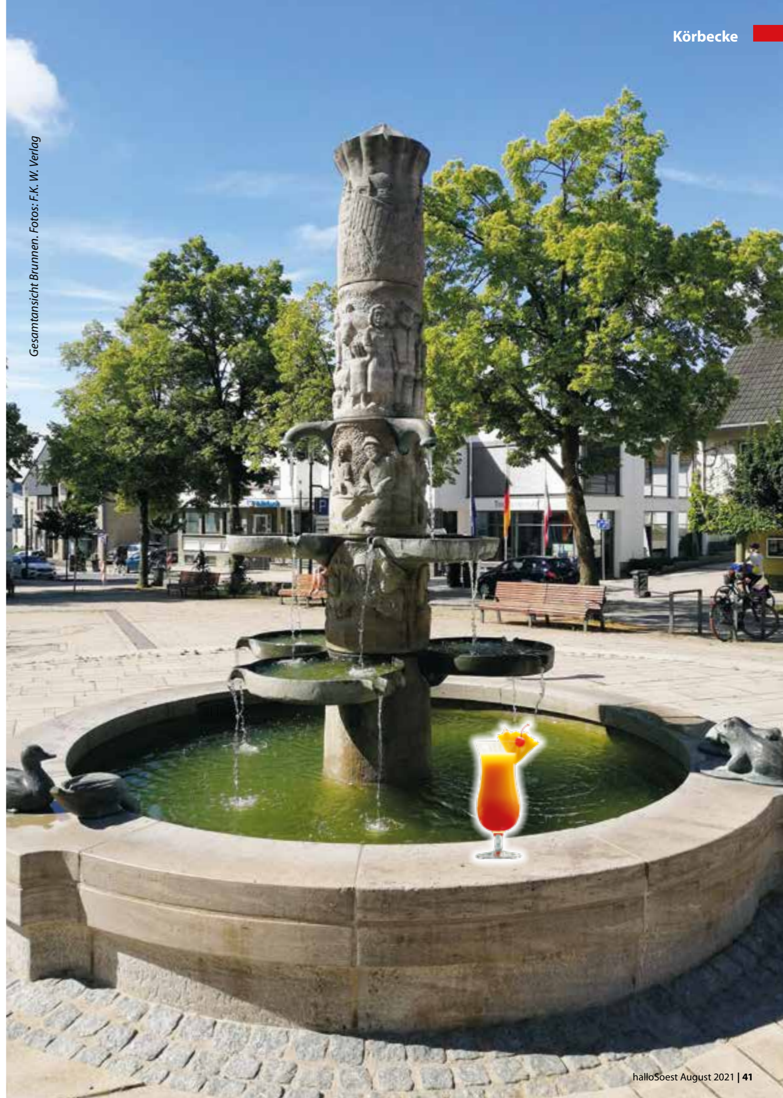
Gesamtansicht Brunnen.