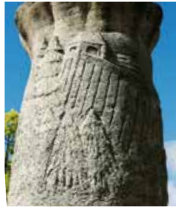
Der Arnberger Wald und die Stauauer

Kennen Sie das auch? Sie laufen tagtäglich an einer Skulptur, einem Bauwerk oder einem Brunnen vorbei, ohne richtig hinzuschauen? Uns ging es so mit dem Brunnen auf dem Pankratiusplatz in Körbecke. Nun haben wir hingeschaut und möchten Ihnen diesen Blickfang etwas genauer vorstellen.