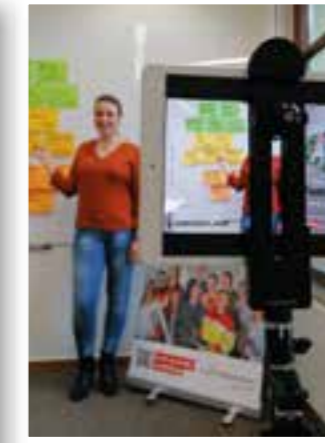
Seite 19 Digitale Ausbildungsmesse Ense