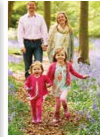
Seite 32 Ostern mit der Familie