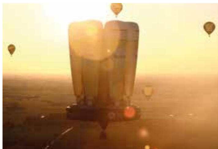
Auf dieses bunte Bild können sich Besucher der Jubiläums-WIM im September 2022 freuen.

Die WIM hat in der Vergangenheit stets Tausende Ballöner und Heißluftballonbegeisterte im Spätsommer nach Warstein gelockt. Gäste aus aller Welt kamen für die Tage in die Stadt, um das Spektakel zu verfolgen und während des Ballonfestivals eine unbeschwerte Zeit zu genießen.