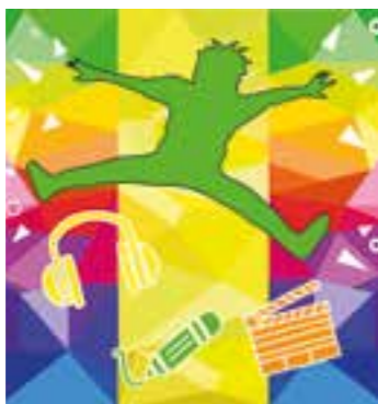
Kreativ werden und gewinnen. Grafik: Anni Sauerland

Momentan ist vieles im Umbruch und Prognosen für die Zukunft fallen schwerer denn je. Genau aus diesem Grund haben sich das Medienzentrum, die Bildungsregion und das Schulamt für den Kreis Soest für ihren neuen Kreativwettbewerb das Thema „Zukunft“ ausgesucht.