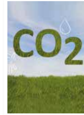
Seite 4 Smart City Soest 2030