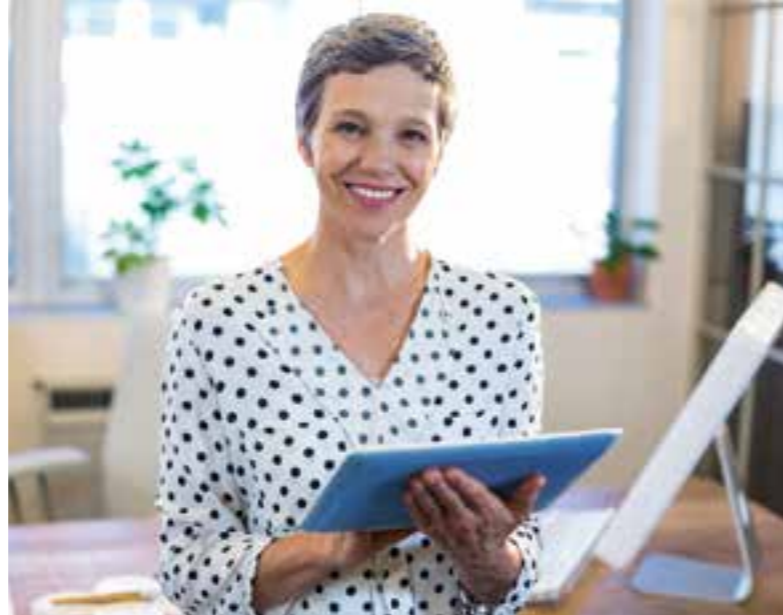
Mit einem guten Bauchgefühl macht auch der Arbeitsalltag wieder Freude.

Die Symptome können ganz plötzlich, also akut, oder über einen längeren Zeitraum und immer wie-