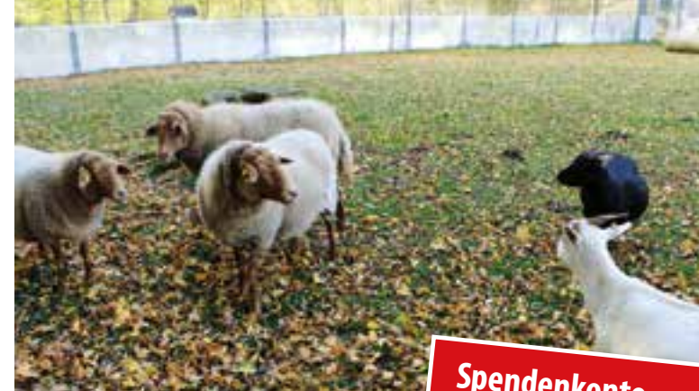
Zum „Personal“ des Soester Tierheims gehören auch insgesamt fünf Schafe und zwei Ziegen, die für „Rasen- und Landschaftspflege“ zuständig sind. Alle sind ebenfalls Fundtiere.

Für sie ist es einfach nicht nachvollziehbar wie man so leben und mit Tieren so umgehen kann. Besonders, weil die meisten sehr nette und freundlich Wesen sind, die dann durch so eine Haltung zu verhaltensauffälligen und kranken Tieren gemacht werden. Ein weiterer trauriger Fall war eine Kat-