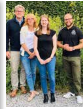
Seite 26 Wohnprojekt für Jung und Alt