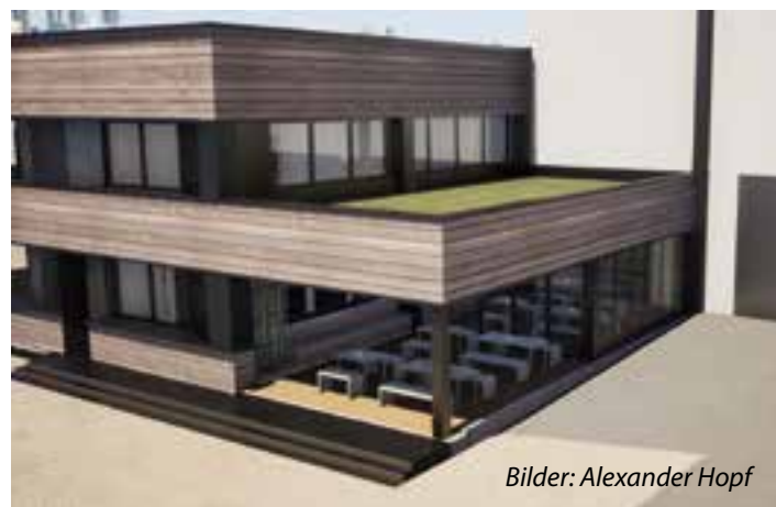
Bilder: Alexander Hopf

In knapp zwei Jahren veränderte Architekt Alexander Hopf gemeinsam mit vielen Experten aus Bau und Handwerk das in die Jahre gekommene, ehemalige „Massong“-Verwaltungsgebäude in einen modernen, nachhaltigen Hingucker am Overweg im Gewerbegebiet Soest Süd-Ost. „Wir sind in den letzten Zügen“, so der Architekt und Bauleiter.