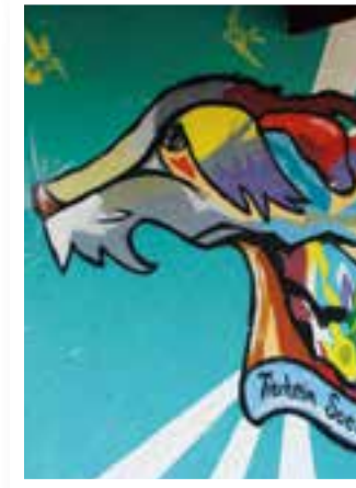
Seite 4 Tierschutz in der Soester Börde