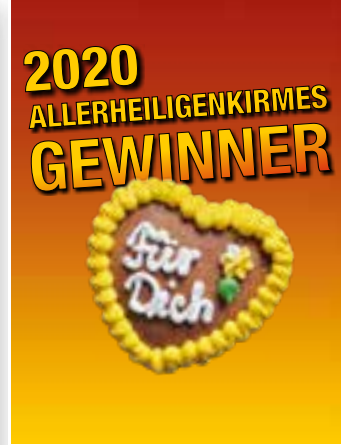
Seite 38 Kirmesverlosung-Gewinner