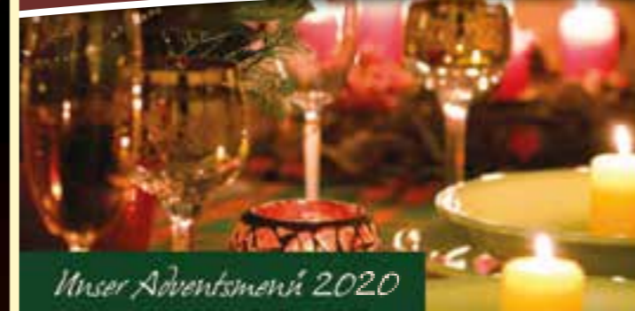
Unser Adventsmenü 2020