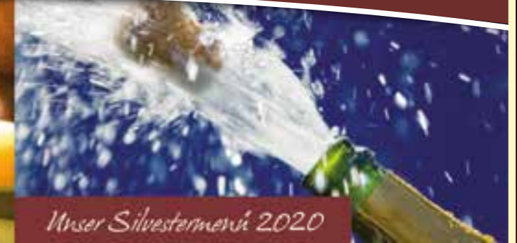
Unser Silvestermenü 2020

Unser besonderes Menü-Angebot in der Adventszeit.