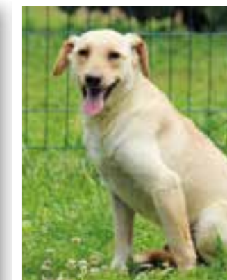
Seite 41 Tier des Monats