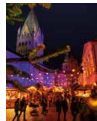
Seite 4 Soll der Weihnachtsmarkt stattfinden?