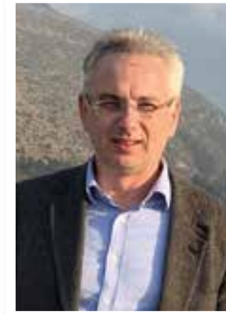
Seite 4 Azubis aus dem Ausland