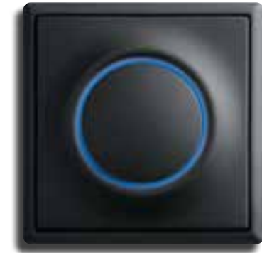
Egal, ob Steckdose mit Auswurf-Funktion, oder Lichtschalter mit integriertem Orientierungslicht: Im Bereich Elektrik gibt es viele Möglichkeiten.

billig. Aber es kann bei medizinischer Notwendigkeit verordnet werden, sodass Sie Zuschüsse von Ihrer Krankenkasse erhalten können. Voraussetzungen für Kostenübernahme sind zum Beispiel, wenn Sie aufgrund körperlicher Einschränkungen keinen Rollator oder handbetriebene Rollstühle mehr bedienen können. Das Seniorenmobil mildert die Auswirkungen einer Behinderung. Natürlich sollten Sie körperlich und geistig ein Elektromobil bedienen können. Ob Ihnen Ihr Arzt ein solches Gefährt verordnen kann, klären Sie am besten im Vorfeld mit Ihrem Mediziner.