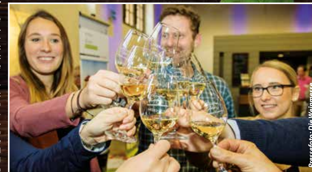
Pressfoto: Die Weinmesse

Zahlreiche Aussteller präsentieren eine große Vielfalt von Weinen und Winzersekten aus den Anbaugebieten Mosel, Nahe, Pfalz und Rheinhessen. Dazu erhalten die Besucher an jedem Messestand ausführliche Informationen zu den Stars und Klassikern der „Sovino“ und können sie selbstverständlich