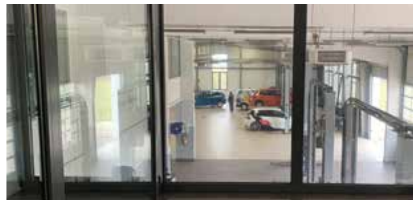
Die VW-Vertragswerkstatt in Prizren.

Karosseriebauer lernen, einen Beruf, der in Deutschland immer seltener wird.