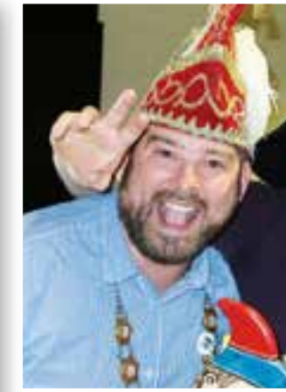
Seite 29 Karnevalsprinz Körbecke