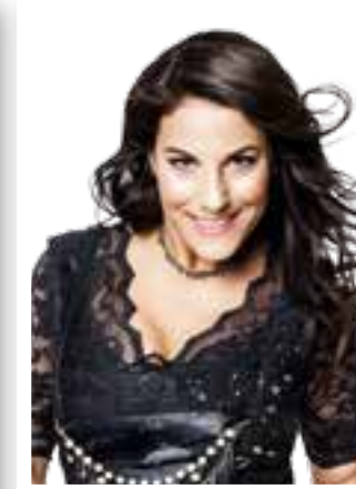
Seite 39 Karneval Lippetal