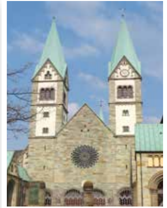
Seite 22 Wir sind Werl: Stadtfest zum Jubiläum