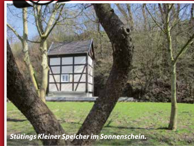
Stüttings Kleiner Speicher im Sonnenschein.

Schicken Sie uns auch Ihr Lieblingsfoto: info@fkwwerlag.com