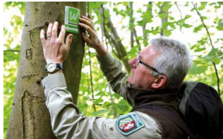
Ranger sind fester Bestandteil der Sauerland Waldroute.

Einweihung beim Frühlingsfest am 13. Mai