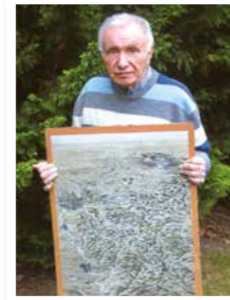
Seite 4 Als vor 75 Jahren der Möhne-Damm brach