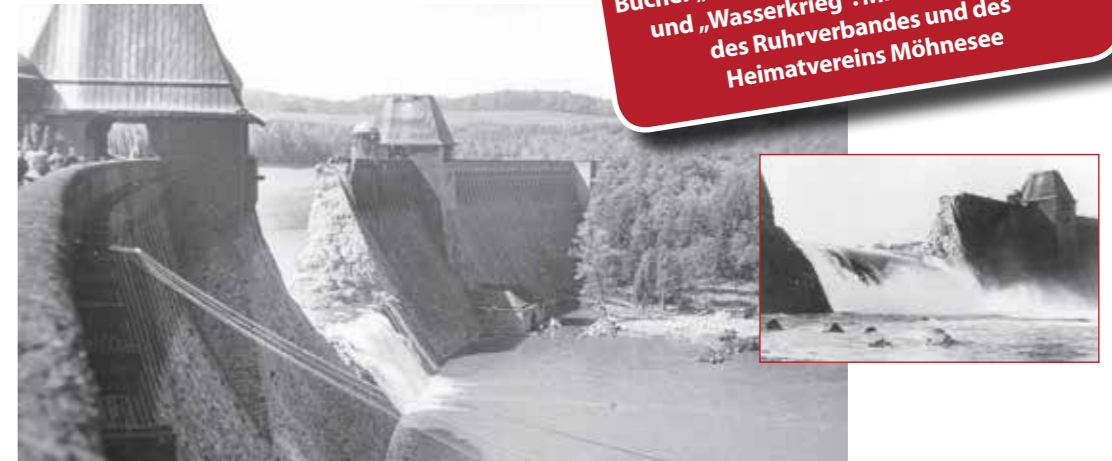
Eine britische Bombe riss in der Nacht vom 16. auf den 17. Mai 1943 eine Lücke in die Staumauer der Möhnetalsperre. Das ausströmende Wasser raste in einer Flutwelle durch das flussabwärts gelegene Möhne- und das Ruhrtal und richtete verheerende Schäden an.

In einer Dokumentation des Ruhrverbandes werden Details genannt: „Die Schäden am Sorpedamm waren erheblich, der Damm brach aber nicht. Umso verheerender war der Angriff an der Möhne. In der Nacht wurde zuerst das Kraftwerk unterhalb der Staumauer getroffen, eine weitere Bombe zerstörte die Staumauer selbst. Eine gewaltige Flutwelle strömte aus der nahezu vollständig gefüllten Talsperre in Richtung Rheinmün-