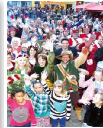
Seite 12 Ohne Motto, aber mit viel Schwung: Der Bördetag