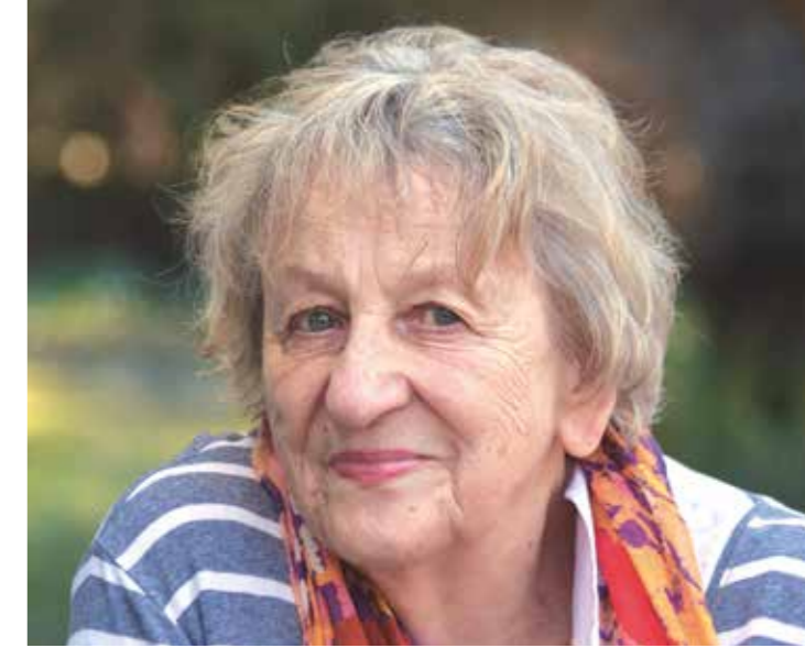
Ingrid Noll