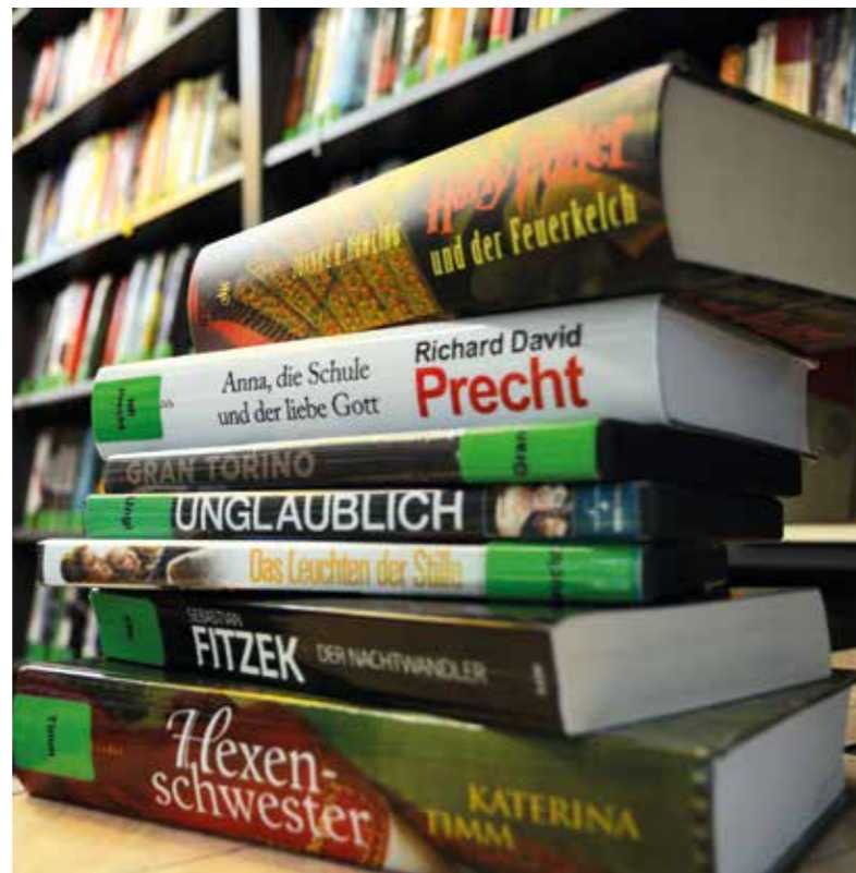
Der Bücherbus des Kreises Soest hat ausgedient: 53 Jahre lang brach der Bus durch die Dörfer des Kreises auf.