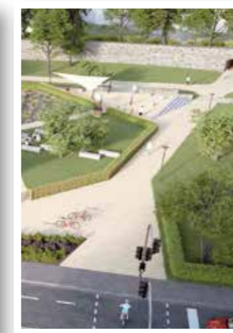
Seite 25 Kompromiss rettet Linden auf dem Wall