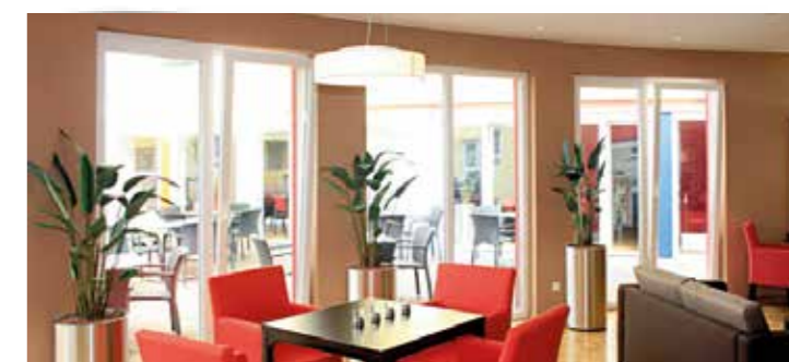
Clubraum zur Terrasse