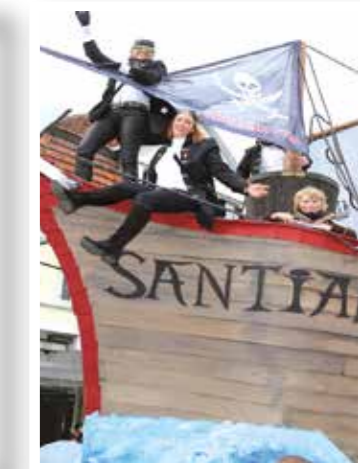
Seite 30 „Jecken first“ bei Karnevalsgesellschaft