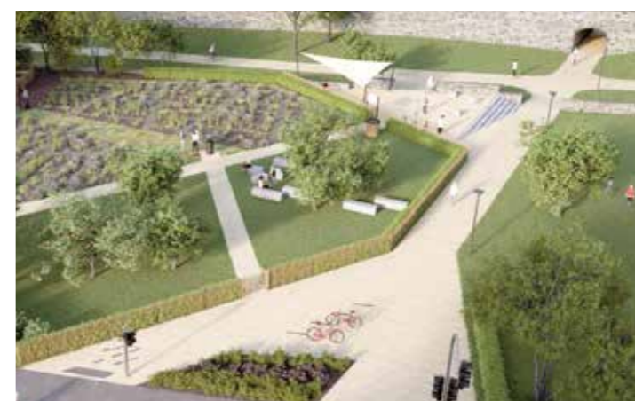
Visualisierung einer Variante des Wallaufgangs mit verlängerter Rampe am Ulrichertor. Visualisierung: Thorwald Hoffmann

Der Protest, der sich im Sommer in der Bürgerschaft formierte, hat aber für Bewegung gesorgt: Verabschiedet haben sich alle Beteiligten von der Qualitätsstufe „Barrierefrei“, kleine Mängel werden in Kauf genommen, um das größte Denkmal der Stadt auf Dauer zu erhalten und erlebbar zu machen: Lob gab es immer wieder für die Behinderten-Arbeitsgemeinschaft BAKS, die deutlich einlenkte und Kompromisse akzeptierte: Nicht mehr jeder Wall