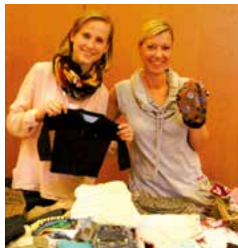
Shoppingspaß beim Schnäppchenmarkt in der Stadthalle Werl!

Der beliebte Spezialmarkt rund ums Baby und Kind startet im Februar in die neue Saison. Bereits am 18. Februar kommt der Kids-Markt von 11 bis 16 Uhr in die Stadthalle Werl.