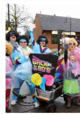
Seite 7 Dreigestirn braucht die Männer nicht