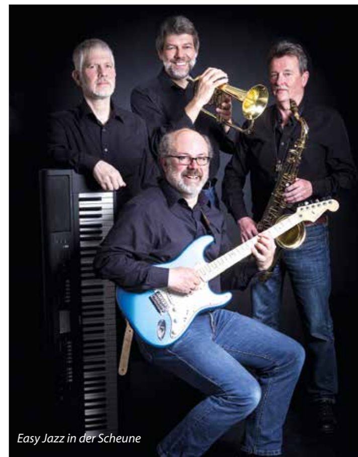
Easy Jazz in der Scheune

wie herzhaften Snacks und Kaltgetränken erfrischt und gestärkt werden.