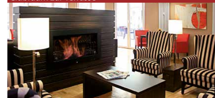
Bibliothek mit Kamin