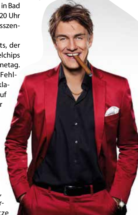
Matze Knop beim BVS Bad Sassendorf

Karten für die Show in Bad Sassendorf sind im Vorverkauf erhältlich. Einlass ist eine halbe Stunde vor Veranstaltungsbeginn.