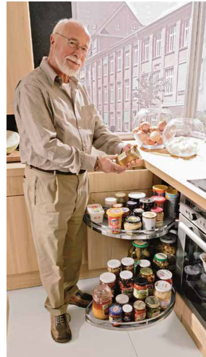
Kleiner Umbau - große Wirkung: Gerade in der Küche lohnt es sich, in praktische Details wie extragroße Auszüge für mehr Bequemlichkeit und Barrierefreiheit zu investieren.

am besten mit flexiblen Kopf- und Fußteilen, sorgt für nachhaltige Erleichterung im Alltag. Um den Ein- und Ausstieg zu erleichtern, kann der Tischler eine individuell angefertigte Erhöhung anfertigen. Im Kleiderschrank sind flexible Kleiderstangen, die sich mittels Garderobenlift herunterziehen lassen, eine kleine aber nachhaltig wirkende Verbesserung. Auch dieser Einbau wird vom Profi im Handumdrehen erledigt. Im Bad wiederum kommt es auf rutschhemmende Fliesen, einfach zugängliche Schränke sowie eine große, möglichst ebenerdige Dusche an.