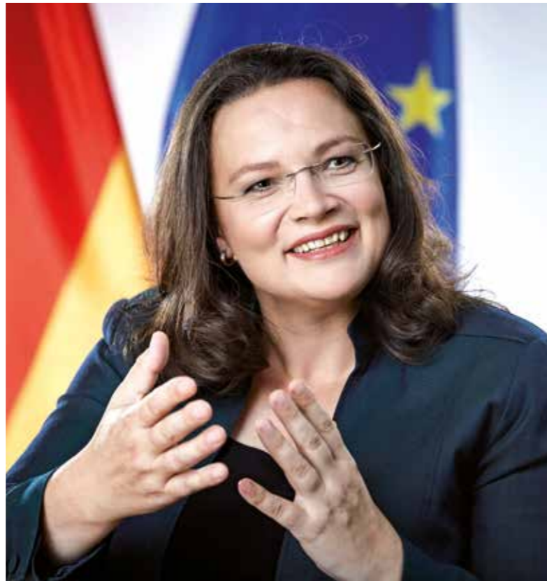
Bundesministerin Andrea Nahles.

Es ist daher ein wichtiges Signal für die Branche, dass die Pflegekommission wiederum ein einvernehmliches Ergebnis zur Anpassung der Pflegegemindestlöhne erzielt hat. Dafür möchte ich allen Beteiligten danken. Von diesem Mindestlohn werden sowohl Beschäftigte und Unternehmen als auch die Pflegebedürftigen profitieren. Gute Pflege soll auch angemessen entlohnt werden.“ In Einrichtungen, die unter den Pflegegemindestlohn fallen, arbeiten derzeit rund 900.000 Beschäftigte.