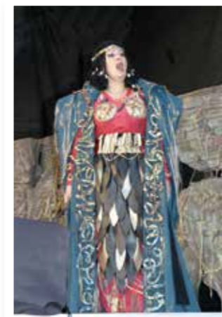
Werl Seite 4