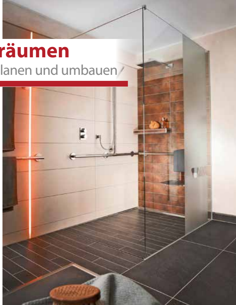
Eine bodengleiche Dusche ermöglicht nicht nur die komfortable Nutzung des Badezimmers, sondern lässt den Raum auch größer wirken.

Selbst kleine Dinge können im Alter zu schier unüberwindbaren Hürden werden. „Eine wichtige Voraussetzung für die Selbstständigkeit in jeder Lebenssituation sind Räume ohne Gefahrenquellen“, unterstreicht Wohnexperte Michael Ritz. Das reicht von einer hellen Beleuchtung mit Bewegungssensoren über einen sturz sicheren Eingang bis zu schwellenfreien Raumübergängen. Zudem kann die Einrichtung dem älteren Menschen zum Beispiel in der Küche mit praktischen Details buchstäblich entgegenkommen: Schränke mit breiten Auszügen können etwa das Bücken erleichtern. Praktisch sind möglichst kurze Wege vom Herd zum Platz, an dem die Mahlzeiten eingenommen werden. Wer in der Küche keinen Platz für einen separaten Esstisch hat, kann sich vom Holzfachbetrieb ein