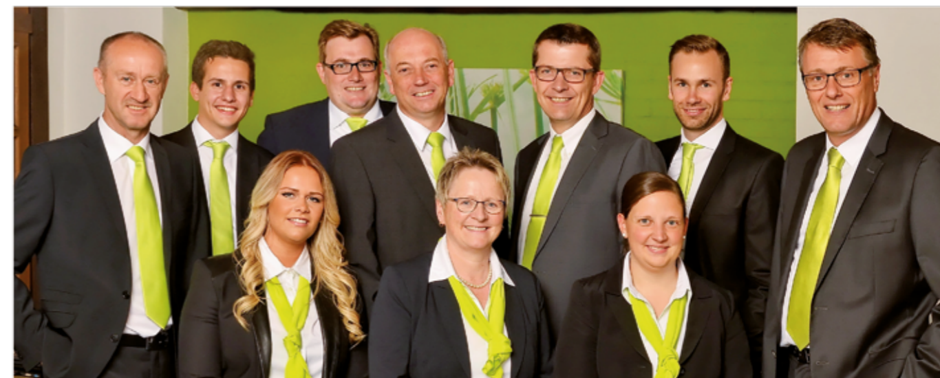
Das Team der LVM-Versicherungsagentur Nillies