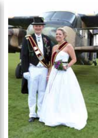
Soest Seite 12