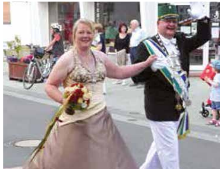
Die Rüthener Schützen suchen auch diesen Jahr wieder neue Regenten.

Rüthener Festtage findet statt vom 24. bis 26. Juni. Gäste erwünscht