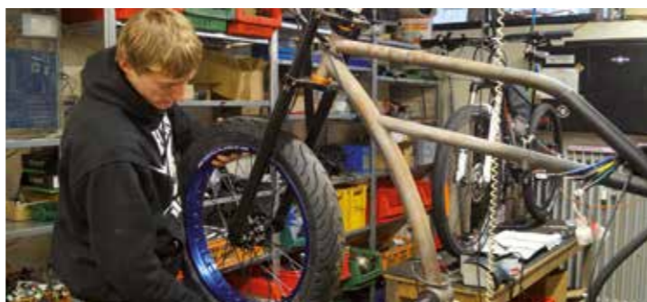
Electric Ride in Unna ist eine einzigARTige E-Bike Manufaktur.

Seit vier Jahren fertigt und „elektrisiert“ er seit dem in der Werkstatt E-Bikes und andere Gefährte mit Elektro-Antrieb