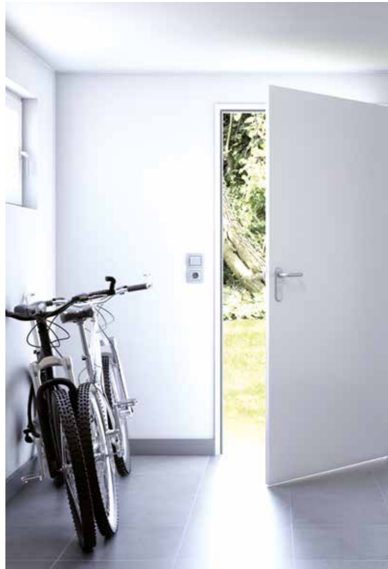
Den Nebeneingang nicht vergessen: Stahl-Sicherheitstüren erhöhen den Einbruchschutz für Keller oder Garage. Auch dort kann eine elektronische Sicherung erfolgen.