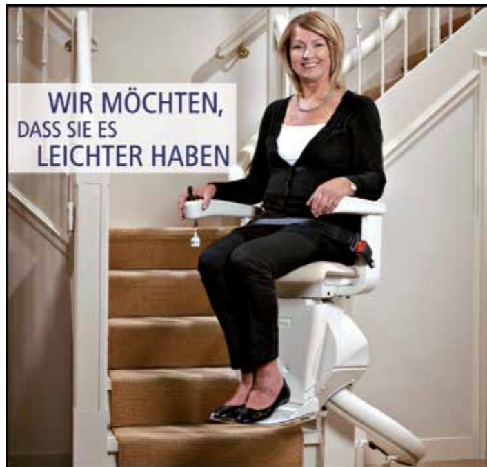
WIR MÖCHTEN, DASS SIE ES LEICHTER HABEN