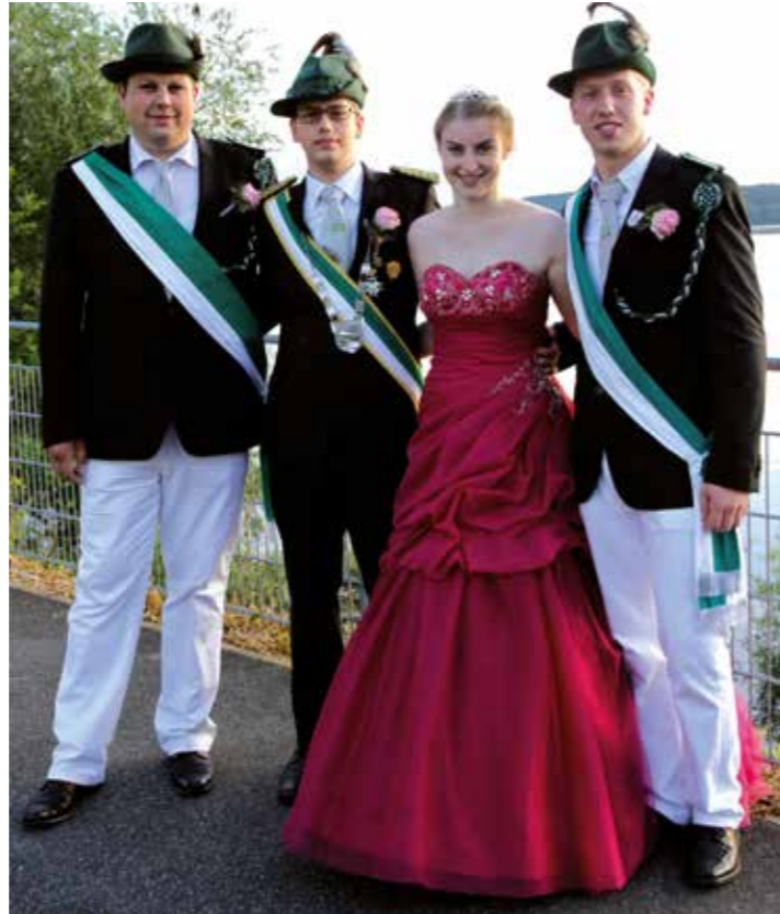
Nachfolge gesucht: Wer wird die St. Hubertus Schützenbruderschaft bald regieren.

Der Kindertanz ist um 18.30 Uhr; das große Fest um 20 Uhr.