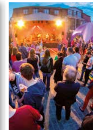
Werl Seite 30