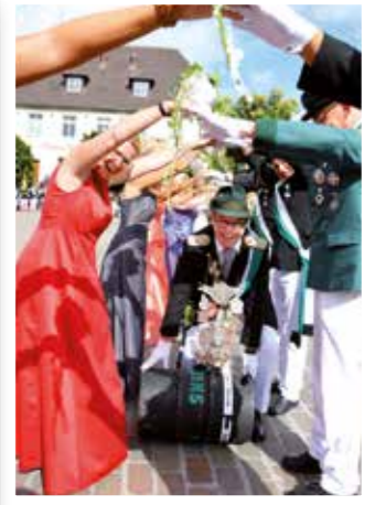
Werl Seite 30 Schützen rufen zum Fest