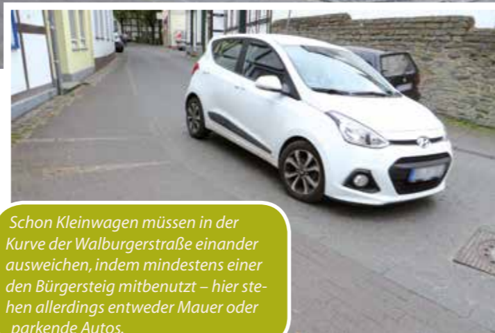
Schon Kleinwagen müssen in der Kurve der Walburgerstraße einander ausweichen, indem mindestens einer den Bürgersteig mitbenutzt – hier stehen allerdings entweder Mauer oder parkende Autos.

rund 118 Plätze erhalten. Presseferent Thorsten Bottin äußert sich zu der Parkplatzsituation folgendermaßen: „Mit der Neuordnung der Stellplatzsituation ist bereits begonnen worden. Das Angebot auf dem Schweinemarkt wurde reduziert, hier sind nur noch Anwohnerparkplätze vorhanden. Zusätzliche öffentliche Stellplätze nördlich des Bahnhofs sind ebenfalls geschaffen worden.“ Somit bleiben für die zukünftigen Kunden