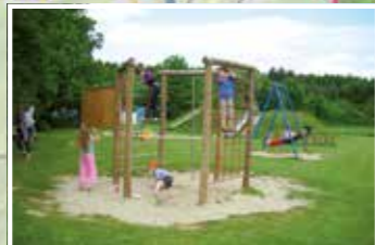
Familienausflug ins Heinrich-Lübke-Haus