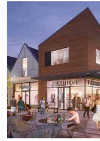
Werl Seite 4 Wie geht es weiter nach Outlet-Urteil?