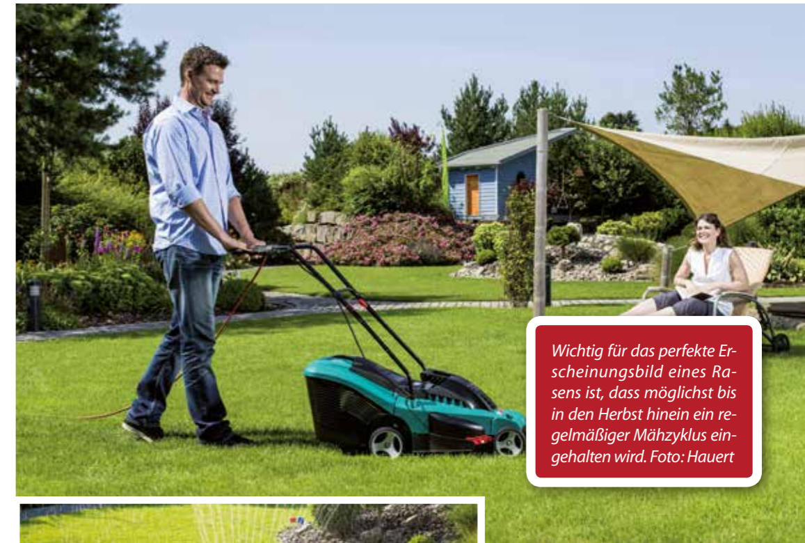
Wichtig für das perfekte Erscheinungsbild eines Rasens ist, dass möglichst bis in den Herbst hinein ein regelmäßiger Mähzyklus eingehalten wird.

Dreimal im Jahr sollte gedüngt werden. Denn nur in den seltensten Fällen verfügen Böden über einen Nährstoffvorrat, der eine ausreichende Versorgung des Rasens sicherstellt. Spezieller Rasendünger ersetzt die von den Pflanzen der Erde entzogenen Nährstoffe: Stickstoff, Kalium, Phosphor, aber auch Magnesium und Spurenelemente. Genauso wichtig wie die ausreichende Nährstoffgabe ist natürlich die Wasserversorgung des Rasens. Während der Sommermonate entspricht die natürliche Niederschlagsmenge nur selten dem tatsächlichen Bedarf. Während der Vegetationsperiode schwankt der tägliche Wasserbedarf je nach Temperatur und Verdunstungsrate zwischen ein und sieben Liter pro Quadratmeter. Grundsätzlich gilt: Lieber seltener und mit hohen Mengen als oft und mit geringen Wassergaben beregnen. So werden die Pflanzen dazu angeregt, ein tiefreichendes und kräftiges Wurzelsystem zu entwickeln. Wasser- und Nährstoffmangel sowie ein zu tiefer Rückschnitt sind die häufigsten Ursachen für das Ausbreiten von Unkräutern in der Rasenfläche. Sie sind meist um ein Vielfaches widerstandsfähiger als Rasengräser und auch auf nährstoffarmen und trockenen Böden überlebensfähig. Das Gießen gehört zu den wichtigsten Aufgaben eines Gartenbesitzers.