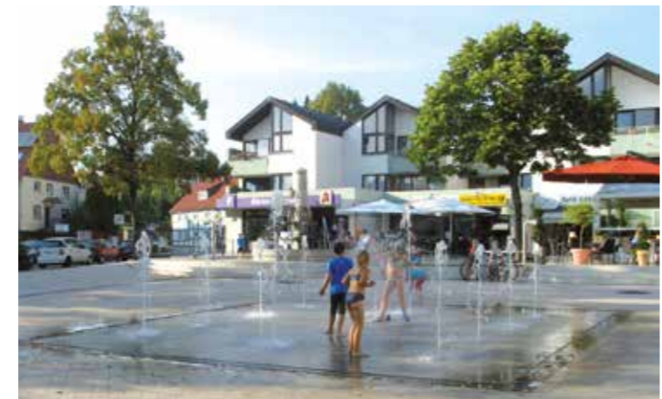
Genießen Sie den „FeierAbend in Körbecke“ und flanieren Sie durch die netten Geschäfte der schönen Ortsmitte.

Aber damit nicht genug: Inspiriert von der Veranstaltungsreihe „FeierAbend am See“ fällt im August der Startschuss für das regelmäßige Shopping-Event „FeierAbend in Körbecke“. An jedem ersten Donnerstag im Monat werden die Körbecker Einzelhändler ihre Geschäfte bis 20 Uhr öffnen. Außerdem halten sie jede Menge Aktionen und kleine Überraschungen für ihre Kunden bereit. Es lohnt sich also, auch in den kommenden Monaten nach der Arbeit die Freizeit in Körbecke nicht nur am See zu genießen.