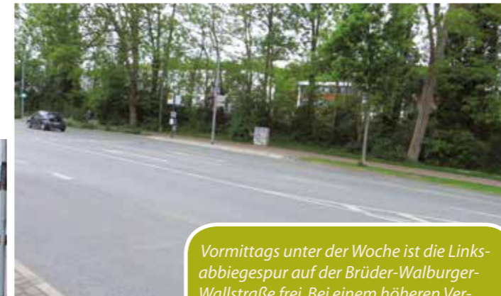
Vormittags unter der Woche ist die Linksabbiegespur auf der Brüder-Walburger-Wallstraße frei. Bei einem höheren Verkehrsaufkommen zu Stoßzeiten werden jedoch beide Spuren der Straße blockiert.

Letztlich kann nur die Zeit zeigen, wie die Verkehrsführung in der Soester Innenstadt funktionieren wird. Da aber zu Stoßzeiten wie werktags gegen 15 Uhr oder samstags jetzt schon ein hohes Verkaufsaufkommen zu verzeichnen ist, droht ab Ende des Jahres ein Verkehrschaos. (manu)