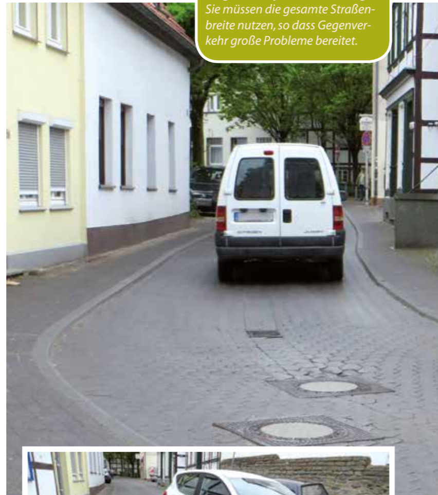
Lieferwagen befahren die Walburgerstraße jetzt schon häufig. Sie müssen die gesamte Straßenbreite nutzen, so dass Gegenverkehr große Probleme bereitet.