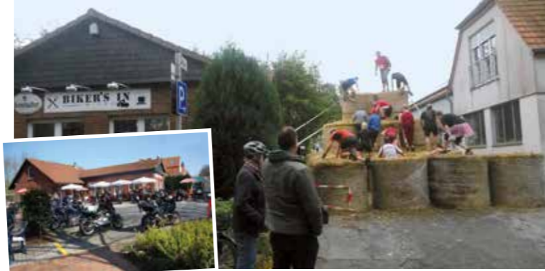
Beim „Biker's In“ sind alle Besucher des Möhnesees und des Lake-run herzlich willkommen zu einem kleinen Imbiss oder einer Erfrischung. Bei trockenen Wetter gibt es Leckereien vom Holzkohle Grill: Wurst, Nackensteaks und vieles mehr. Öffnungszeiten von 11:00 bis ca. 20:00; Lake Run am Haus ab ca. 13:00 Uhr. Bis zu vier Hindernisse sind vom „Biker's In“ einsehbar.

Am Möhnesee wurde der LAKE-RUN 2010 aus der Taufe gehoben und hat seitdem viele Freunde gewonnen. Für 2017 sind bereits fast 1.800 Anmeldungen eingegangen. Das Konzept der Veranstalter mit der Idee, einer Serie bestehend aus den Elementen Holz (Winterberg), Erde (Bremen), Wasser (Möhnesee) und Eisen (Kalkar) geht voll auf. Die Lake-Run-Teilnehmer sammeln