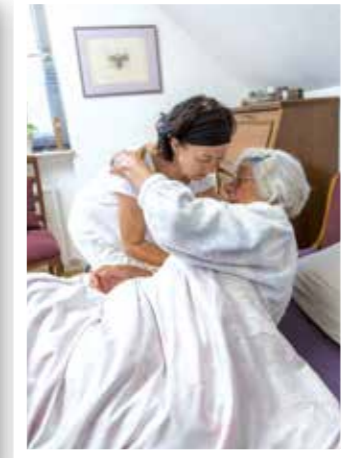
Senioren Seite 17 Plötzlich Pflegefall