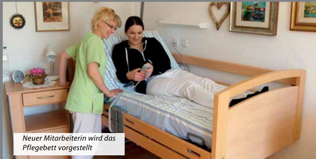
Neuer Mitarbeiterin wird das Pflegebett vorgestellt