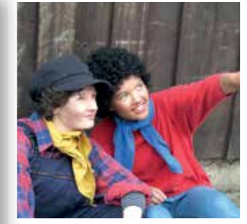
Verlosung Seite 45