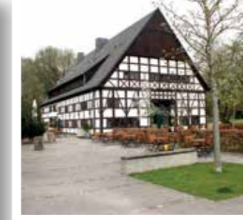
Bad Sassendorf Seite 11