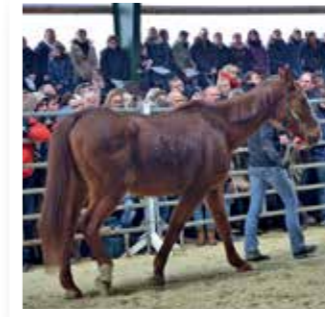
Soest Seite 4

Redaktion: Reinhold Häken redaktion@fkwverlag.com Satz: FKW Fachverlag GmbH Druck: Senefelder Misset, Doetinchem Erscheinungsweise: monatlich Verbreitungsgebiet: Hausverteilung in Soest, über 200 Auslagestellen im Umland Erfüllungsort: Soest Auflage: 25.000 Keine Gewähr für unaufgefordert einge- sandte Manuskripte oder Fotos. Der Ab- druck von Veranstaltungshinweisen ist kostenlos. Abdruck und Vervielfältigung redaktioneller Beiträge und Anzeigen bedürfen der ausdrücklichen Zustim- mung des Verlages. Titel: Great Lengths Straßenschild auf den Seiten 12, 24, 28, 37, 42, 45: © sester1848 - Fotolia.com