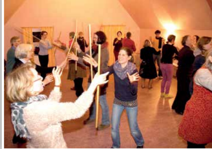
Angehende Eurythmisten gehen nicht am Stock, sondern werfen ihn rhythmisch durch die Luft.