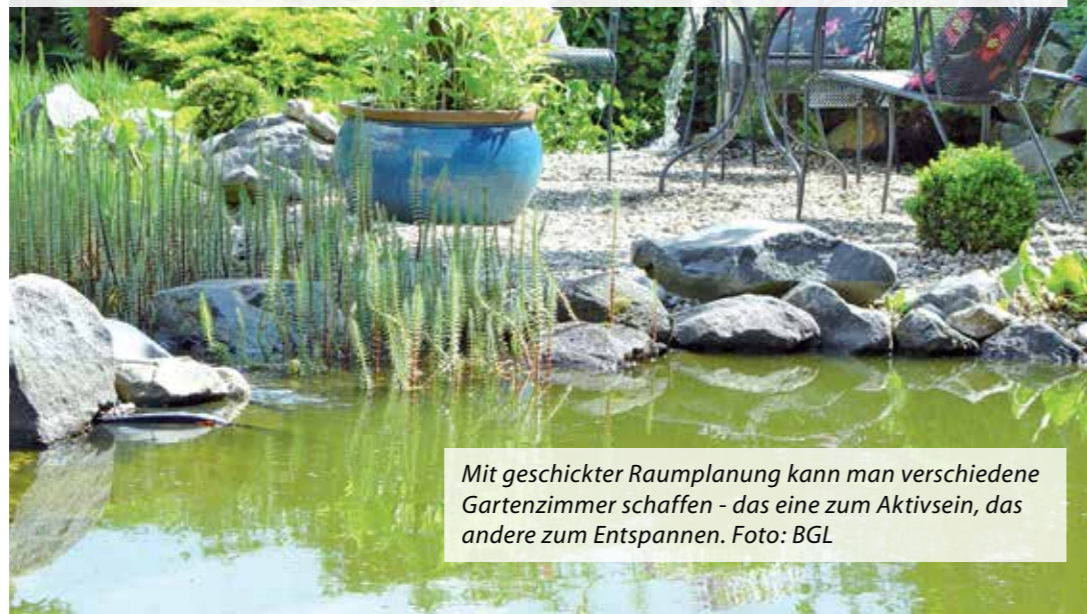
Mit geschickter Raumplanung kann man verschiedene Gartenzimmer schaffen - das eine zum Aktivsein, das andere zum Entspannen.

BAUMWURZEL FRÄSDIENST.de Elmar Maas Rindenmulch Telefon: 0 29 45/200 110