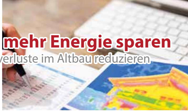
Die Analyse, die der Energieberater etwa mit Wärmebildaufnahmen des Zuhauses vornimmt, mündet in einen individuellen Sanierungsfahrplan.

Nur welche Maßnahme ist im Die Fachleute nehmen eine in-