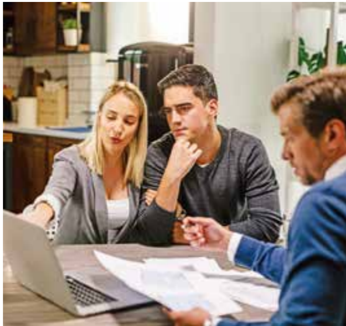
Mit Plan sanieren: Eine individuelle Energieberatung zeigt den Handlungsbedarf im Altbau auf. Meist steht die Wärmedämmung dabei an erster Stelle.