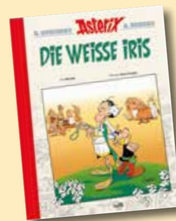
Foto: ASTERIX®-OBELIX®-IDEFIX® /© 2023 Hachette Livre/ Goscinny-Uderzo

Der neue Gegenspieler von Asterix und Obelix ist der scheinbare Weltverbesserer Visusversus, der mit seiner manipulativen Methode ganz Gallien auf den Kopf stellt. Der neue Band von Egmont Ehapa Media ist ab sofort als Softcover für 7,99 Euro, Hardcover für 13,50 Euro sowie als Luxusausgabe für 59 Euro (ab 7. November) im Handel sowie unter www.egmont-shop.de erhältlich. Oder Sie machen einfach bei unserer Verlosung mit und sichern sich Goodies, die es nicht im Handel gibt! Wir verlosen 2 Asterix-Überraschungspakete plus 1 Luxusedition! Senden Sie einfach eine E-Mail mit