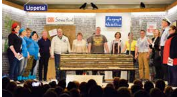
Nach dem Erfolg von „Es fährt ein Zug nach Nirgendwo“ proben die Mitglieder der Theatergruppe Lippetal jetzt fleißig für das neue Stück.