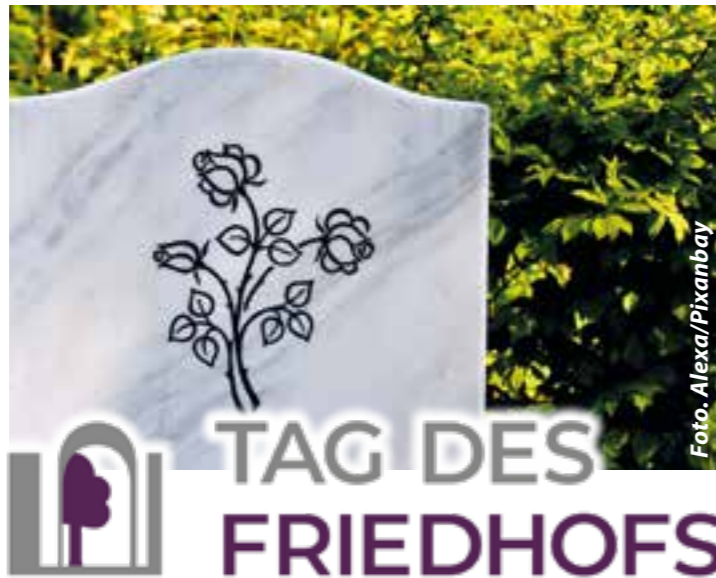
Pressefoto: Logo Tag des Friedhofs

Ab 2023 fungiert der Verein zur Förderung der deutschen Friedhofskultur e.V. (VFFK e.V.)