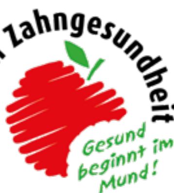
Foto: Logo Tag der Zahngesundheit

Der Tag der Zahngesundheit 2023, der wie jedes Jahr am 25. September stattfindet, nimmt die Schwierigkeiten vulnerabler Gruppen in den Blick, ihre Gesundheit, vor allem ihre Zahngesundheit, aktiv in die Hand zu nehmen. Unter dem Motto „Ge-