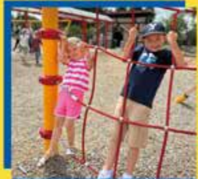
Kindermode - alles reduziert

T-shirts II. Wahl z.B. 19,95 5,90 7,90 z.B. 39,99 9,90 12,90