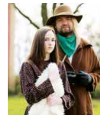
General Jeremiah Watkins.

Im Freilichttheater-Sommer kommt erstmalig der Wilde Westen auf die Burgbühne Stromberg. Die Geschichte spielt in Texas kurz nach dem amerikanischen Bürgerkrieg.