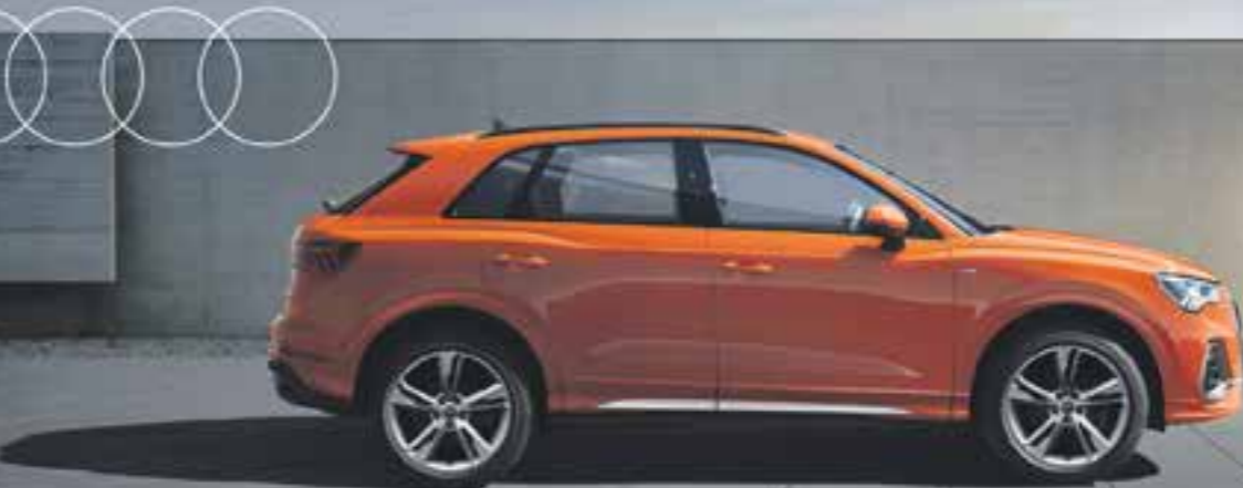
Vorsprung durch Technik

Jetzt für Businesskunden 1 : Attraktive Konditionen für ausgewählte Q-Modelle.