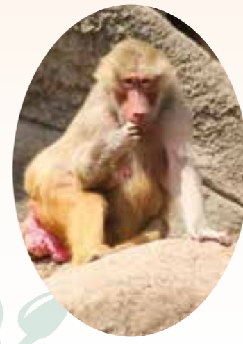
Kolibri: 1b,2a,3c Tapir: 1c,2b,3a Pavian: 1c,2b,3c