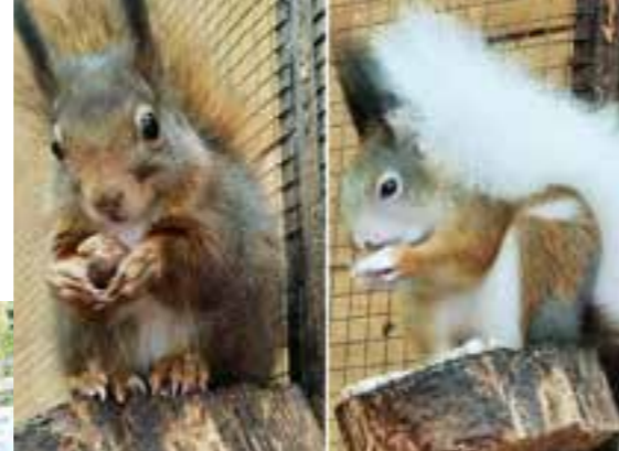
Olivia und Finchen (mit dem weißen Schwanz).

Die vier Bleibehörnchen bilden allerdings die Ausnahme. In der Regel päppelt Christiane Bierwas die Eichhörnchen auf und wildert sie in einer eigenen Voliere auf einem Privatgrundstück im Wald in Büninghausen aus. In 2022 hat sie sich um 67 Eichhörnchen gekümmert, von denen sie 56 wieder erfolgreich auswildern könnte. „Dass nicht alle überleben, gehört leider auch dazu.“ „Wenn sie keine Lebensqualität mehr haben, dann muss man sie erlösen, das geht nicht. Mir ist immer wichtig, dass sie sich richtig bewegen können und keine Schmerzen haben. Ich gebe ihnen zwar Namen, aber ich kann sie gut wieder abgeben. Es gibt nichts Schöneres, als ein gepäppeltes Hörnchen in der Wildnis zu sehen.“ Ihr Ehrenamt ist recht aufwendig, denn als offizielle Pflegestelle muss sie genau aufzeichnen, wann sie welches Hörnchen bekommen hat, warum und ob es wieder freigelassen wurde oder verstorben ist. Bei Betriebskontrollen muss sie alle Unterlagen auf Verlangen zeigen können. Ihr Einsatzbereich reicht von Hamm, Lippstadt, Soest und natürlich Lippetal und dem Rest von Kreis Soest bis hin nach Ahlen oder auch mal Münster. Sie