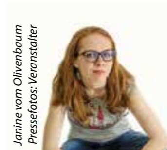
Janine vom Olivenbaum