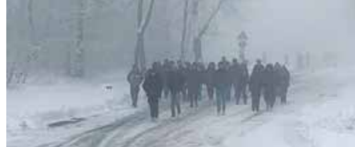
Krasser Kontrast: Bei Nebel und Kälte besichtigen die Schülerinnen und Schüler das KZ Buchenwald, während sich die Stadt Erfurt freundlicher und zum Teil bunt zeigt.