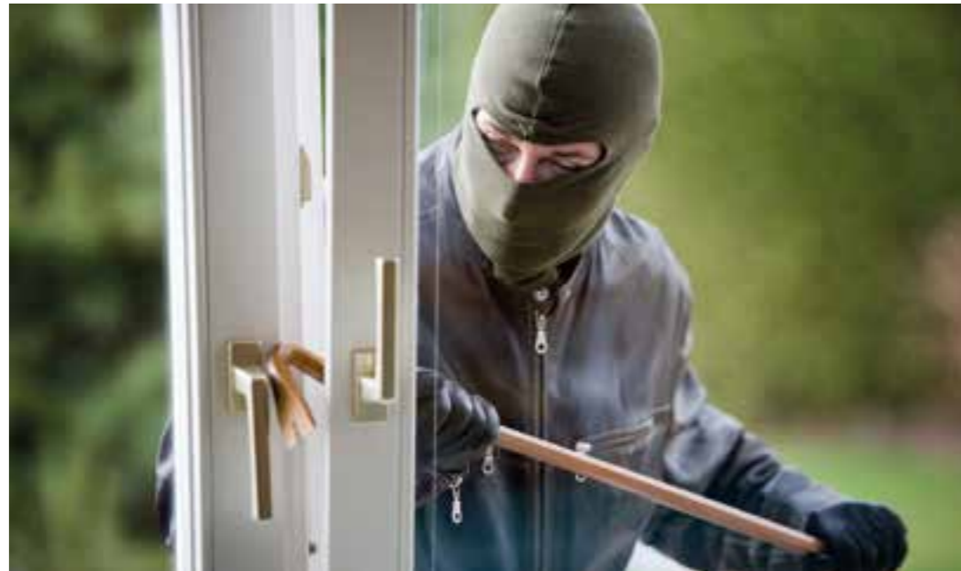
Gekippte Fenster bieten Einbrechern ideale Einstiegshilfen.

Pünktlich zur Umstellung auf die Winterzeit begeht Deutschland den „Tag des Einbruchschutzes“. Rund um diesen Termin, der 2022 auf den 30. Oktober fällt, machen Polizei und Sicherheitsanbieter auf die nach wie vor hohe Einbruchgefahr in private Häuser und Wohnungen aufmerksam.