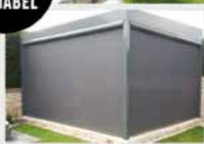
WOHLFÜHLEN ZU JEDER JAHRESZEIT

MASSGESCHNEIDERTE ÜBERDACHUNGEN SO INDIVIDUELL WIE SIE