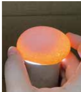
Ei nach drei Tagen in der Brutmaschine