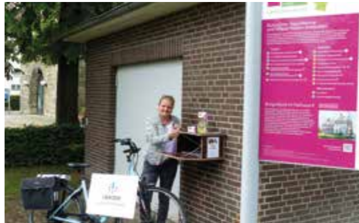
Stempelbox zwischen Rathaus II und Kirche. Stempelpass gibt's im Bürgerbüro, Bahnhofstr. 1. Weitere Infos unter Telefon 02923/980228.

Beeindruckende Landschaften, historische Kulturdenkmäler und spannende Naturerlebnisse – die EntdeckerRoute Wasser.Wege.Winkel verbindet auf 130 Kilometern Strecke gleich sieben Städte und Gemeinden in den Kreisen Soest, Paderborn und Warendorf. In diesem Jahr können Radfahrer ihren Ausflug in die Region Lippe-Möhnesee gleich noch mit einer Stempelpass-Aktion verbinden und mit etwas Glück lukrative Preise gewinnen.