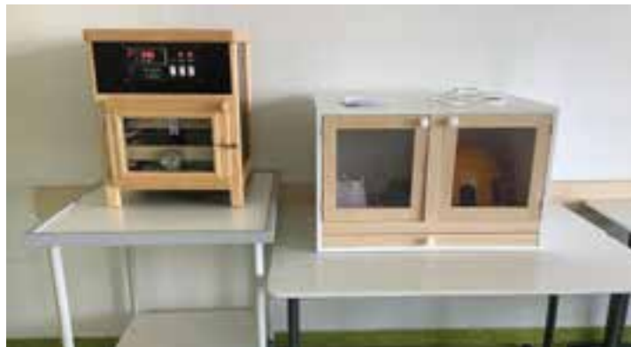
Brutmaschine und Käfig vor dem Aufbau