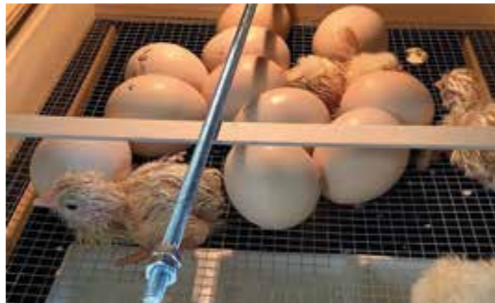
Küken schlüpfen nach 21 Tagen.

Wie sich sicherlich schon herumgesprochen hat, wurde in den 5. Klassen im Rahmen des NW-Unterrichts ein besonderes Projekt durchgeführt: „Vom Ei zum Huhn“. Aus befruchteten Hühnereiern wurden Küken ausgebrütet.