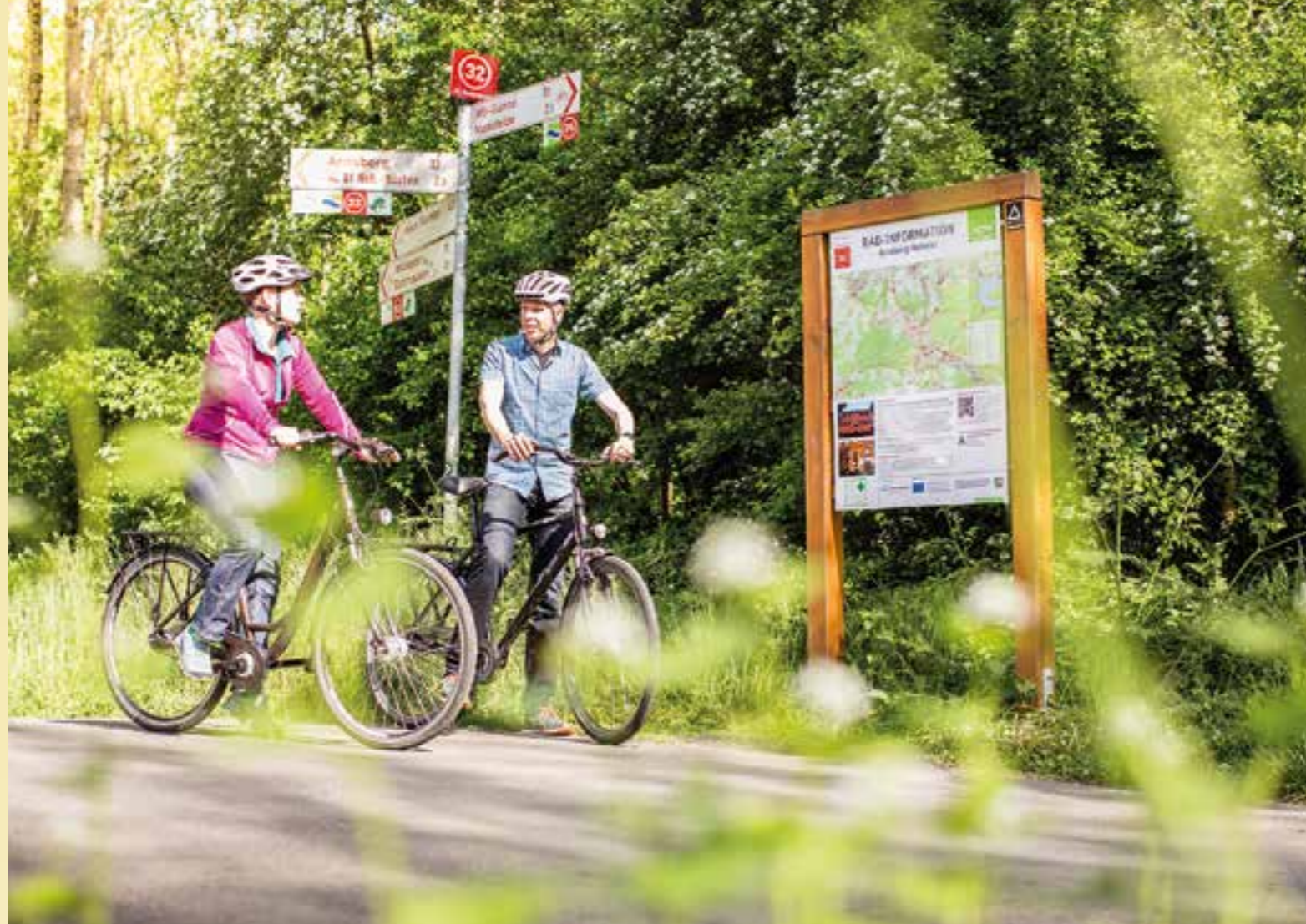
Rund um Soest macht das Knotenpunktsystem die Orientierung beim Radfahren leicht.

Wie wäre es zum Beispiel mit einer leichten, 47 Kilometer langen Rundfahrt durch das Soester Stadtgebiet über Welver ins Lippetal? Die Radroute verläuft hauptsächlich durch Soester Stadtgebiet und die Gemeinde Lippetal, streift aber auch noch das Welveraner Gemeindegebiet. Wie ihr Name sagt, liegen drei markante Schlösser und Herrensitze am Wegesrand. Haus Nehlen (zwischen KP 51 und 8, Abstecher von Stocklarn Richtung Berwicke), Haus Assen bei KP 06 und Schloss Hovestadt bei KP 10.