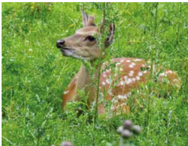
Wild hautnah erleben im Bilsteintal.

Egal, ob man mit der Familie Abenteuerliches erleben möchte oder mit Freunden ein paar Stunden lang Spaß haben oder die Seele baumeln lassen will: Es gibt genügend Optionen, eine gute Zeit zu verbringen.