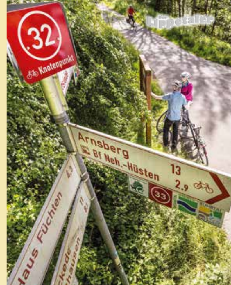
Jeder Knotenpunkt im Radwegenetz trägt seine eigene Nummer und Wegweiser in alle Richtungen.

Die neuen und kostenlosen Radplanungskarten sowie passende Lenkeranhänger sind im Rathaus Lippetal erhältlich. Weitere Infos finden Sie auch unter www.radeln-nach-zahlen.de , www.parklandschaft-warendorf.de/radfahren/radwegenetz-muensterland sowie www.lippetal.de/tourismus_freizeit/tourismus/radfahren/radnetz.php . (dzi/djd)