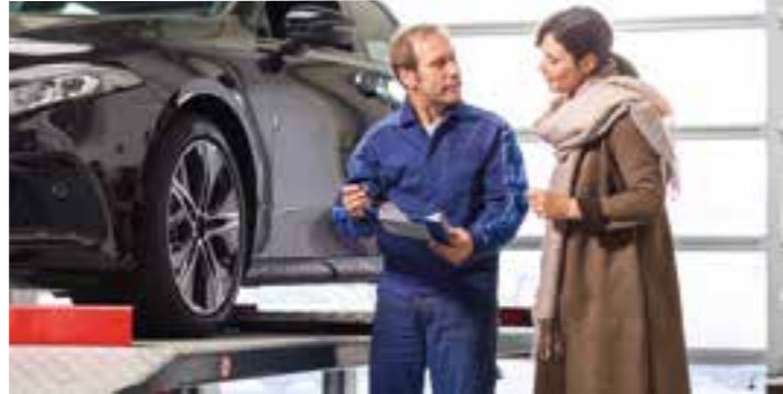
Auf der Hebebühne lassen sich die Spuren des Winters an Fahrgestell, Unterboden, Bremsen und Reifen genau unter die Lupe nehmen.