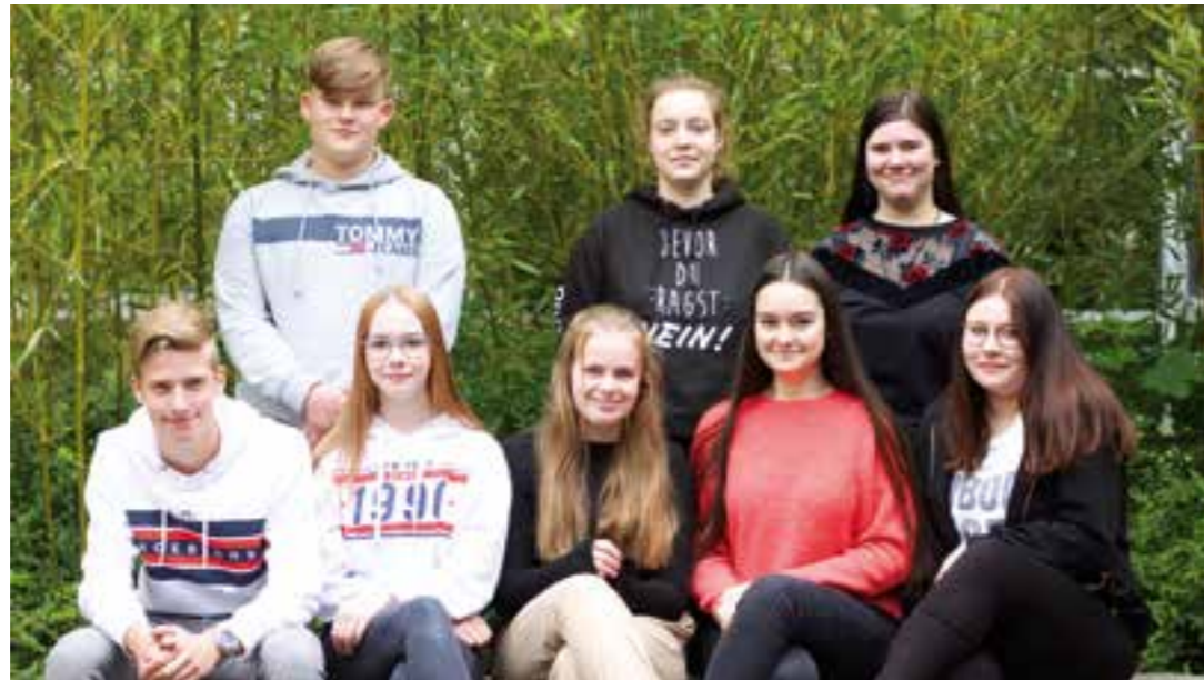
Die Paten und Streitschlichter.

Die Mädchen und Jungen durchlaufen eine Grundausbildung in verschiedenen Bereichen. Anschließend wirken sie z.B. als Schulsanitäter, Paten bzw. Streitschlichter, Sporthelfer, Medienscouts und/oder Sozialpraktikanten in sozialen Einrichtungen. Ganz neu ist die Tontechnik-AG. Die Tontechniker sind dafür zuständig, dass bei allen Veranstaltungen der Schule ein guter Ton herrscht, man alles verstehen kann und Musik weder zu laut, noch zu leise ist. Wie das funktioniert, lernen sie in der Tontechnik-AG und wenden dann ihre Fähigkeiten in Zusammenarbeit mit den Hausmeistern auf Schulveranstaltungen an.