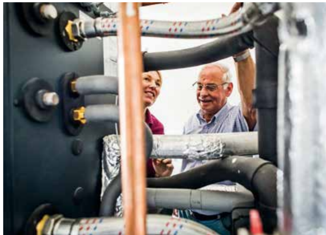
Im Rahmen eines Instandhaltungs-Checks nimmt ein unabhängiger Sachverständiger alle Teile des Hauses gründlich unter die Lupe.

Außen- und Kellerwänden oder Estrich von 30 Jahren. „Wer sich über den Zustand seiner älteren Immobilie unsicher ist, der kann auch einen professionellen Immobilien-Check durchführen lassen, unter www.bsb-ev.de gibt es dazu mehr Informationen und ein kostenloses Ratgeberblatt „Instandhaltungs-Check fürs Haus“.