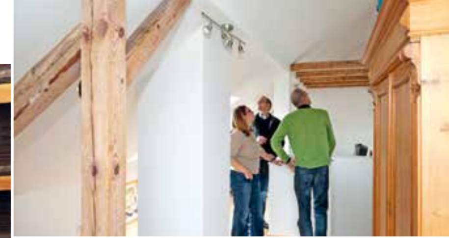
Unabhängige Bausachverständige können in älteren Immobilien auch auf versteckte Schwachstellen hinweisen.