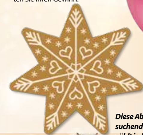
Diese Abbildung zeigt die zu suchenden Sterne. Dieser hier zählt jedoch nicht mit!

und dem Stichwort „Lippetaler Weihnachtsverlosung 2019“ bis zum 12. Dezember an den F.K.W. Verlag, Delecker Weg 33, 59519 Möhnesee. Mit etwas Glück haben Sie noch vor Weihnachten eine kleine Überraschung in den Händen. Der Rechtsweg ist ausgeschlossen. Gegen Vorlage Ihrer Gewinnbenachrichtigung erhalten Sie Ihren Gewinn.