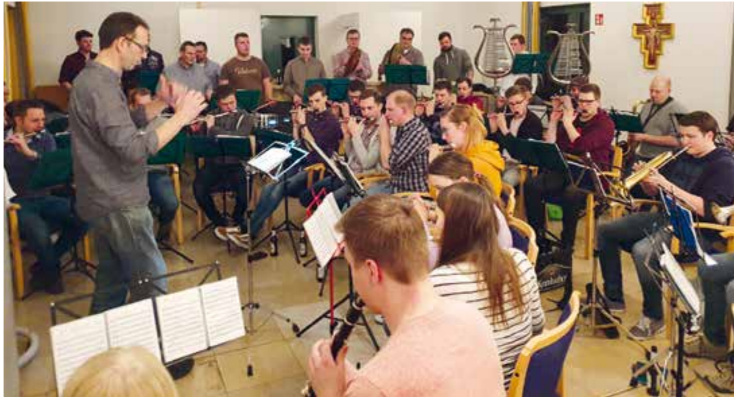
Gemeinsam mit dem Bläserorchester Stromberg wird fleißig für die Jubiläumskonzerte geprobt.