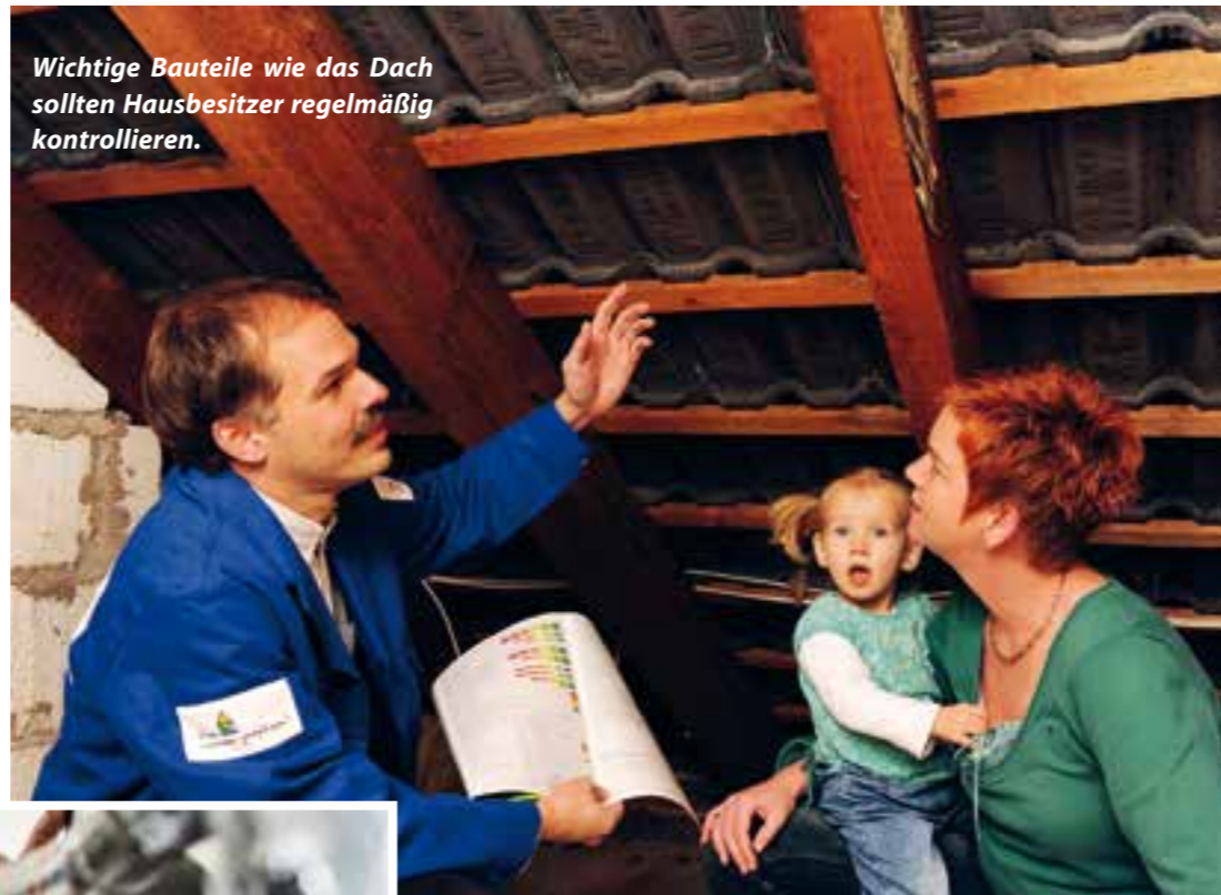
Wichtige Bauteile wie das Dach sollten Hausbesitzer regelmäßig kontrollieren.

Alle drei bis fünf Jahre unter die Lupe zu nehmen sind Schornsteinköpfe, Außenputze und Fassadenanstriche sowie Rohrleitungen und Heizkörper im Haus. Für Lichtschächte, Innenputze, Fliesen oder Parkett genügt ein Kontrollintervall von etwa zehn Jahren, für die Konstruktion von