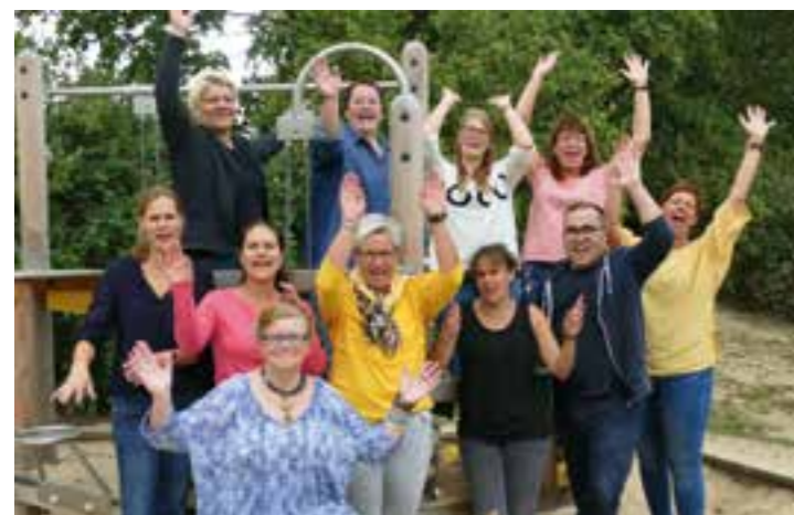
Das Team des Familienzentrum St. Albertus in Hovestadt

Das Familienzentrum St. Albertus in Hovestadt, Nordwalder Straße 17, ist in der Trägerschaft der kath. Kindertageseinrichtung Hellweg gem. GmbH. Das Erzieher-Team betreut aktuell 67 Kinder in drei Gruppen. Die Einrichtung liegt ruhig und in der Nähe eines Spielplatzes, der gerne genutzt wird. Das Familienzentrum ist ein großes, helles, offenes Haus mit vielen Möglichkeiten und engagierten, motivierten Fachkräften, die die Kinder in ihrer ganzheitlichen Entwicklung unterstützen