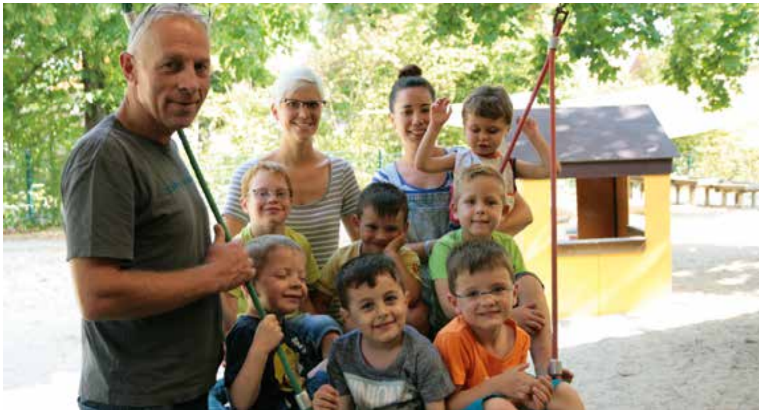
St. Barbara Hultrop. Nicht alle konnten aufs Foto.

Wo soll mein Kind in den Kindergarten gehen? Welche Bedürfnisse hat es? Welchem pädagogischen Konzept folgt der Kindergarten? Haben Sie sich das auch schon gefragt? Dann sind die nächsten Seiten Ihnen vielleicht eine Hilfe. Wir stellen Ihnen die Kindergärten der Gemeinde vor.