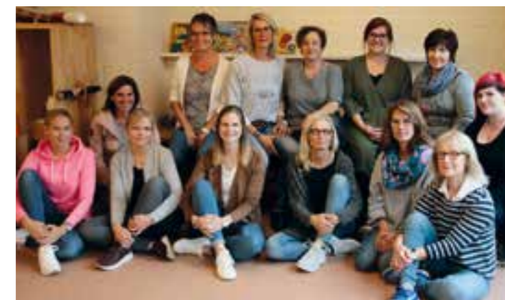
Das Team des Bertgerus Kindergarten Herzfeld

Auch im St. Ida Kindergarten, St. Ida-Straße 1, wird nach dem teiloffenen Konzept gearbeitet. Elf Erzieherinnen betreuen 68 Kinder von zwei bis sechs Jahren in drei Gruppen. Kinder mit besonderem Förderbedarf finden hier ebenso ihren Platz. Das vielfältige Angebot orientiert sich an den Bedürfnissen des Kindes (situationsorientierter Ansatz). Sie können sich selbst verwirklichen und entscheiden, wann sie mit wem was wie lange spielen. Ob nun künstlerische Entfaltung in der Kreativwerkstatt, gemeinsames Lesen in kleiner Gruppe oder die Beschäftigung mit den unzähligen Spielmöglichkeiten – die Kinder können sich frei entfalten. Lernanfänger werden in der Vorschul-AG u.a. spielerisch an Farben, Formen, Zahlen und Buchstaben herangeführt. Die Einrichtung bietet ein großzügiges Außengelände, auf dem eine sehr alte Weide steht. Im Schatten des großen Baumes lässt sich wunderbar die Welt entdecken. „Uns ist es wichtig, den