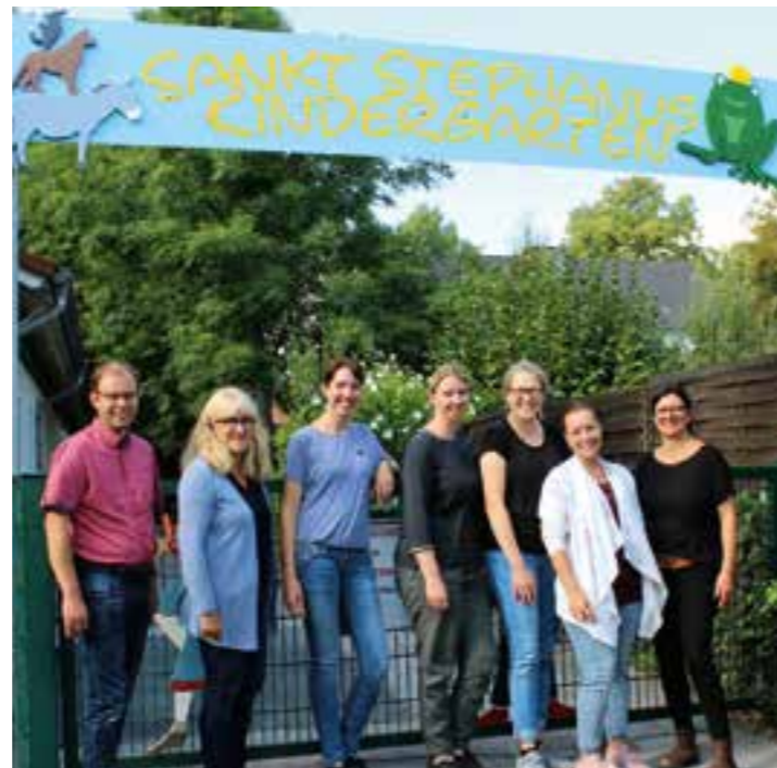
Das Team des St. Stephanus Kindergarten in Oestinghausen

und fördern. Gearbeitet wird hier nach dem teiloffenen Konzept. Durch gruppenübergreifende Projektarbeit lernen sich die Kinder und die Erzieherinnen aller drei Gruppen intensiver kennen. So wird die individuelle Förderung des Kindes möglich. St. Albertus ist eine integrative Einrichtung, hier werden Kinder mit und