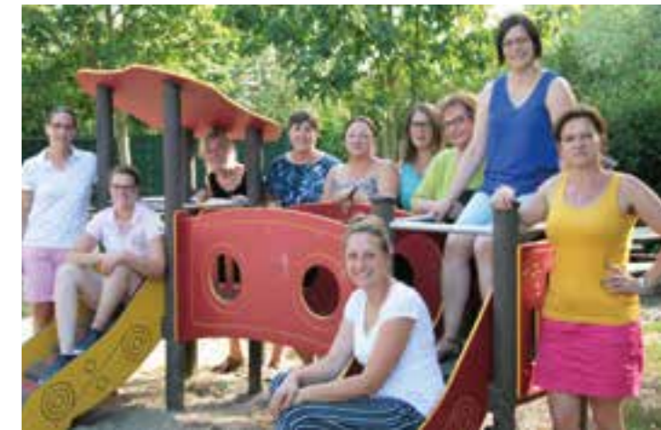
Das Team des St. Ida Kindergarten Herzfeld

In Brockhausen-Thöningsen besuchen 26 Zwei- bis Sechsjährige den Evangelischen Kindergarten „Abenteuerland“ in der Brockhauser Straße 23. Die eingruppige Einrichtung ist in der ehemaligen Grundschule untergebracht, was in erster Linie bedeutet: Hier haben die Kids Platz! Weil das Gelände verkehrsberuhigt liegt, dürfen sie auch vorne im autofreien Hof spielen. Als vor einigen Jahren renoviert wurde, haben die Kleinen es sich nicht