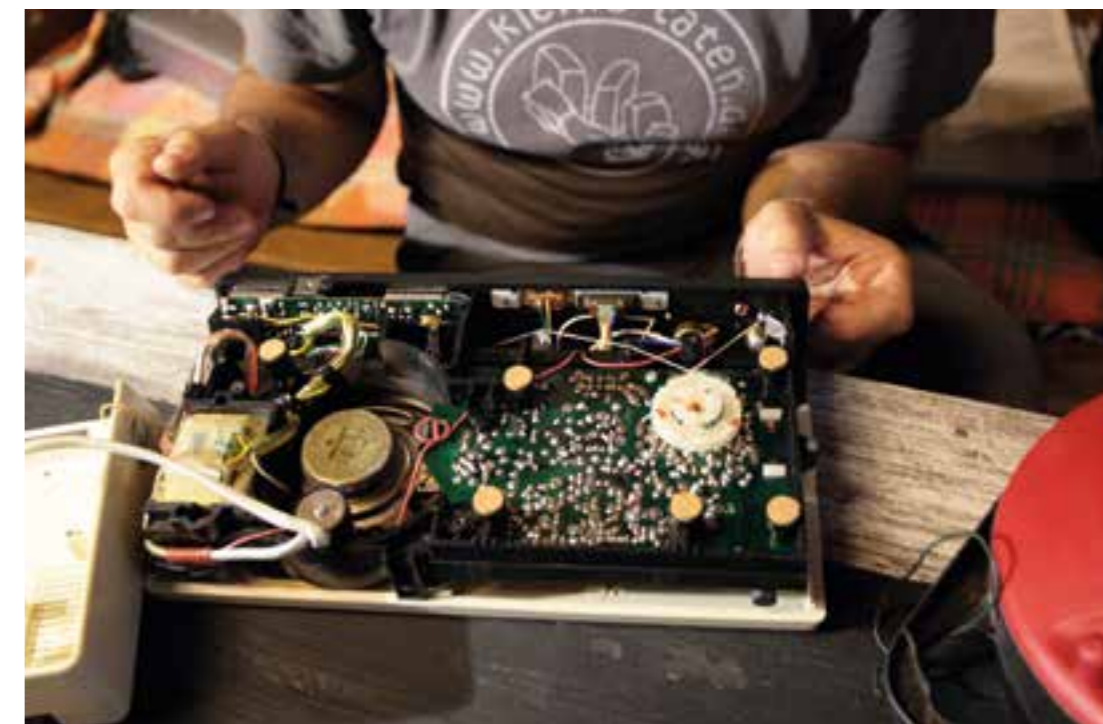
So sieht ein 50 Jahre alter Radiowecker von innen aus.